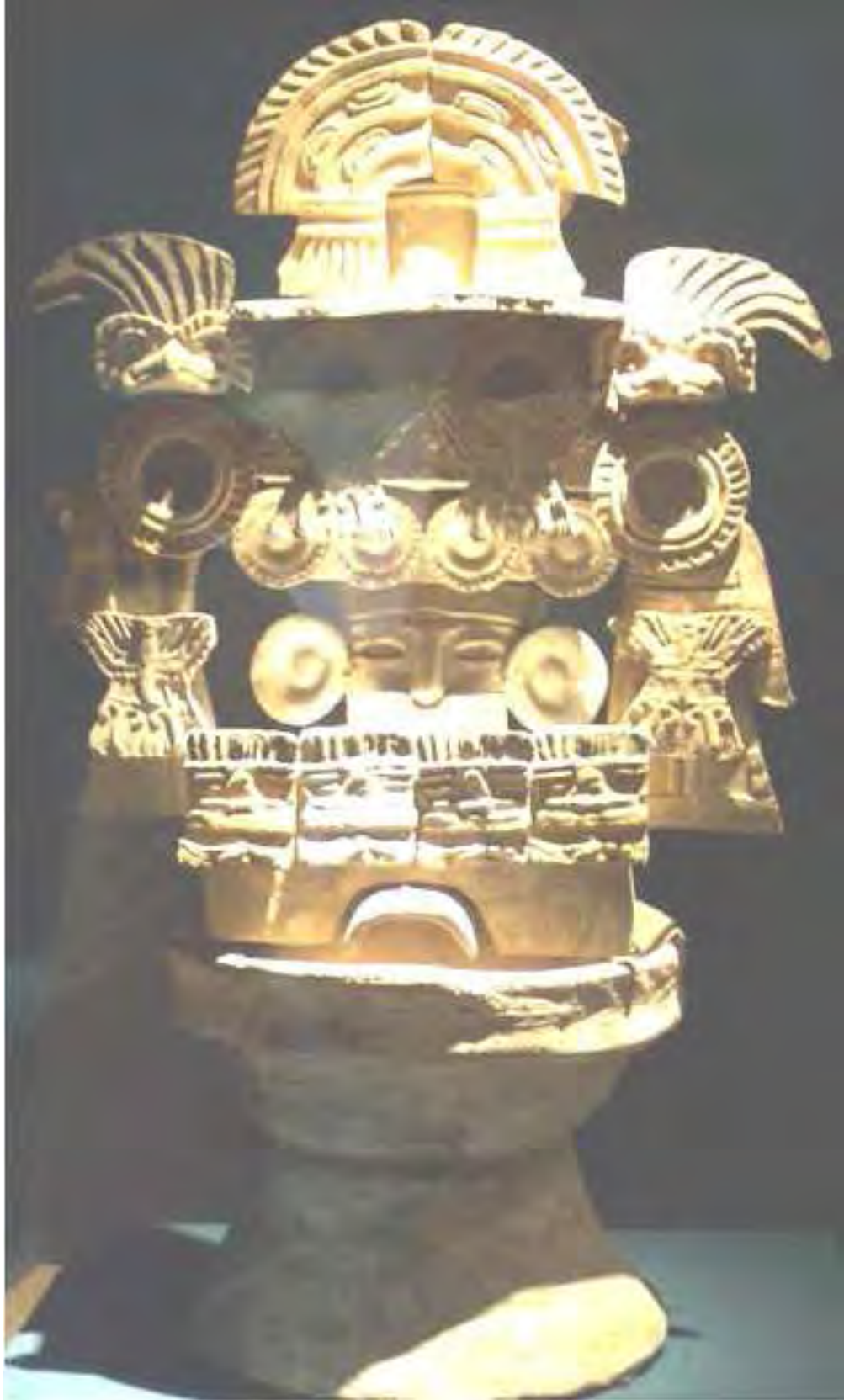
Figura 7. Incensario exhibido en el museo de sitio de Teotihuacán.