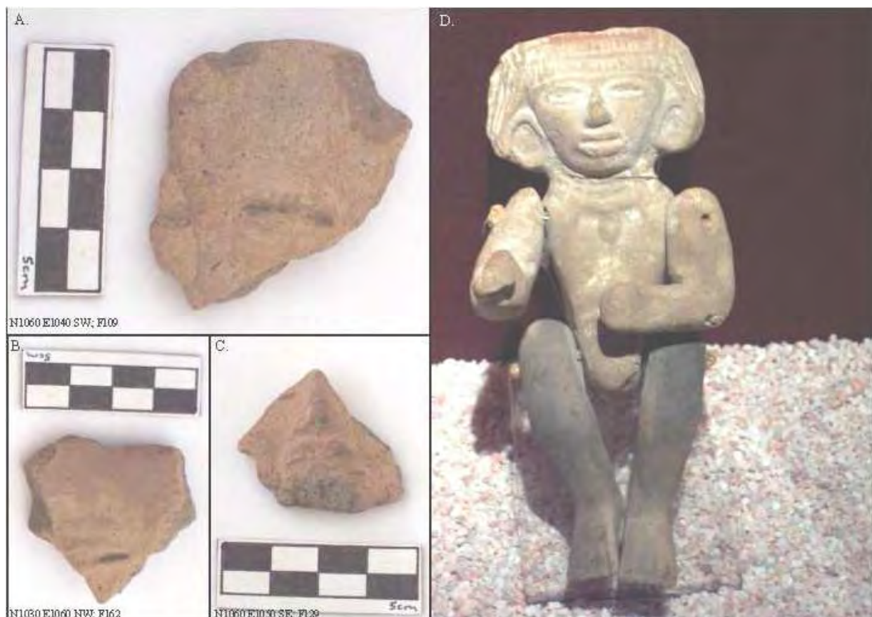
Figura 9. Cabezas similares a los moldes en la Figura 8 (A, B, y C), y a un ejemplo similar del museo de sitio de Teotihuacán (D).