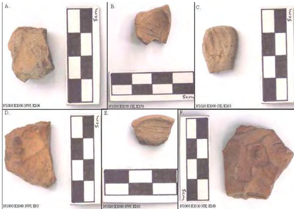
Figura 4. Moldes de figurillas y posibles moldes.