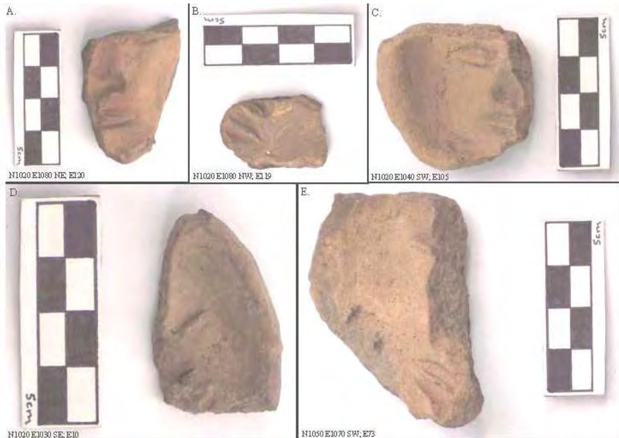
Figura 8. Moldes y posibles moldes para cabeza de figurillas títeres similares a los mostrados en la Figura 9.

Finalmente, los cinco moldes que se ven en la Figura 8 , abajo, pudieron usarse para hacer cabezas de figurillas de títeres u otras figurillas relativamente más grandes como los ejemplos en las Figuras 9 A - C , recolectados por este proyecto, y la Figura 9 D, una figurilla de títere exhibida en el museo de sitio de Teotihuacán.