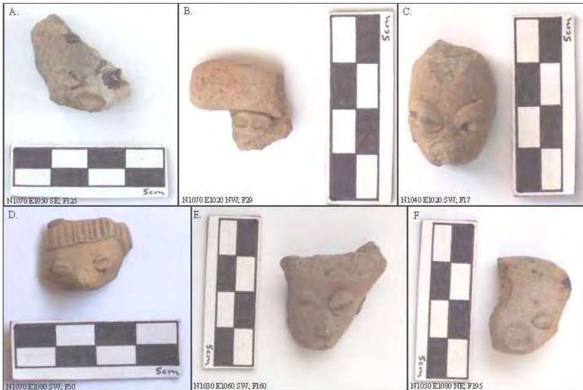
Figura 10. Figurillas Patlachique (A, B, y C) y Tzacualli (D, E, y F).