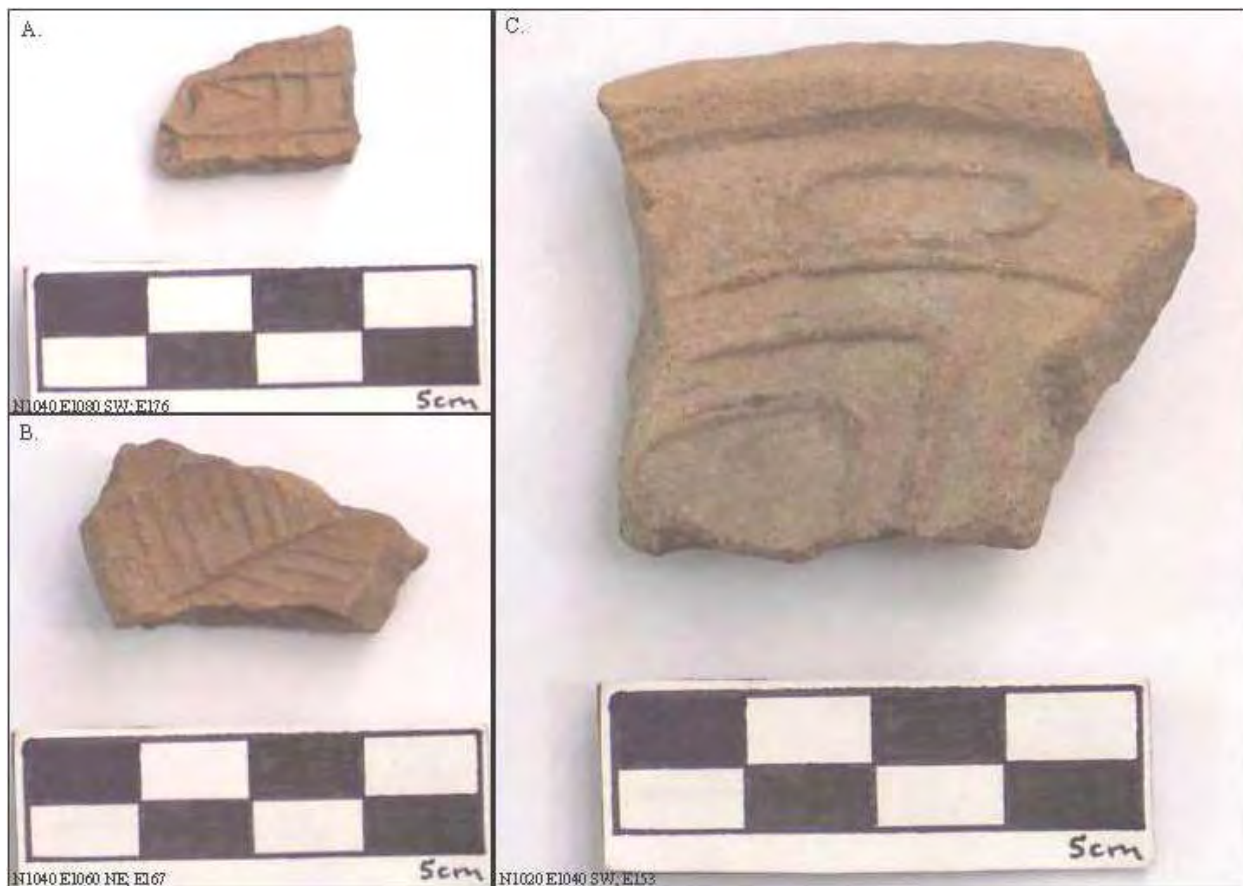
Figura 6. Moldes y posibles moldes para adornos de incensario.

Dos de los moldes mostrados en la Figura 5 pueden ser para adornos de flores ( Figura 5 A y B ) como se discute en Múnera (1985:122-123), mientras que el tercero (Figura 5 C) muestra un diseño geométrico de líneas verticales (panel superior) y un diseño ajedrezado o de cuadrícula (panel inferior). El diseño en el panel inferior es similar de alguna manera, al que se ve en los adornos discutidos por Sugiyama (1998) como encontrados en la excavación (Figura PTQ 9A1-15 y 16 en el informe de FAMSI de Sugiyama [1998]) y de las colecciones de superficie hechas por el Proyecto de Mapeo de Teotihuacán en 50:N2E3 (Figura TMP 15-36 y 37 en el informe de FAMSI de Sugiyama [1998]). Los tres ejemplos en la Figura 6 , son probablemente moldes de adorno: La Figura 6 A, muestra los rombos y barras verticales asociados con Huehuetotl, el Viejo Dios de Fuego (Séjourné 1966b:286, Lámina 65), sin embargo el tamaño pequeño de este artefacto y la falta del borde, hacen difícil determinar si este fragmento es realmente un molde o una pieza hecha con molde. La Figura 6 B es un molde para una hoja (Múnera 1985:122-123), mientras que la Figura 6 C tiene un diseño geométrico que recuerda algo a los adornos que coronan un incensario de Teotihuacán, exhibido en el museo de sitio de Teotihuacán ( Figura 7 ).