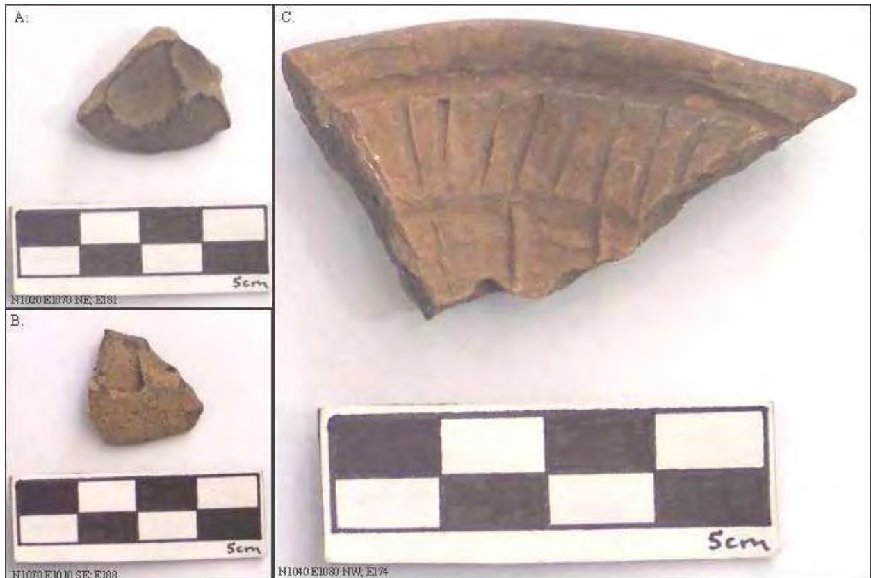
Figura 5. Moldes y posibles moldes para adornos de incensario.

Evidencia adicional incluye varios moldes para figurillas y adornos de incensario o aplicaciones, los que se dibujaron y fotografiaron ( Figura 4 , Figura 5 , mostrados arriba, Figura 6 y Figura 8 , mostrados abajo). Los moldes de figurillas en la Figura 4 incluye dos moldes para cabezas de figurillas de la fase Mazapa (Figuras 4 A y 4 D) mostrando el característico ojo en forma de almendra, que se ven en las dos cabezas de las figurillas Mazapa en las Figuras 13 A, B, y C (Goldsmith 2000:173, Ilustración 11); dos posibles moldes para producir la característica frente arrugada asociada con figurillas que representan individuos de edad (Figuras 4 B y E), un ejemplo del cual se discute abajo, y un pequeño molde para hacer una mano (Figura 4 C). El ejemplo final en la (Figura 4 F) es un molde para hacer una cabeza de figurilla con tocado y orejeras, y por lo menos dos, o posiblemente tres, vueltas de collar similar a varias figurillas de Teotihuacán mostradas en Séjourné (1966b:223, Figura 151; 226, Figura 153). El panel rectangular que se extiende abajo del tocado a lo largo del lado de la orejera puede ser un mechón de cabello como se ve en otras figurillas femeninas (Séjourné 1966b:42, Figura 22; 44, Figura 23; 45, Figura 24).