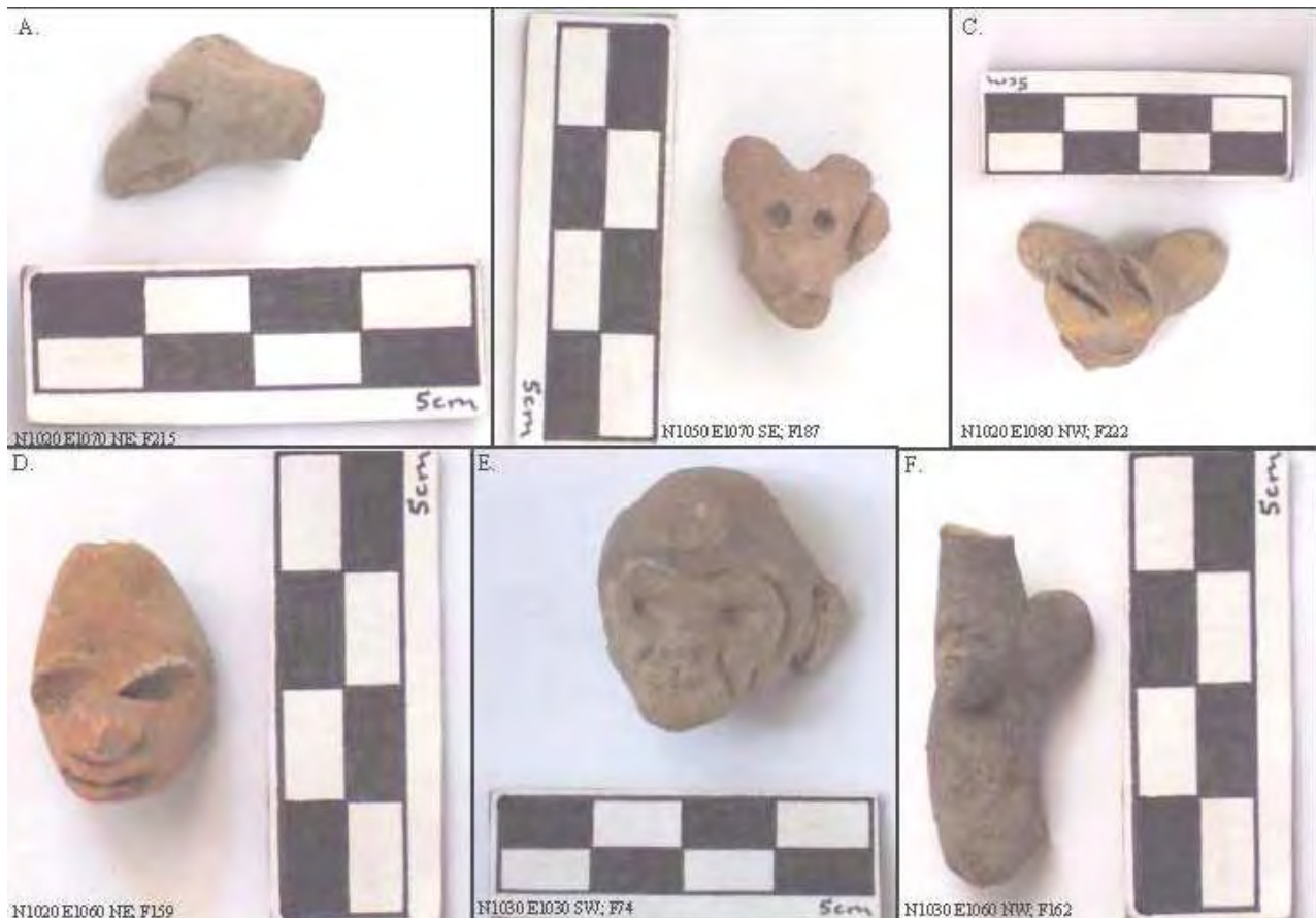
Figura 14. Figurillas de ave (A), de cánido (B y C), y de primate (D, E, y F).

La Figura 14 A es un ejemplo de los varios tipos de figurillas de ave encontradas en las colecciones de Teotihuacán (Séjourné 1966b:264, Figura 177; 265, Figura 178). Las Figuras 14 B y C son cánidos (Séjourné 1966b:258, Figura 173; 260, Figura 174; 261, Figura 175), y las Figuras 14 D, E, y F proporcionan ejemplos diferentes de monos (Séjourné 1966b:266, Figura 179). Mientras las diferencias en cómo se representan los pájaros o perros pueden reflejar la variedad de estos animales presentes (p. ej., pavos, búhos, patos; varias razas de perros), las varias imágenes de monos que se muestran aquí, pueden deberse a que algunas "figurillas" de monos, como la de la Figura 14 F, originalmente se usaron para adornar las flautas (Séjourné 1966b:266, Figure 179).