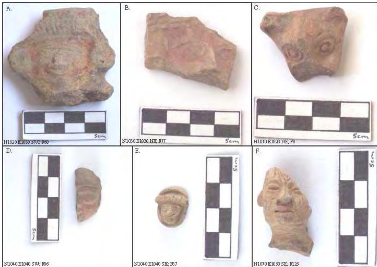
Figura 13. Figurillas Mazapá (A, B, y C), posibles deidades (D y E), y una figurilla posiblemente extranjera (F).