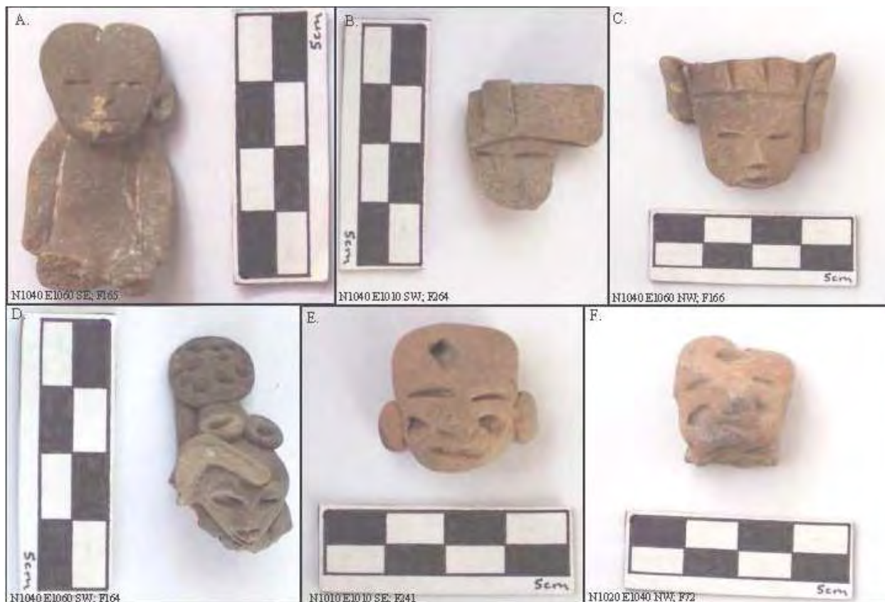
Figura 11. Figurillas Miccaotli (A, B, C, D, E, y F).

de tocados hechos manualmente, incluyendo un disco con una textura rizada que puede representar algodón (Séjourné 1966b:106-111). Los dos círculos en la frente de la figurilla, podrían representar aros de concha encontrados sobre las caras y las frentes de individuos enterrados (Séjourné 1966b:37, Figura 17; 71, Lámina 15; 137, Láminas 32 y 33; 140, Lámina 35; 141, Lámina 36; y 142, Figura 102). Las Figuras 11 E y F tienen cicatrices u otras marcas faciales hechas con estilo similar aunque no necesariamente por el mismo artesano. La figurilla en la Figura 11 E lleva orejeras y tiene una cabeza más redonda (no dividida) posiblemente similar al tipo de "cabeza redonda con orejeras" que identificó Goldsmith (2000:62; 186, Ilustración 24) mientras que el ejemplo en la Figura 11 F, tiene la cabeza dividida característica de las figurillas femeninas.