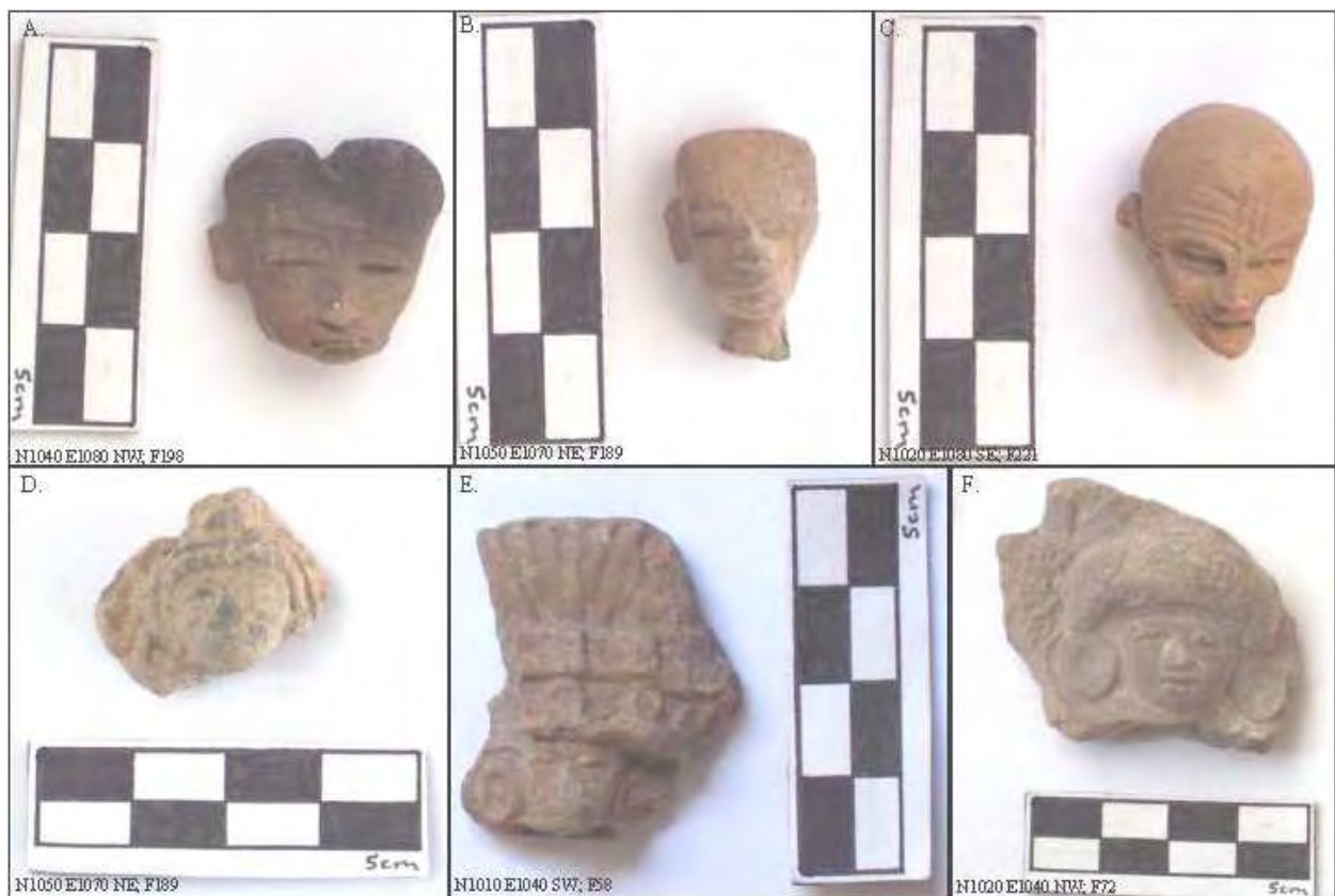
Figura 12. Figurillas Tlamimilolpa (A, B, y C), TMM (D), y Coyotlatelco (E y F).

posteriores figurillas de "retrato" hechas en molde, identificadas como guerreros (Barbour 1975, 1998; Goldsmith 2000:170, Ilustración 8) y fabricadas en el taller del recinto anexo al lado norte de la Ciudadela (Múnera 1985). Aunque la Figura 12 B tiene ya sea una oreja, o una oreja con orejera, ambas atípicas para las posteriores figurillas "retrato", es bastante similar al ejemplo de Barbour (1975:316) de la esquina izquierda superior de la Lámina 74. La Figura 12 C muestra la piel arrugada, floja y la cabeza redondeada (en lugar de dividida), usada para mostrar varones de edad (Goldsmith 2000:54-55; Séjourné 1966b:119, Lámina 25). Es evidente una oreja sobre el lado derecho de la figurilla, aunque no tiene la porción inferior de la oreja y no hay orejeras, quizás debido a quebradura. Ejemplos similares mostrando orejeras y un bracero sobre la cabeza se han identificado como Huehuetotls, aunque algunas variantes no tienen braceros ni aretes (Goldsmith 2000:179, Ilustración 17; Séjourné 1966b: 274, Figura 184; 287, Lámina 66). Sin embargo, en la ausencia de un bracero o evidencia de que estaba presente, sólo puedo sugerir, que la figurilla representa a un individuo de edad, probablemente un varón, debido a la cabeza redonda, en lugar de estar dividida (Goldsmith 2000:84; 179, Ilustración 17).