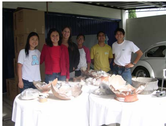
Figura 1. El equipo de campo multi-cultural estaba compuesto por arqueólogos mexicanos, japoneses, chinos y americanos de Estados Unidos y de instituciones mexicanas.

vasijas completas pero quebradas, para el estudio futuro. En el verano del 2004, la subvención de FAMSI "Producción de Alfarería Especializada y Complejidad Social en el Formativo Mixteca Alta" permitió a un equipo de arqueólogos de Estados Unidos y de instituciones mexicanas a reunirse en el verano, para un análisis intenso de cerámicas ( Figura 1 ). Los objetivos de los análisis fueron para: (a) estudiar y clasificar el material cerámico para determinar la fecha y función de las formaciones excavadas y (b) evaluar la cantidad de estandarización en el complejo cerámico para investigar la producción de alfarería especializada en el Formativo Mixteca Alta.