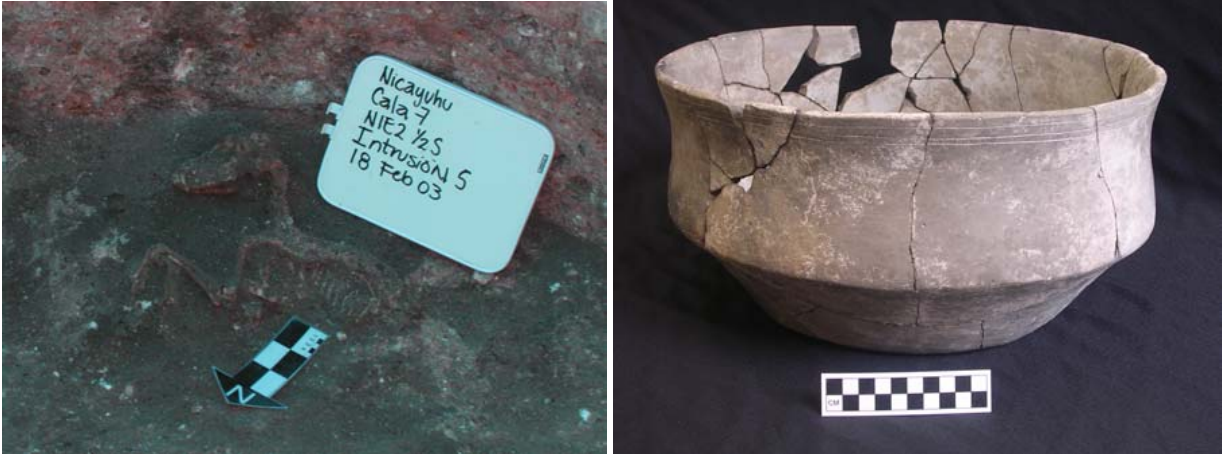
Figura 8. Restos de perro encontrados en el Formación 5 y la vasija gris casi completa que se encontró cerca.

En el fondo de la Formación 5 (-3.5 a -3.8) encontramos un número de frascos muy grandes, jarras y tecomates completos, pero quebrados ( Figura 9 ). Cuidadosamente dibujamos, fotografiamos y colectamos estas vasijas, junto con la tierra que contenían para estudios adicionales. Estos parecían estar sentados en el fondo de la formación. Todas estas vasijas eran más bien grandes y eran de pasta canela y algunas tenían decoraciones de pintura roja. En estas profundidades encontramos también unos pocos fragmentos de cuerpos pequeños con decoración tosca Fidencio de la zona punctate, el cual sugeriría una fase San José o fecha Cruz Temprano al fondo de la formación. De la Formación 5 recobramos dos muestras de carbón que se enviaron al laboratorio, una fechada aproximadamente 1449-1040 cal. a.C. (p=.991) y 1312-896 cal. a.C. (p=.980). Estas fechas corresponden con las fechas asociadas con materiales cerámicos recuperados en los niveles más bajos de la Formación 5.