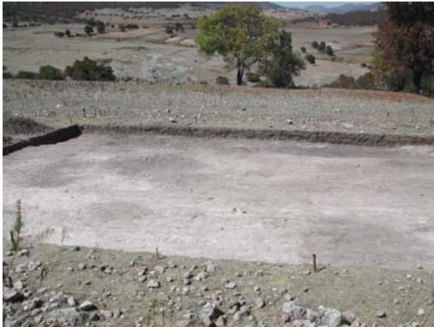
Figura 2. Manchas de tierra oscura como aparecieron antes de la excavación.

La cala, o trinchera, inicialmente se ayudó con el muestreo de la parte del frente de la terraza superior en la parte norte de la colina, y el lado de atrás de la próxima terraza de abajo. Cala 7 estaba realmente compuesta por dos trincheras, una que corre aproximadamente N-S, puesta al 12° noroeste del norte magnético, y la otra era un eje perpendicular este-oeste. El eje N-S examinaría partes de las dos terrazas adyacentes, mientras que la trinchera E-O podría probar el lado de atrás de la terraza más baja. Me enfoqué en el lado de atrás de las terrazas ya que anteriormente encontramos que estas áreas estaban protegidas de la erosión por las tierras depositadas en la terraza próxima de arriba. En este caso encontré que este pequeño detalle protegió algunas formaciones muy antiguas que vivieron más de cientos de años antes del contacto Español.