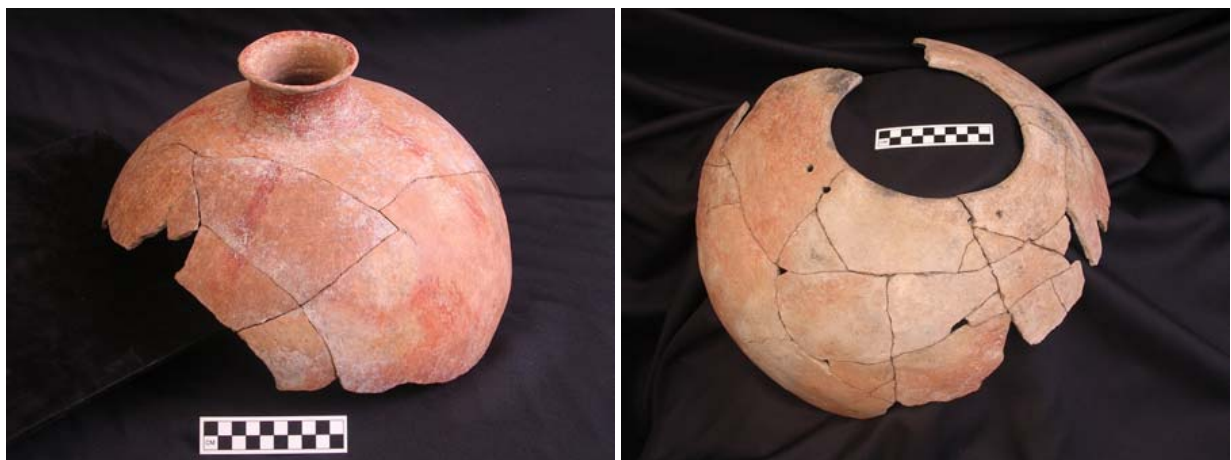
Figura 9. Vasijas reconstruidas recuperadas de la Formación 5.

En el fondo de la Formación 5 (-3.5 a -3.8) encontramos un número de frascos muy grandes, jarras y tecomates completos, pero quebrados ( Figura 9 ). Cuidadosamente dibujamos, fotografiamos y colectamos estas vasijas, junto con la tierra que contenían para estudios adicionales. Estos parecían estar sentados en el fondo de la formación. Todas estas vasijas eran más bien grandes y eran de pasta canela y algunas tenían decoraciones de pintura roja. En estas profundidades encontramos también unos pocos fragmentos de cuerpos pequeños con decoración tosca Fidencio de la zona punctate, el cual sugeriría una fase San José o fecha Cruz Temprano al fondo de la formación. De la Formación 5 recobramos dos muestras de carbón que se enviaron al laboratorio, una fechada aproximadamente 1449-1040 cal. a.C. (p=.991) y 1312-896 cal. a.C. (p=.980). Estas fechas corresponden con las fechas asociadas con materiales cerámicos recuperados en los niveles más bajos de la Formación 5.