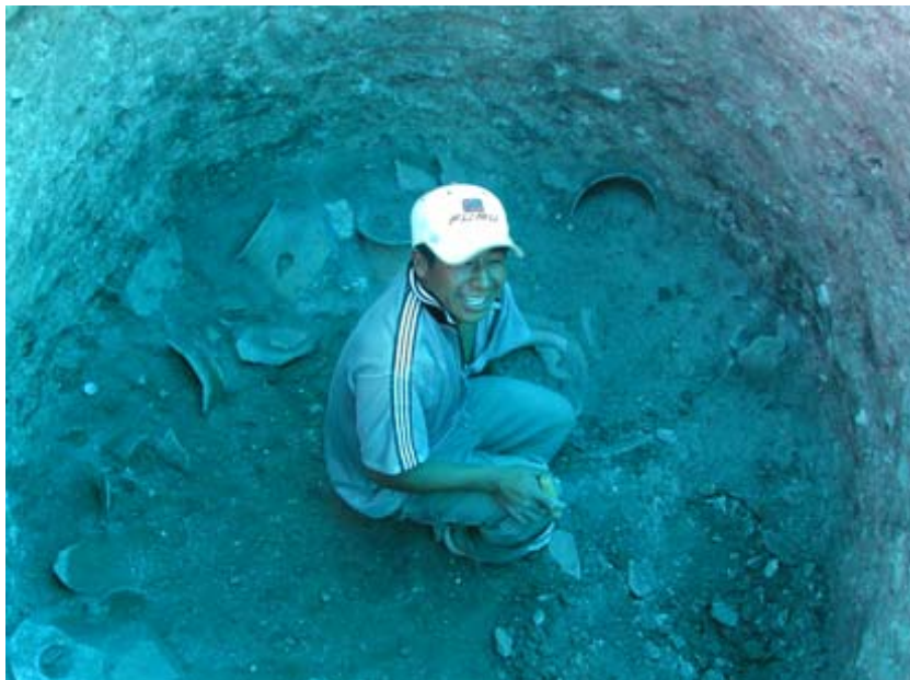
Figura 3. Alta concentración de vasijas completas pero quebradas encontradas en el fondo de la Formación 5.

Procedimos a excavar cinco formaciones. Todas ellas constaban de hileras de depósitos de tierra algunas gruesas, rellenas con cerámicas y artefactos líticos como también de hueso y otros materiales orgánicos. En el fondo de dos formaciones, Formaciones 4 y 5 ( Figura 3 ) encontramos una serie de vasijas completas pero quebradas que fueron dibujadas, fotografiadas y colectadas cuidadosamente. Proporcioné una descripción breve de cada formación junto con fotos y notas preliminares sobre sus contenidos.