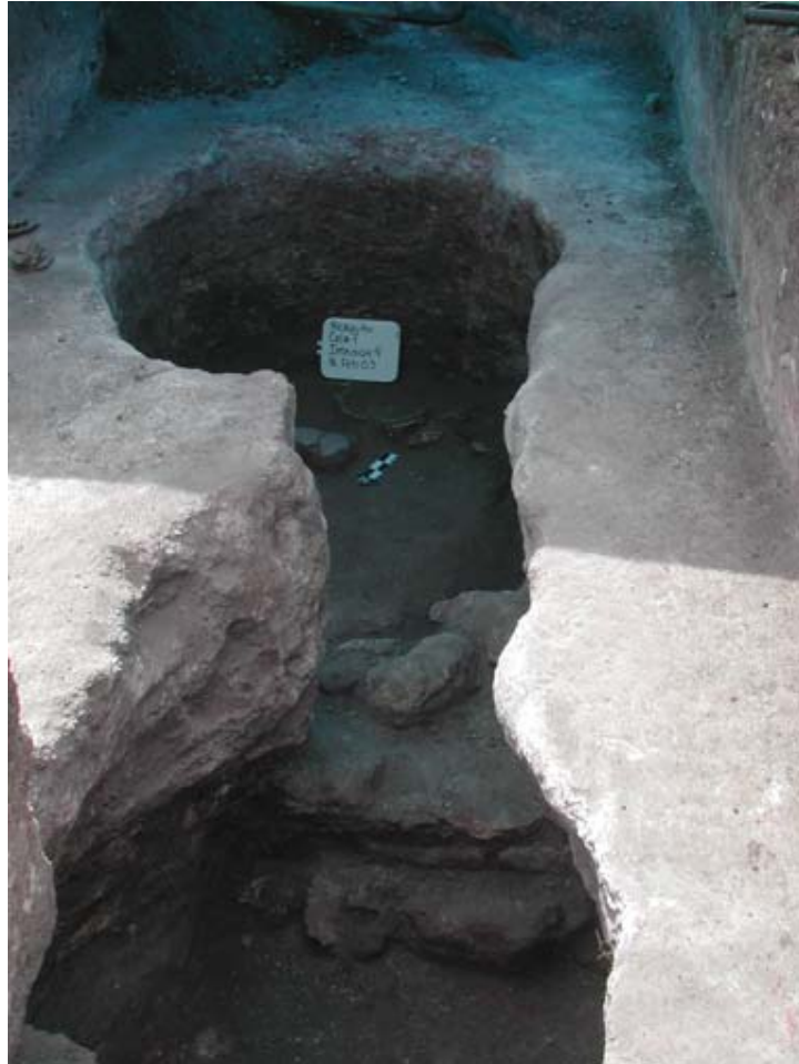
Figura 4. Forma irregular de la Formación 4 y la pared baja de endeque que divide las dos cámaras que componen la formación.

Formación 5 estaba ubicada sobre el eje E-O de Cala 7, sobre la terraza del fondo en las unidades N1E2, N2E2, y N1E3. Esta era la formación más grande, de forma circular casi perfecta y de 167 cm de profundidad.