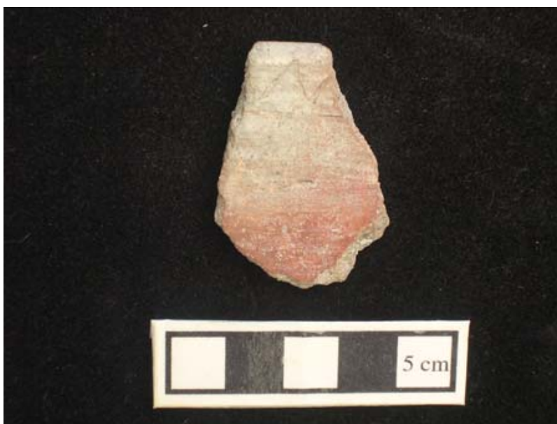
Figura 5. Carlitos Dos-Tonos.

loza Café Pulida Yucuita, loza Gris Nochixtlán, Rojo Jazmín y Blanco (Carlitos Dos-Tonos y variedades Reyes Blanco; Figura 5 ) (Spores 1972). Durante la excavación colectamos muestras de carbón muy oportunas, y en el verano del 2004 seleccioné los siete mejores para enviarlos al Centro de Estudios de Isotopo Aplicado en la Universidad de Georgia para fecharlo. Integré los resultados de radiocarbono para la siguiente discusión de las formaciones Cala 7.