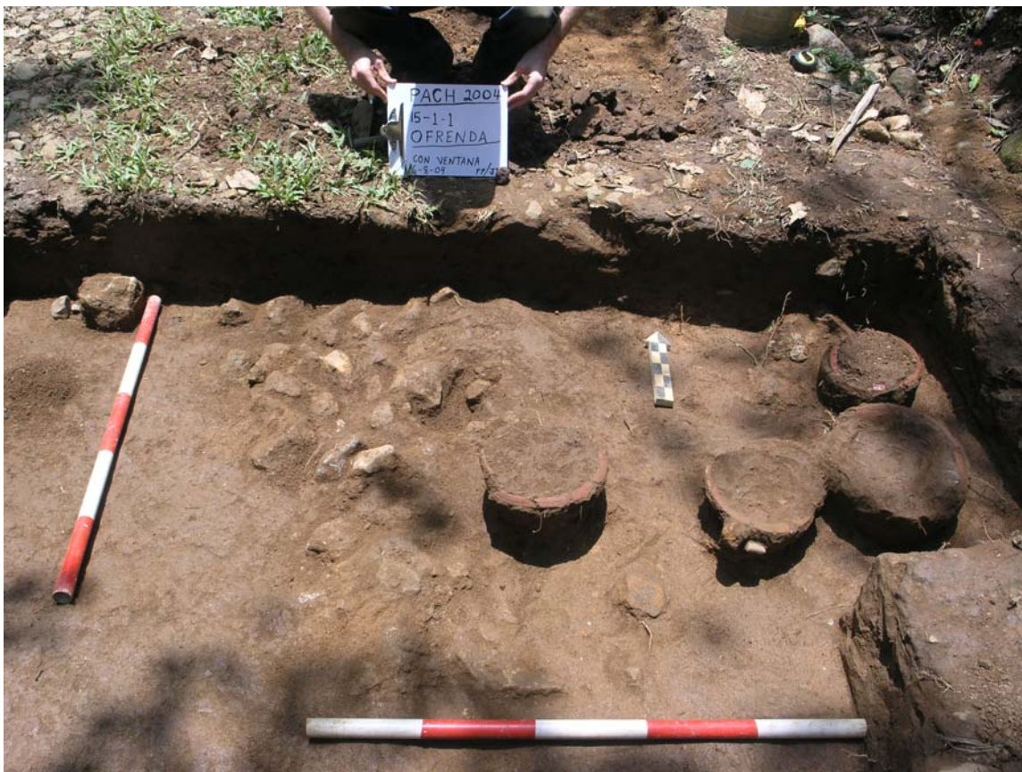
Fig. 9-3. Las vasijas colocadas sobre un piso de piedra que formaba medio rectángulo.