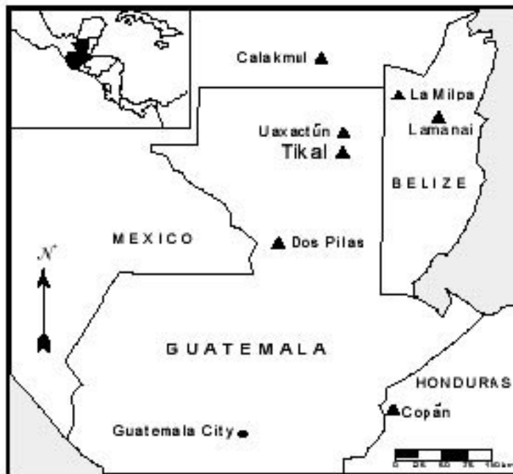
Figura 1. Las tierras bajas mayas del sur.

El objetivo de este proyecto es llevar a cabo un estudio paleoetnobotánico de los materiales vegetales de Tikal, que tal vez fue el sitio preeminente cívico-ceremonial de los antiguos mayas. Aunque realmente no se recolectaron muestras paleoetnobotánicas durante las excavaciones, se tomaron más de 1,500 muestras para fechamiento por radiocarbono (un fin para el que ya no son necesarias), muchas de las cuales pesan más de 100 gramos. El investigador principal de este proyecto, Lentz, acudió al Museo Universitario de la Universidad de Pennsylvania en mayo de 2004 para hablar con los curadores, así como inspeccionar los materiales botánicos de Tikal y prepararlos para su transportación. El personal del Museo de la Universidad fue extraordinariamente amable en todos sentidos, y enviaron los restos de plantas de Tikal al Jardín Botánico de Chicago el 20 de junio de 2004. Los restos llegaron sin incidentes, y se recibieron en buenas condiciones. Estas muestras se componen casi completamente de semillas y de madera carbonizada que fueron excavados de estratos que abarcan temporalmente entre el Preclásico (ca. 450 a.C.) y el Clásico terminal y Postclásico (ca. 900+ d.C.). Representan una extraordinaria oportunidad de estudiar las prácticas de uso de plantas de los antiguos mayas en el corazón de su principal sistema político.