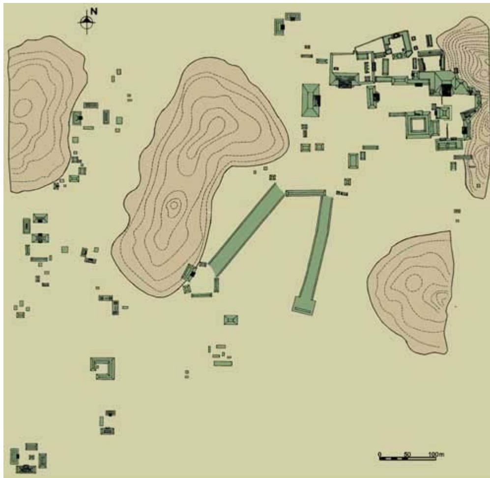
Figura 3. Plano de la ciudad de Machaquila.

Asimismo, Machaquila muestra características peculiares que no concuerdan con el patrón de la comarca (Figura 3). Lo que más asombra es la ausencia de algún Conjunto de tipo Grupo E; hay que recordar que éste es el componente fundamental en la mayoría de ciudades de la región, aun al norte y este de Machaquila. Es más, en el propio Ceibal - la ciudad más desarrollada de la región del río Pasión - este conjunto arquitectónico conforma el centro principal y de mayor antigüedad.