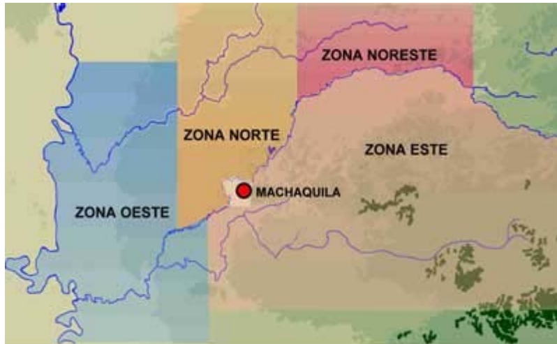
Figura 2. Sectores geográficos en la región de Machaquila.

Aunque estos sitios no son mayores, contienen conjuntos arquitectónicos que indican su complejidad, pero en ellos resalta la poca importancia de Conjuntos de tipo Acrópolis y de calzadas. A pesar de esta limitación, impacta la presencia de campos para el Juego de Pelota en tres de los cuatro sitios principales (es más, en El Achiotal hay dos campos), así como también de Conjuntos de tipo Grupo E en Esquipulas y El Achiotal - considerados como los más hacia el sur conocidos hasta ahora en Petén.