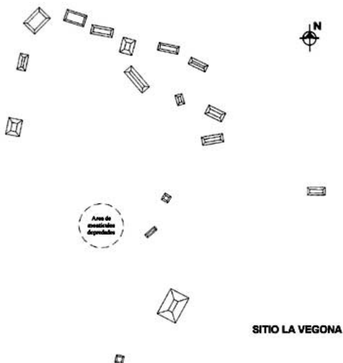
Figura 1. Sitio La Vegona.

levantamiento de cómo se encuentra en la actualidad (Fichas de registro, IDAEH; Martínez 2002; Figura 1).