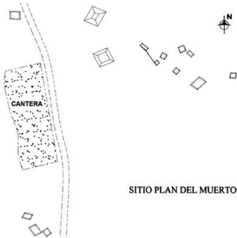
Figura 3. Sitio Plan del Muerto.