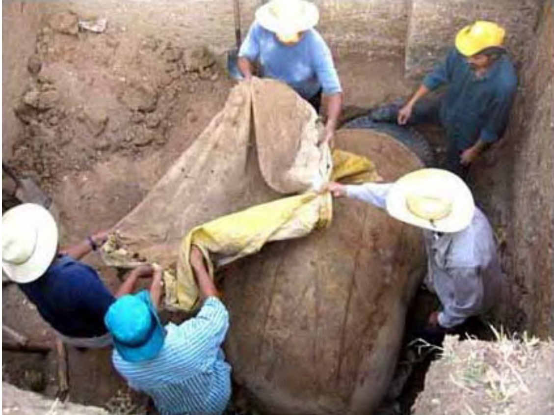
Figura 5. Los trabajadores descubren el monumento, minutos antes de ser transportado.

Como preparación al emplazamiento del monumento en las instalaciones del museo de la comunidad en Tenochtitlán, se construyó un pedestal siguiendo estrictamente las especificaciones establecidas por el Centro Regional INAH-Veracruz. Si bien el Centro Regional no tuvo éxito en la coordinación de la participación de maquinaria pesada y personal especializado de Petróleos Mexicanos (PEMEX), la remoción y transporte del monumento pudo finalmente llevarse a cabo gracias a las excelentes relaciones que mantenía el PASLT con la Refinería General Lázaro Cárdenas de PEMEX en Minatitlán, que gentilmente nos ha venido ayudando en la protección de otros monumentos olmecas del sitio a lo largo de los años.