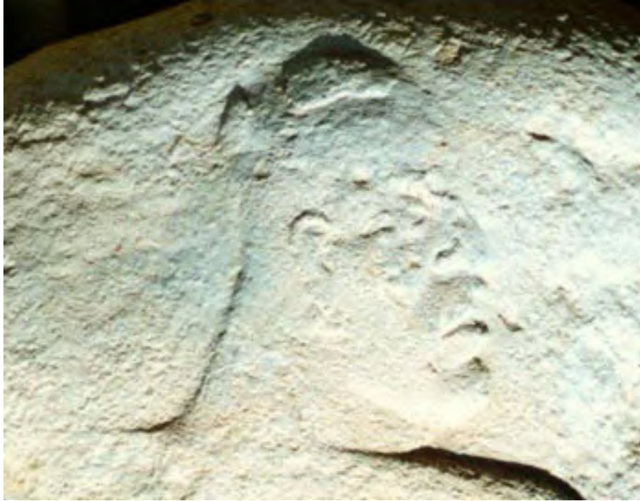
Figura 3. Primer plano del Monumento 112.

Al darse por finalizada la temporada de campo, el monumento fue dejado en su ubicación original, puesto que estaba en nuestros planes continuar con las excavaciones. Dada su profundidad, a 2.5 m por debajo del nivel del suelo, al igual que su tamaño y peso considerables, no era probable que pudiera ser robado. Sin embargo, recientemente se practicaron excavaciones ilícitas en el lugar en que se encuentra el monumento, y según las informaciones que proporcionaron los habitantes del lugar a principios del 2004, quedó en evidencia que los saqueadores intentaron retirar el monumento para venderlo. Debido a esta urgente situación, se solicitaron a FAMSI fondos de emergencia a fin de remover el Monumento 112 para transportarlo al museo de la comunidad, en Tenochtitlán. El Consejo de Arqueología del Instituto Nacional de Antropología e Historia (INAH) dió su autorización para esta operación.