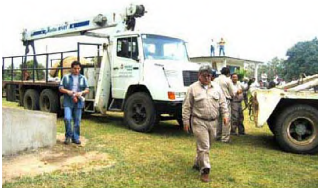
Figura 8. Llegada del monumento al museo de la comunidad en Tenochtitlán.