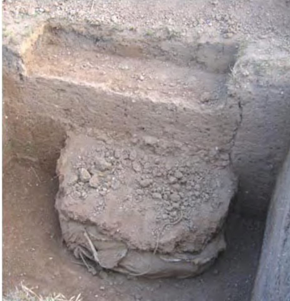
Figura 4. Cuando el monumento fue puesto al descubierto, se dejó sobre el mismo una gruesa capa de tierra como protección.

En abril del 2004, el relleno de las excavaciones de 1996 fue retirado a fin de evaluar los daños que pudiera haber sufrido el contexto arqueológico ( Figura 4 , arriba, y Figura 5 , abajo). Se pudo determinar que los estratos ubicados por encima y al norte del monumento quedaron dañados como consecuencia de las actividades ilícitas, y que el monumento presentaba varias muescas hechas por las herramientas de metal que usaron los saqueadores para dejarlo al descubierto. Por fortuna, el contexto del monumento no sufrió perturbaciones.