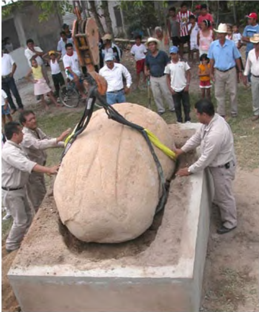
Figura 11. Colocación del Monumento 112 en su pedestal.

Como en tantos otros lugares, la región de San Lorenzo Tenochtitlán está sujeta a constantes saqueos y al tráfico de piezas arqueológicas. Durante un período de quince años, el PASLT ha intentado contrarrestar esta tendencia por medio de la creación de dos museos de la comunidad y de mantener un diálogo constante con los habitantes locales. Ya se puede percibir en la región una conciencia y una preocupación lentas, pero que van en aumento, por los sitios y sus artefactos. El apoyo reciente y entusiasta hacia el rescate del Monumento 112 por parte de los habitantes del lugar incluyó numerosas declaraciones públicas realizadas por miembros prominentes de la comunidad, referidas a la importancia de la herencia arqueológica del pueblo. Esta tendencia, largamente esperada, continuará, siempre y cuando se preste una atención apropiada a la educación y a los programas de cooperación diseñados para incrementar la participación de la comunidad, y para fomentar el compromiso de los lugareños hacia el patrimonio nacional.