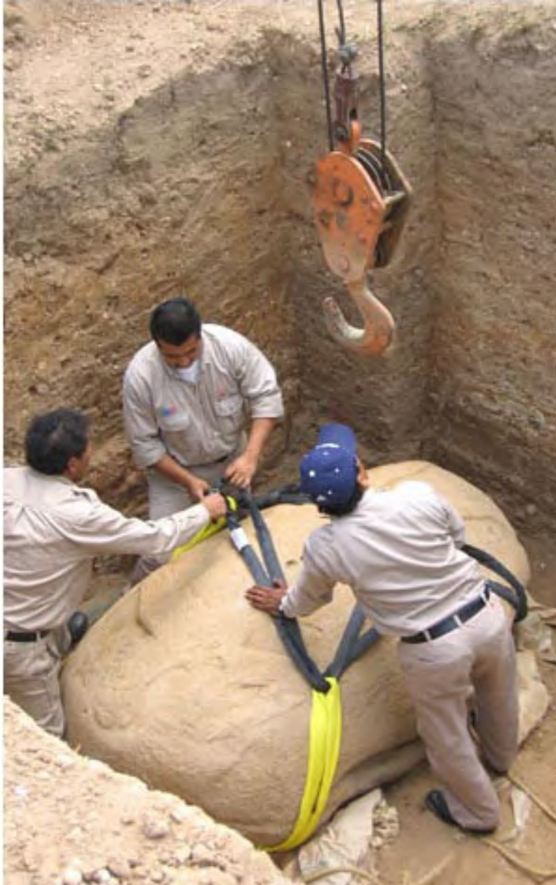
Figura 6. Personal de PEMEX preparando el monumento para su remoción.