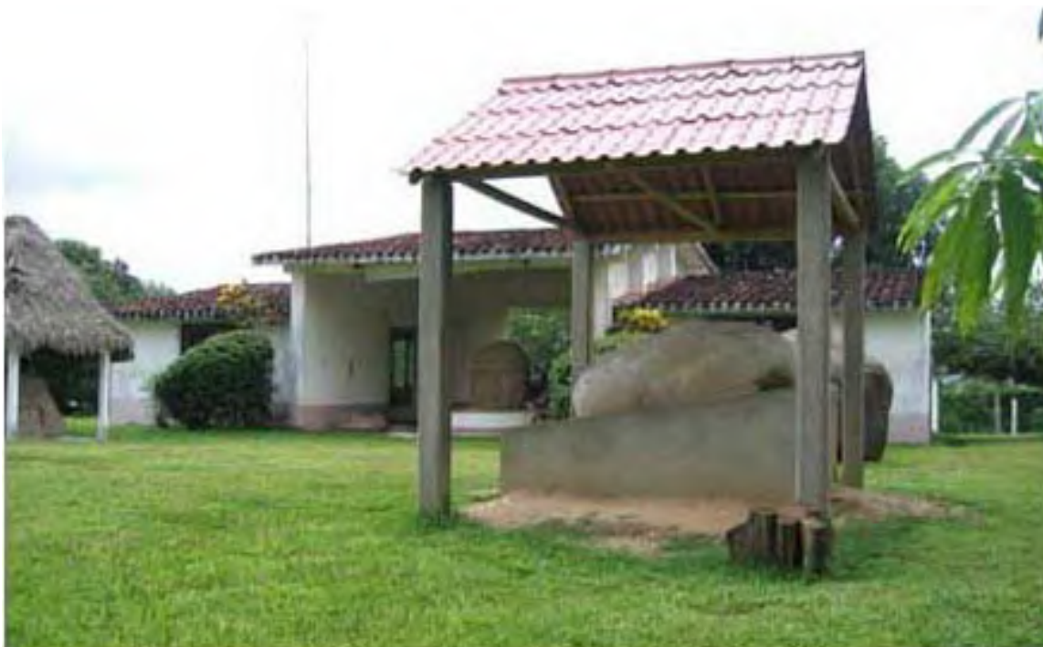
Figura 12. El Monumento 112, situado frente al museo de la comunidad en Tenochtitlán.