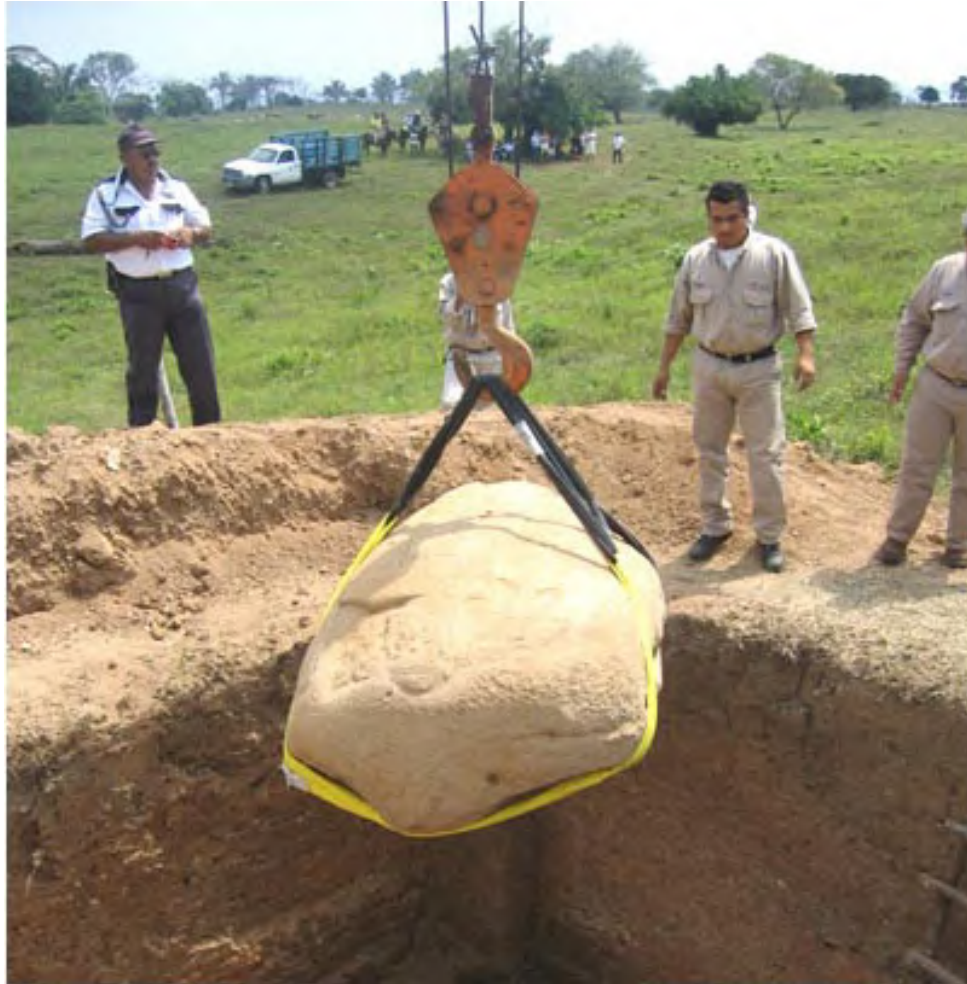
Figure 7. La cuidadosa extracción del monumento previo a ser colocado en el vehículo que habría de transportarlo.