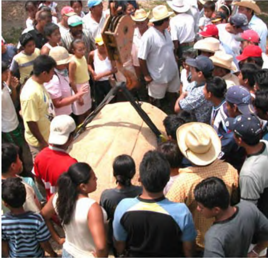
Figura 10. Previo a la colocación del monumento sobre su base, los habitantes locales de Tenochtitlán se reunieron en torno al mismo a fin de tratar sobre su importancia y significado.