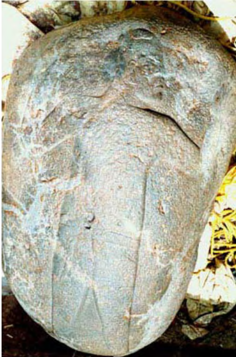
Figura 2. El Monumento 112, tal y como fuera descubierto por el Proyecto Arqueológico San Lorenzo Tenochtitlán (PASLT), en 1996.