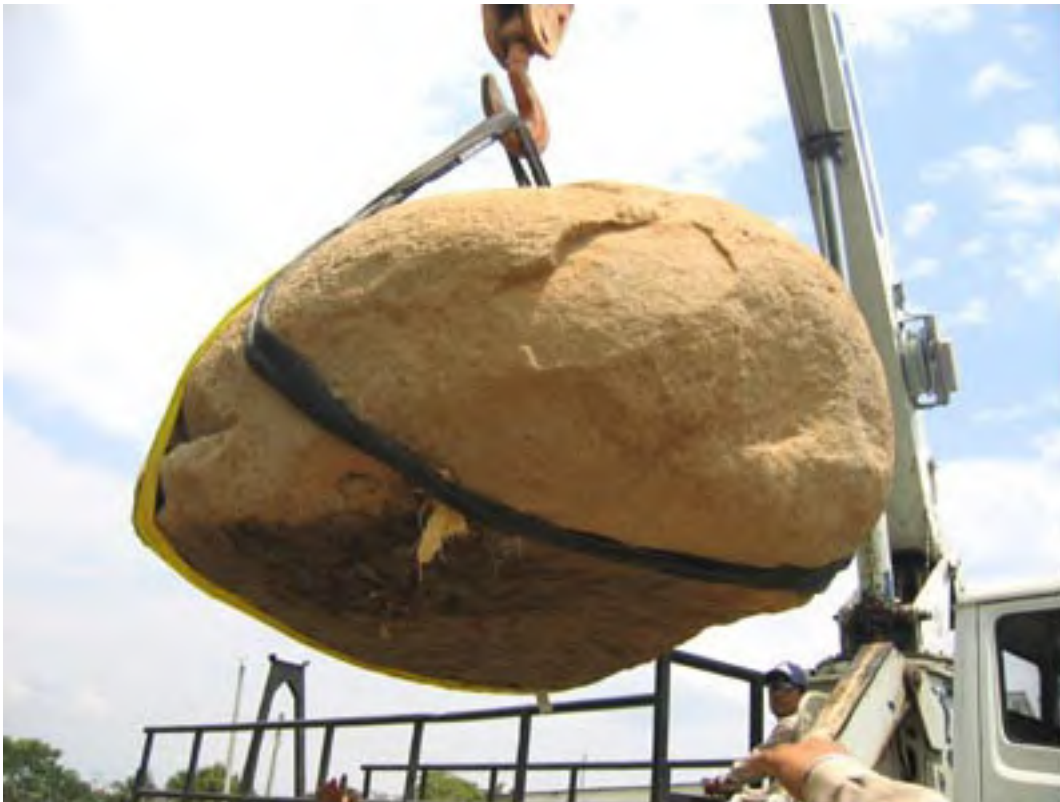
Figura 9. El monumento al ser retirado del vehículo.

El domingo 18 de abril, las gentes del pueblo, los guardias locales del INAH, y los reporteros gráficos se reunieron en el sitio para presenciar la impecable remoción, transporte, y emplazamiento del monumento, llevados a cabo por PEMEX, en el museo de la comunidad ( Figura 6 , Figura 7 , y Figura 8 , arriba, y Figura 9 , Figura 10 , y Figura 11 , abajo). Una vez puesto en su lugar, se construyó un techo para protegerlo de los elementos ( Figura 12 , abajo).