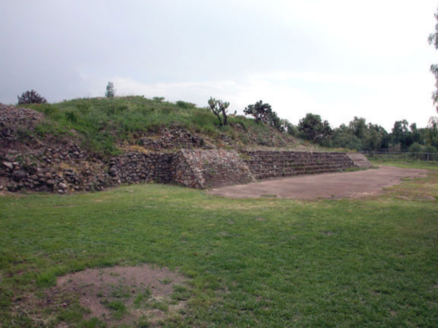
Figura 150. Edificio La Estancia en Huexotla.