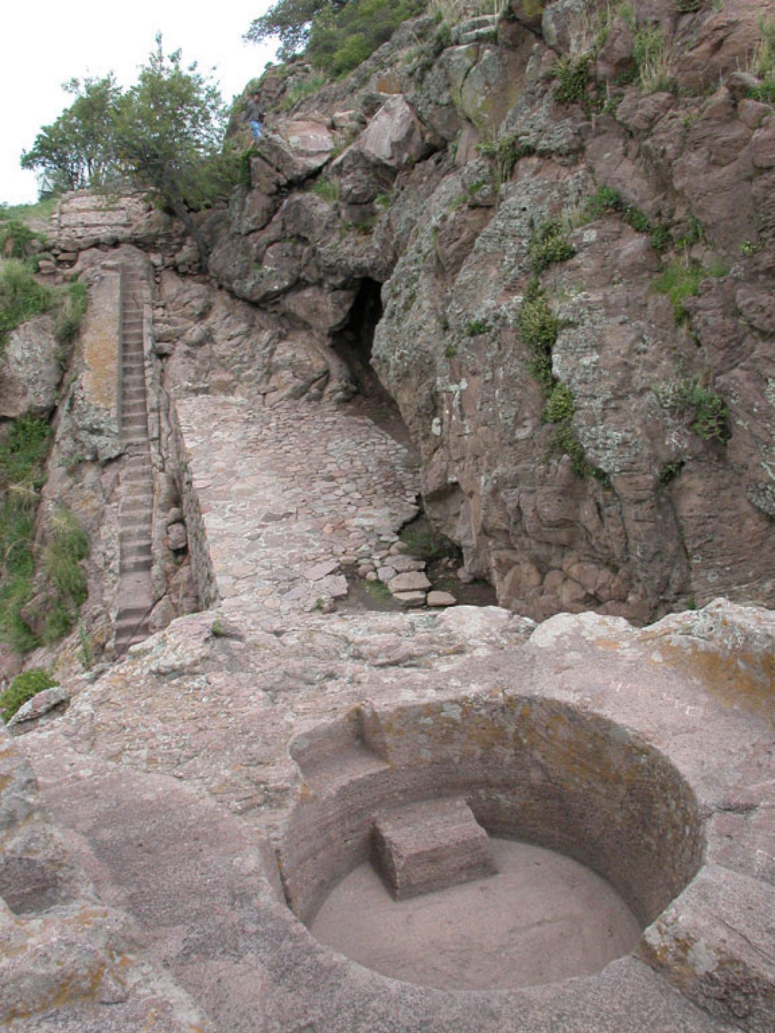
Figura 145. El Baño del Rey y la cueva.