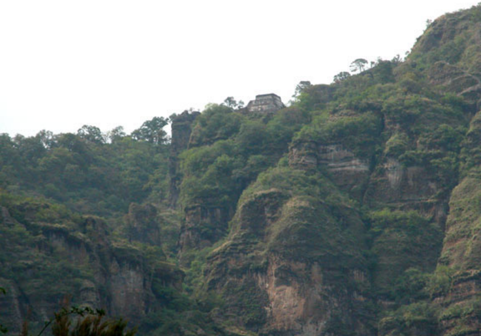
Figura 156. Templo-Pirámide de Tepoztlan en el Cerro del Tepozteco.