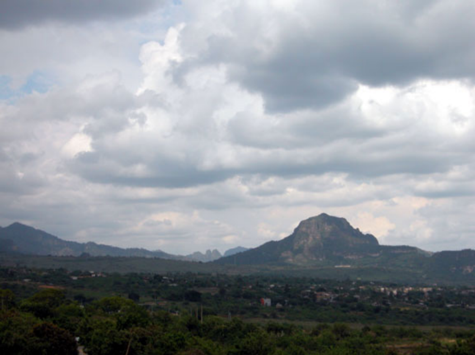
Figura 154. Sierra de Tepoztlán.