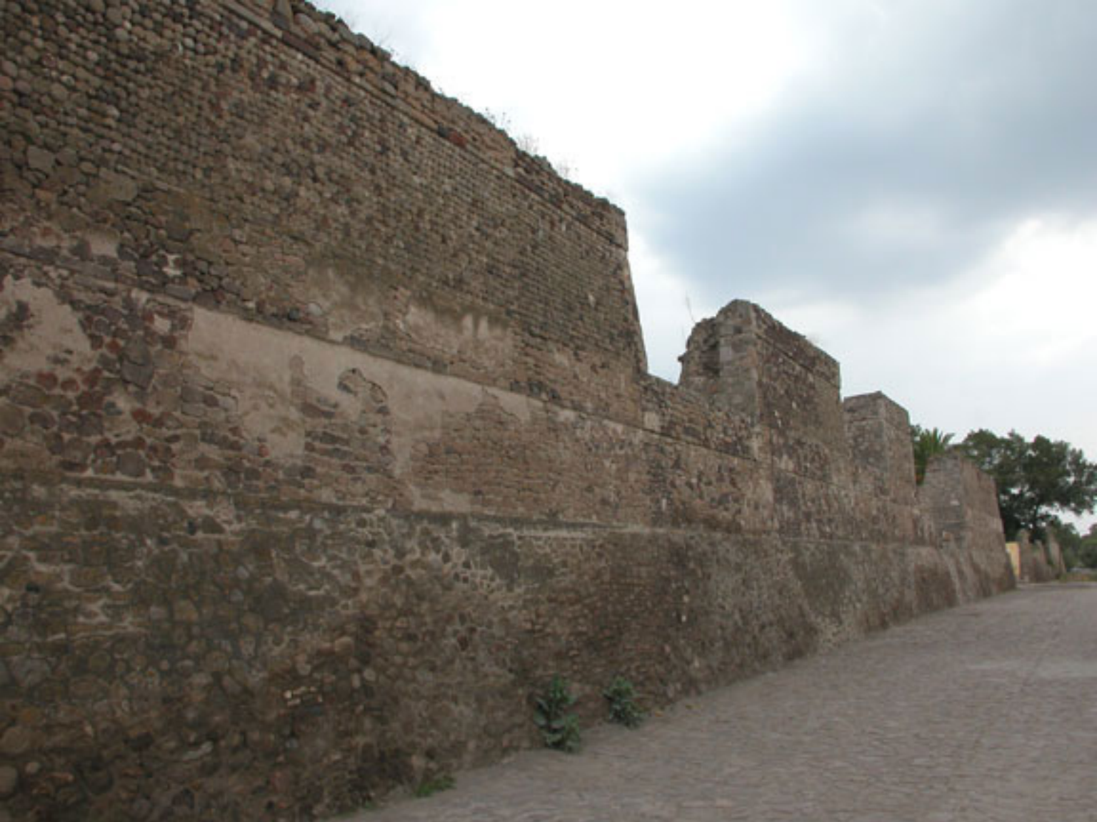
Figura 148. La muralla de Huexotla.