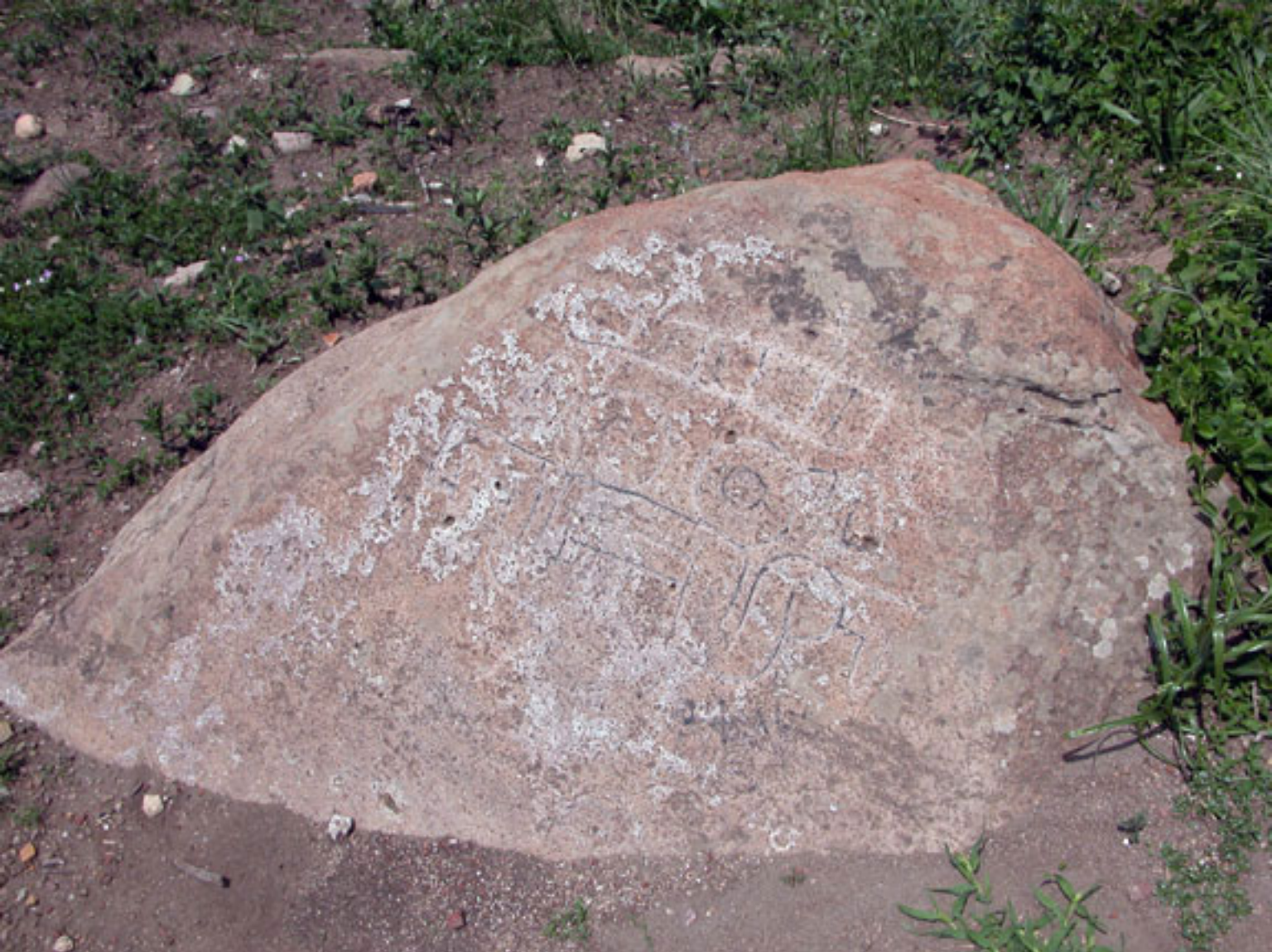
Figura 143. Mascarón de Tlaloc.