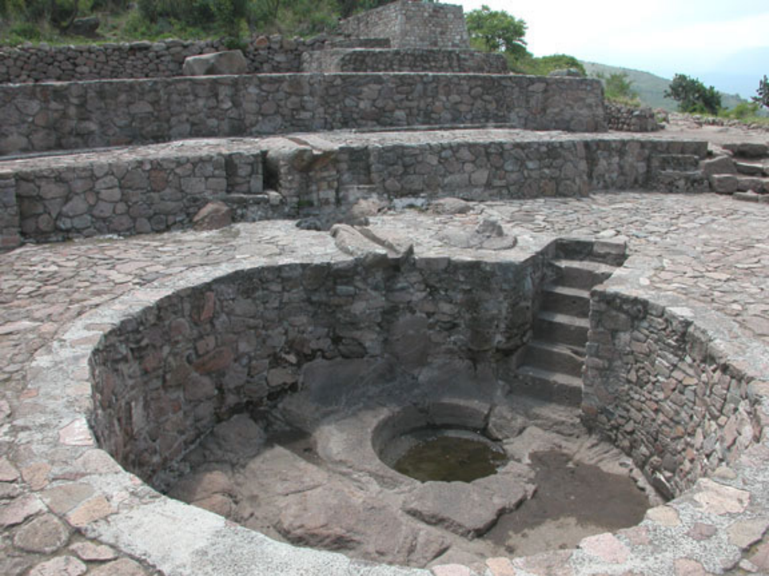
Figura 140. El Baño de la Reina.