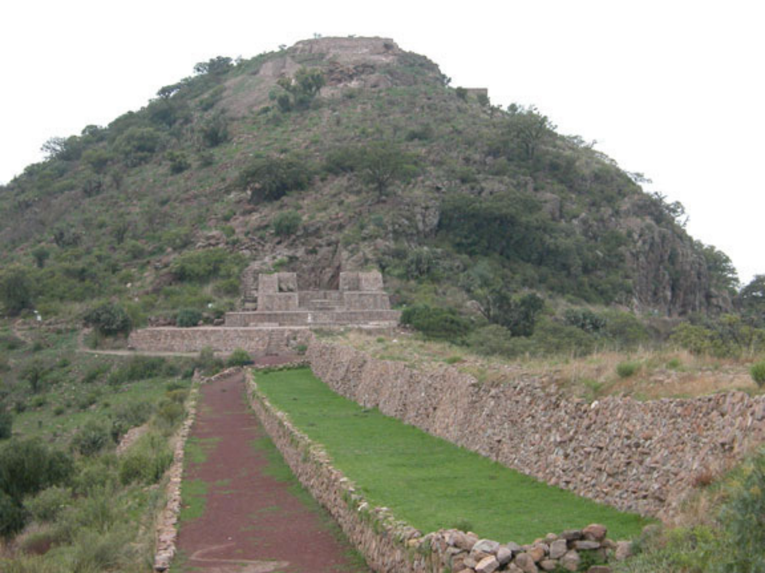
Figura 136. Acueducto y Cuarto Monolítico de Tetzcotzinco.