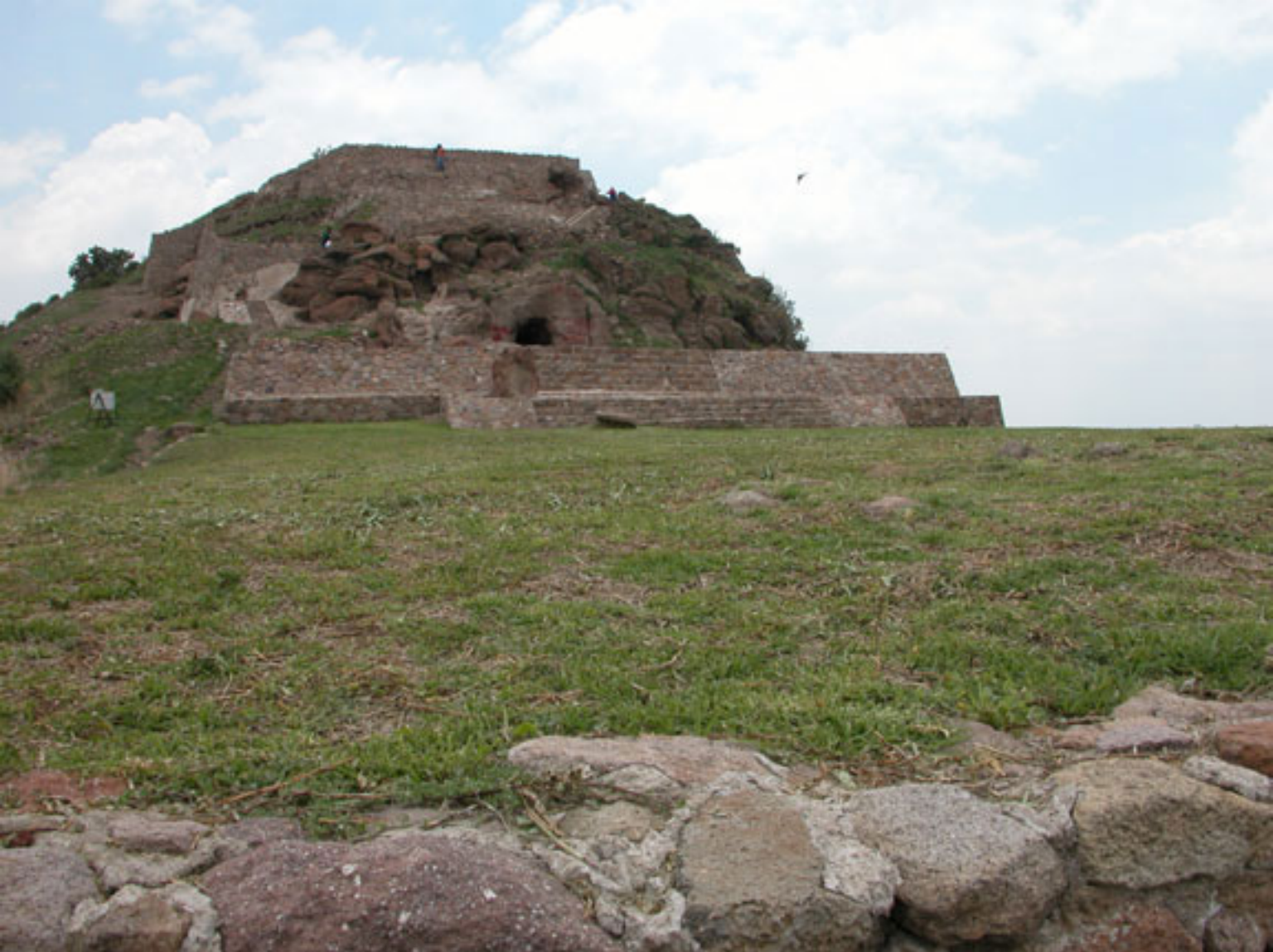
Figura 142. Templo-Cueva en la plaza de reuniones en la cima del Cerro Tetcotzinco.