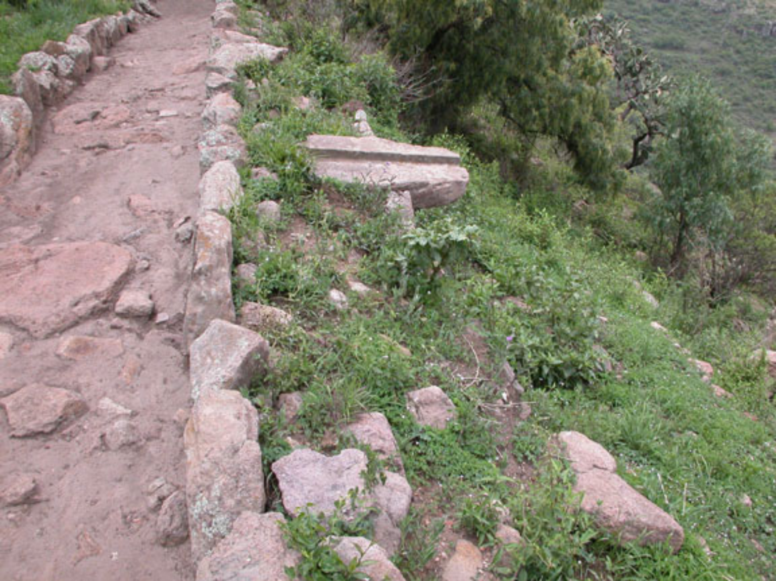
Figura 138. Sendero de circunvalación y subsistema de canales de irrigación.