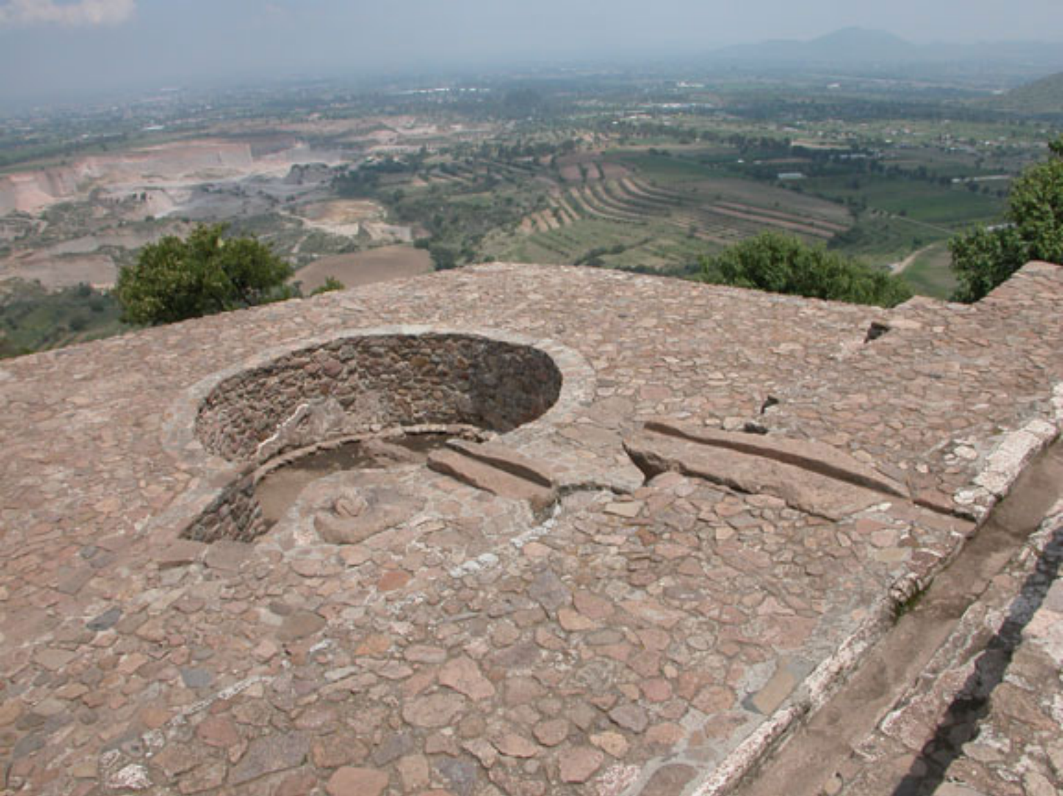
Figura 141. El Baño de la Reina con vista panorámica de la ciudad de Tetzaco.