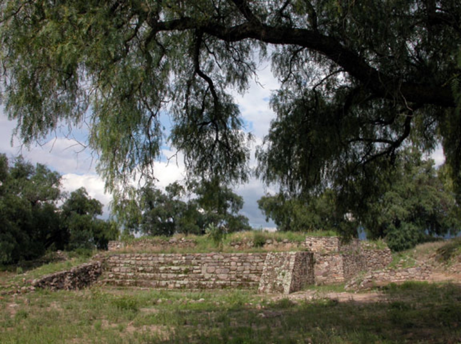
Figura 151. Grupo Santa María en Huexotla.