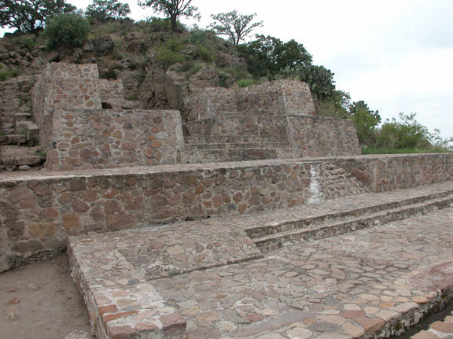
Figura 137. Cuarto Monolítico.