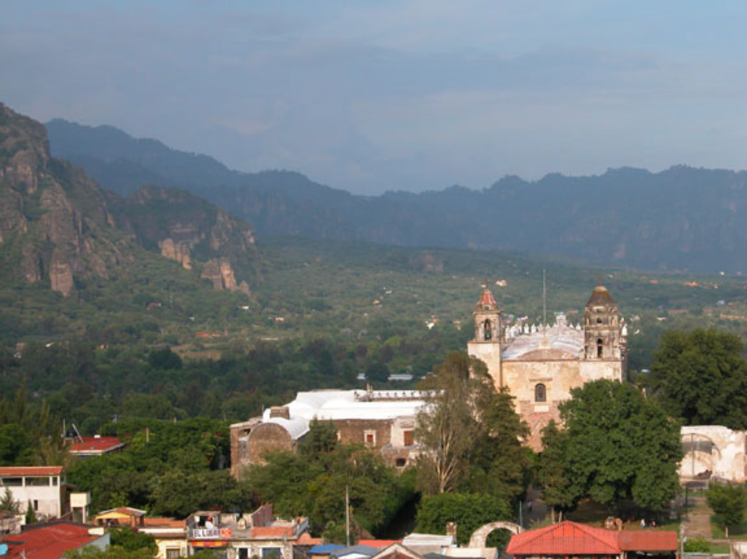
Figura 155. Tepoztlán y los Cerros del Tepozteco.