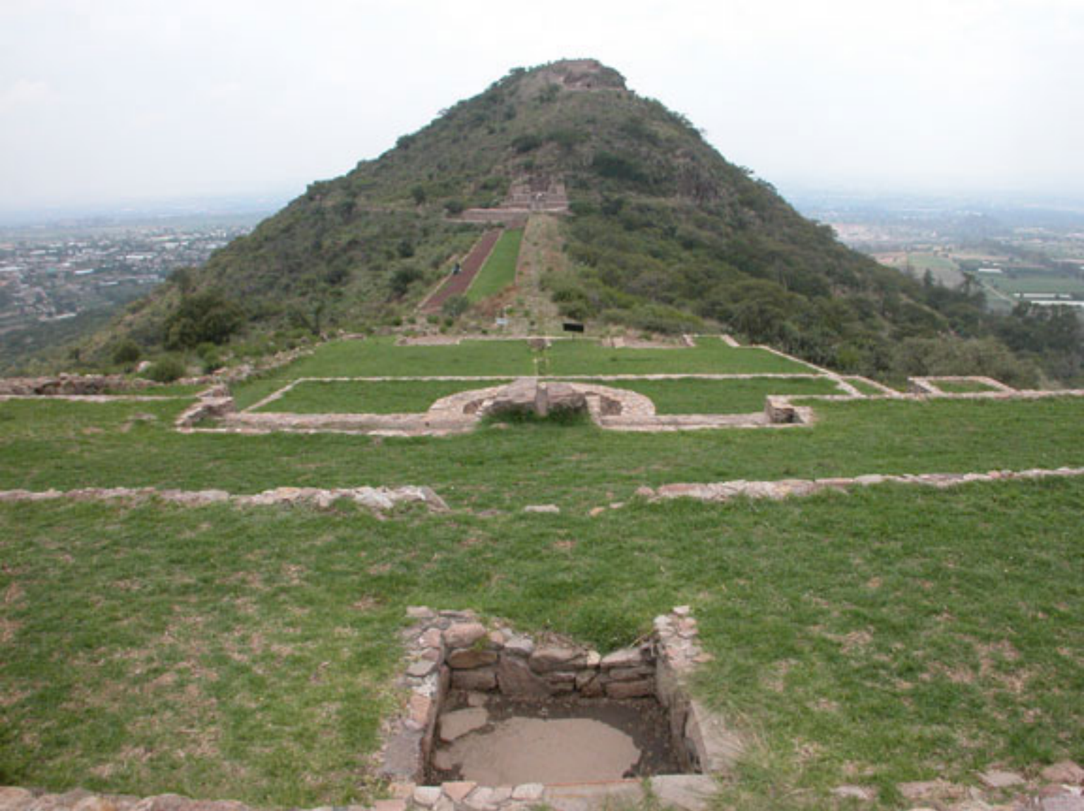
Figura 132b. Tetzcotzinco.