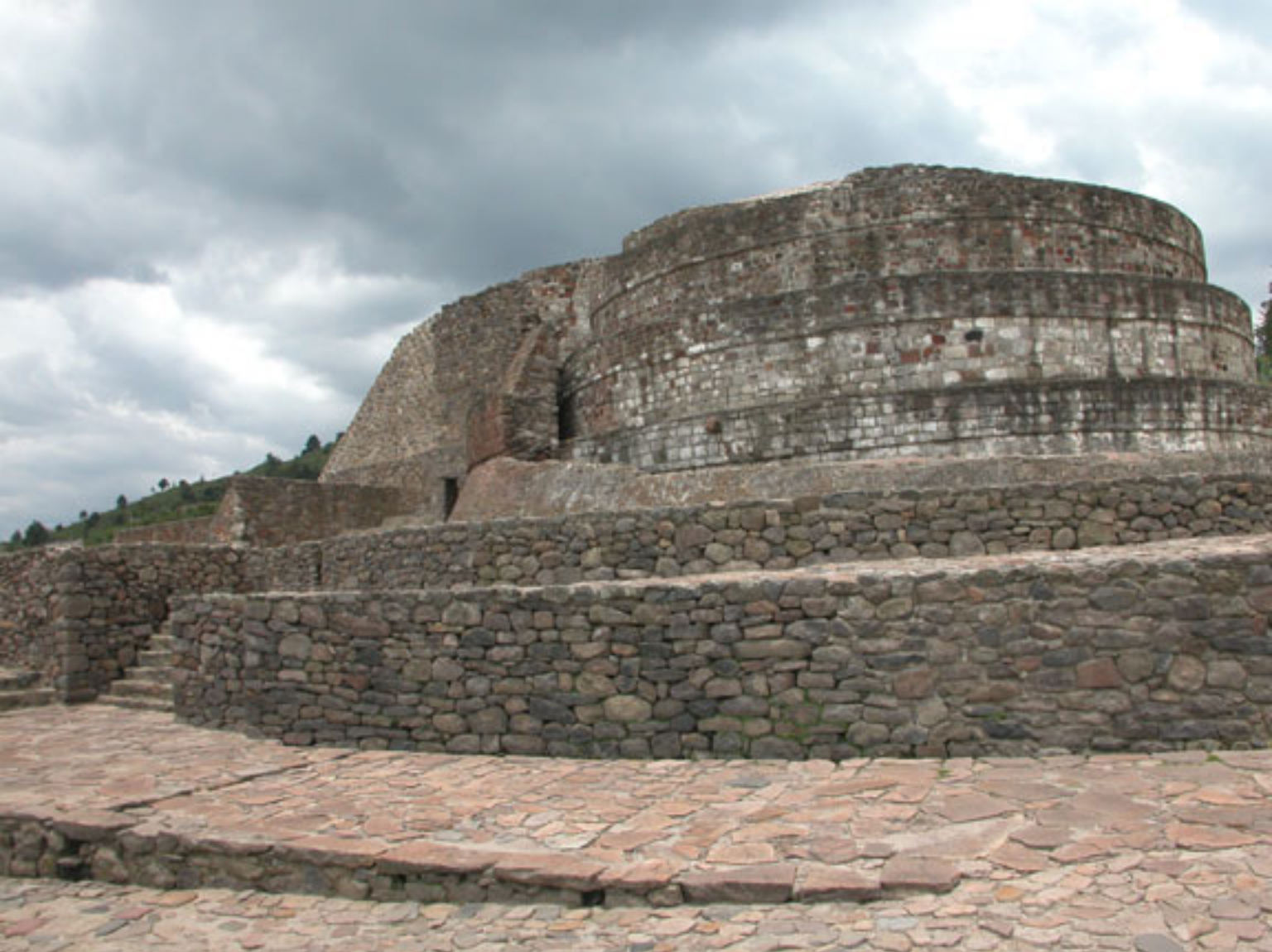
Figura 160. Templo de Ehecatl-Quetzalcoatl en Calixtlahuaca.