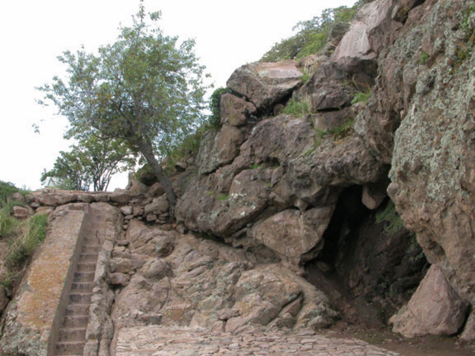
Figura 146. La cueva.