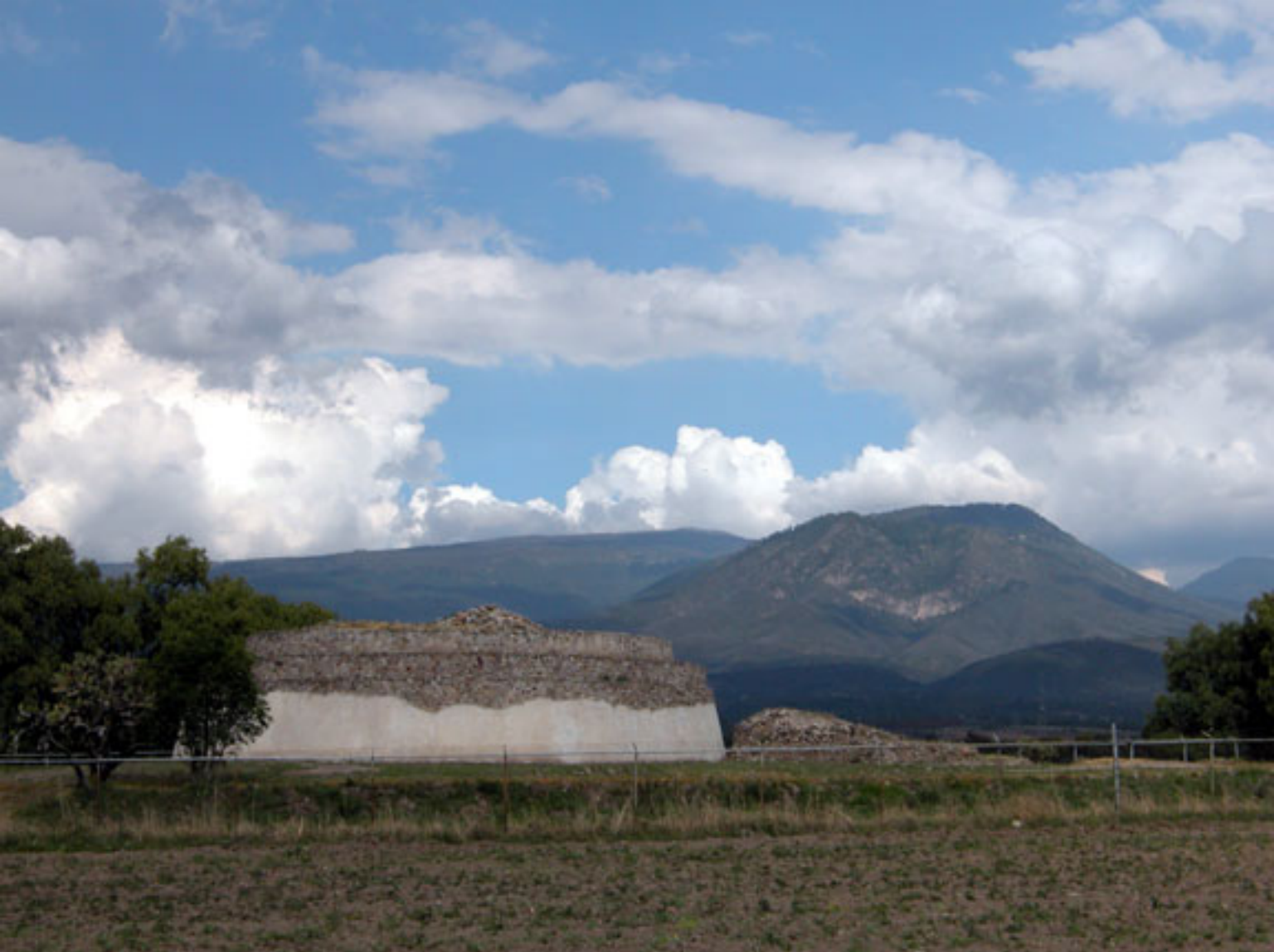
Figura 152. Templo de Ehecatl-Quetzalcoatl y el Monte Tlaloc