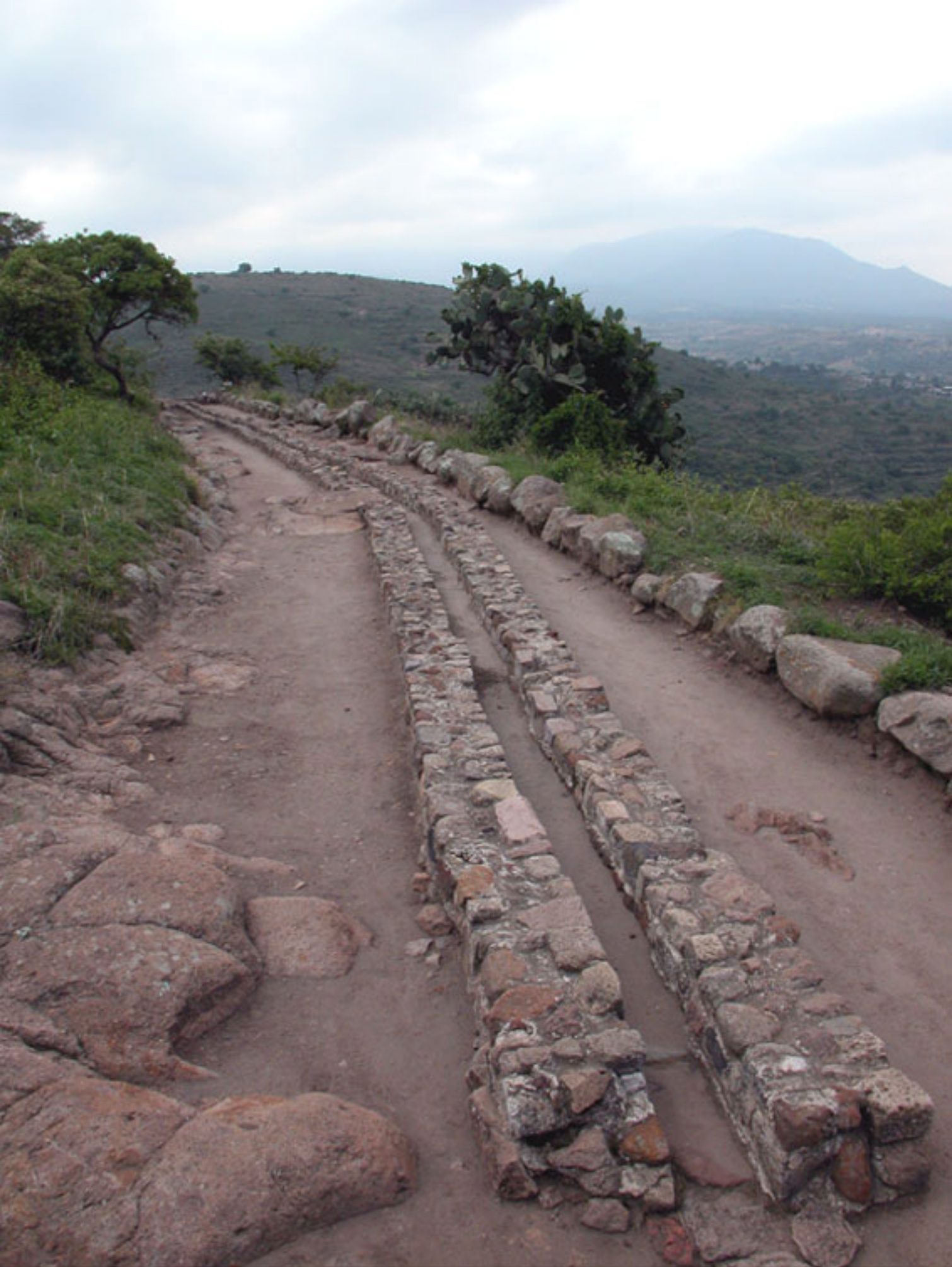
Figura 134b. Acueducto y sendero de circunvalación en Tetzcotzinco (foto de Fernando González y González.