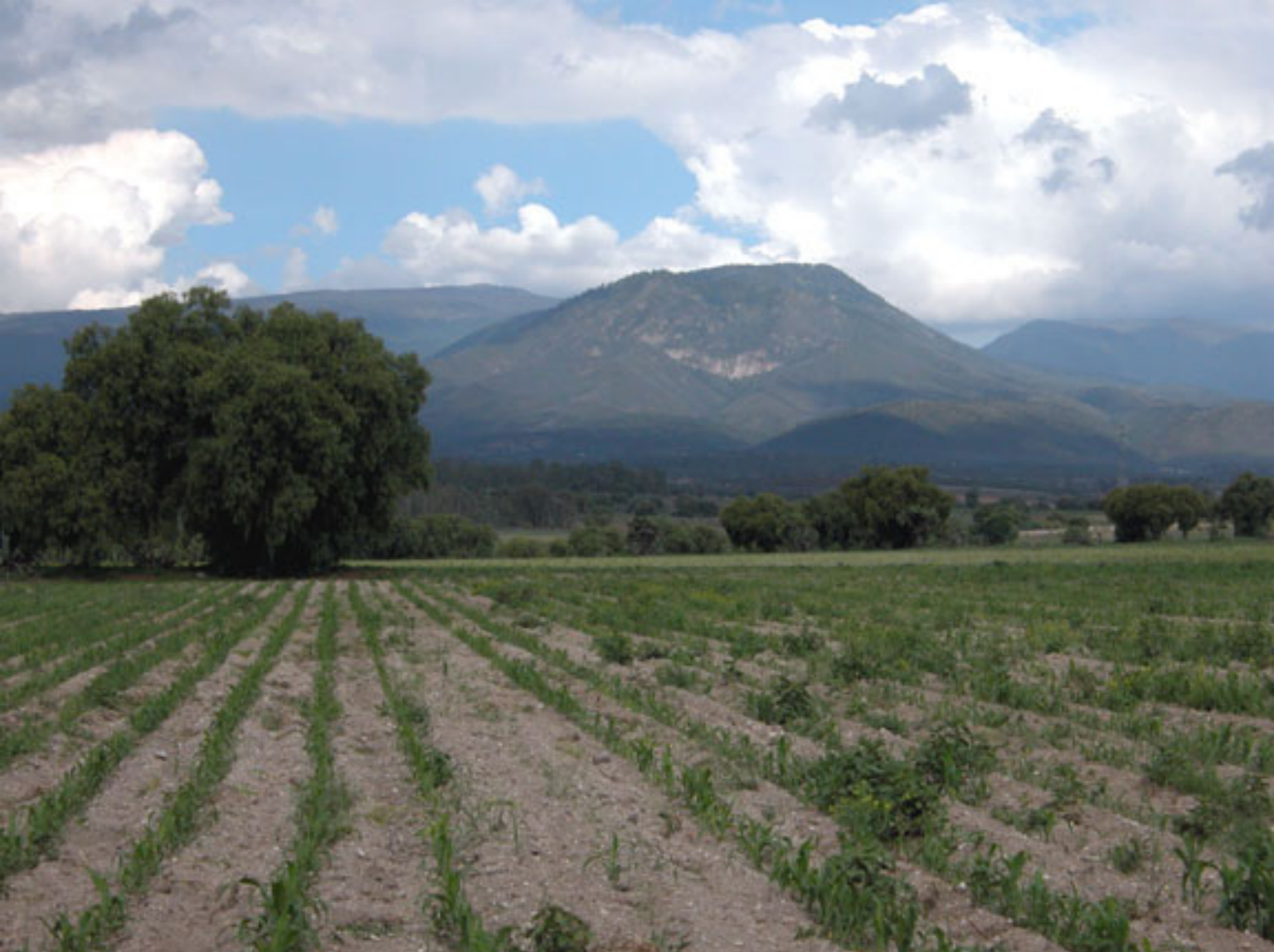
Figura 132a. El Monte Tlaloc.