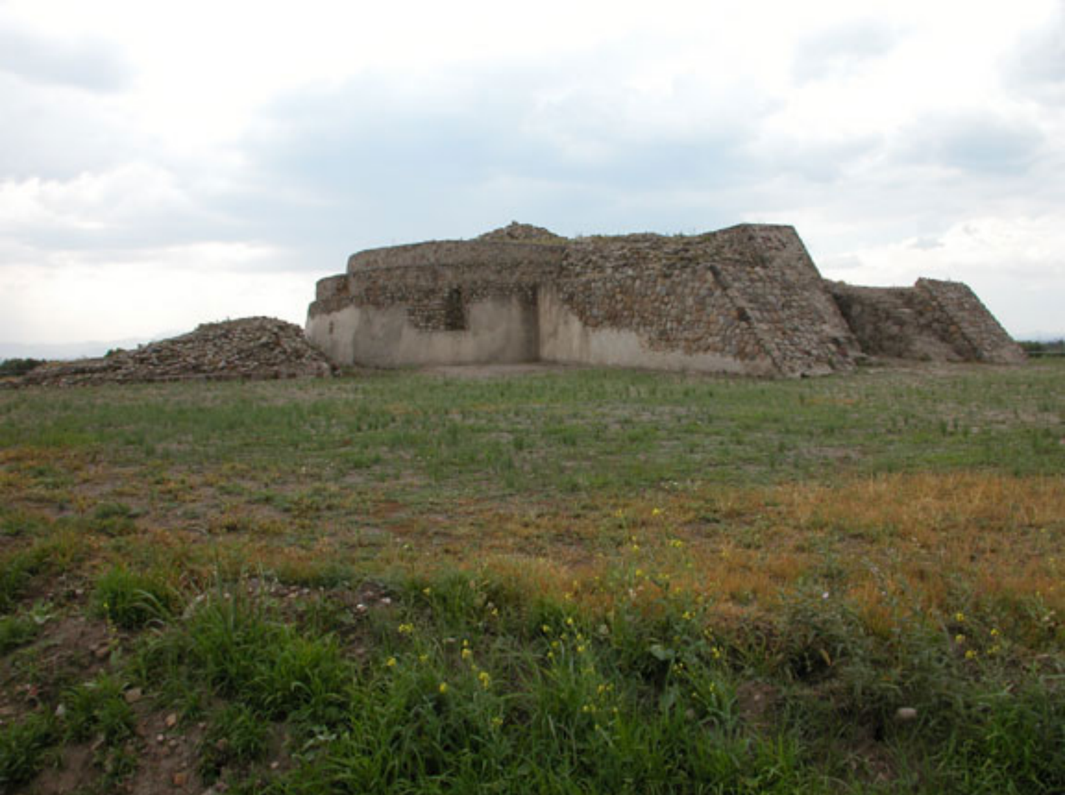
Figura 153. Templo de Ehecatl-Quetzalcoatl en Huexotla (foto de Fernando González y González).