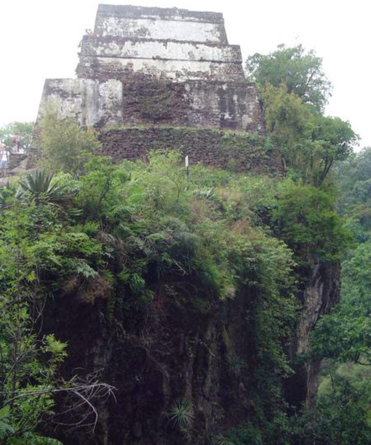
Figura 157. Templo-Pirámide de Tepoztlan.