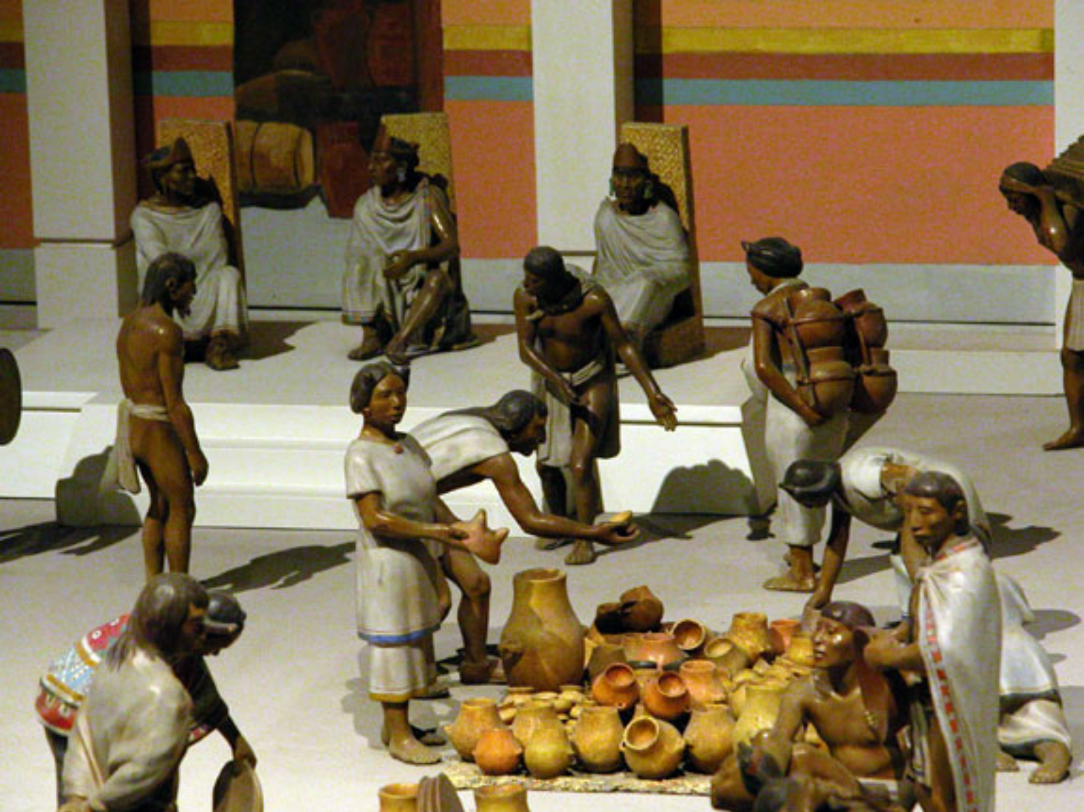
Figura 130. El mercado de Tlatelolco.