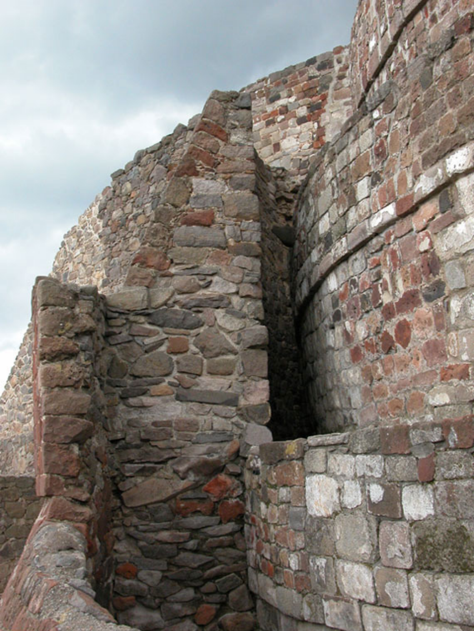
Figura 159. Superposiciones del Templo de Ehecatl-Quetzalcoatl en Calixtlahuaca.