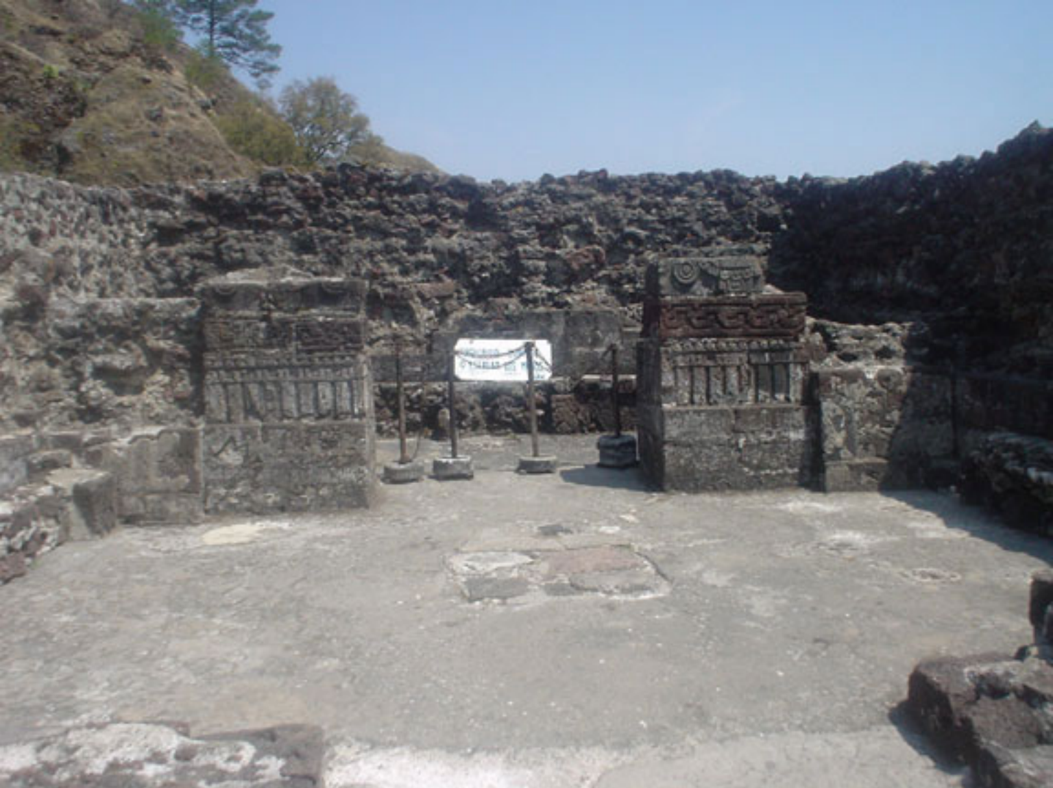
Figura 158. Interior del Templo-Pirámide de Tepoztlan.