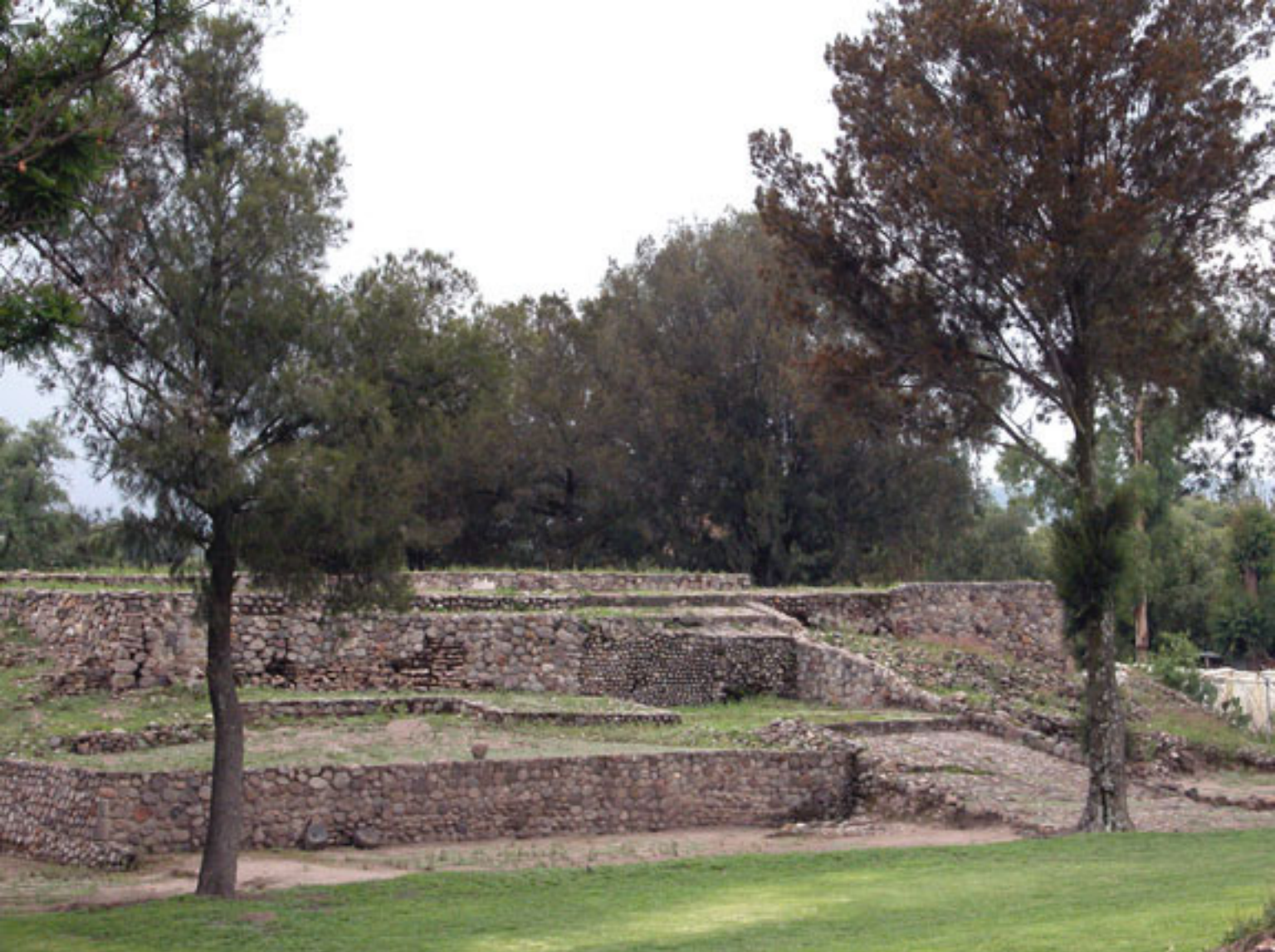
Figura 149. Edificio La Comunidad en Huexotla.