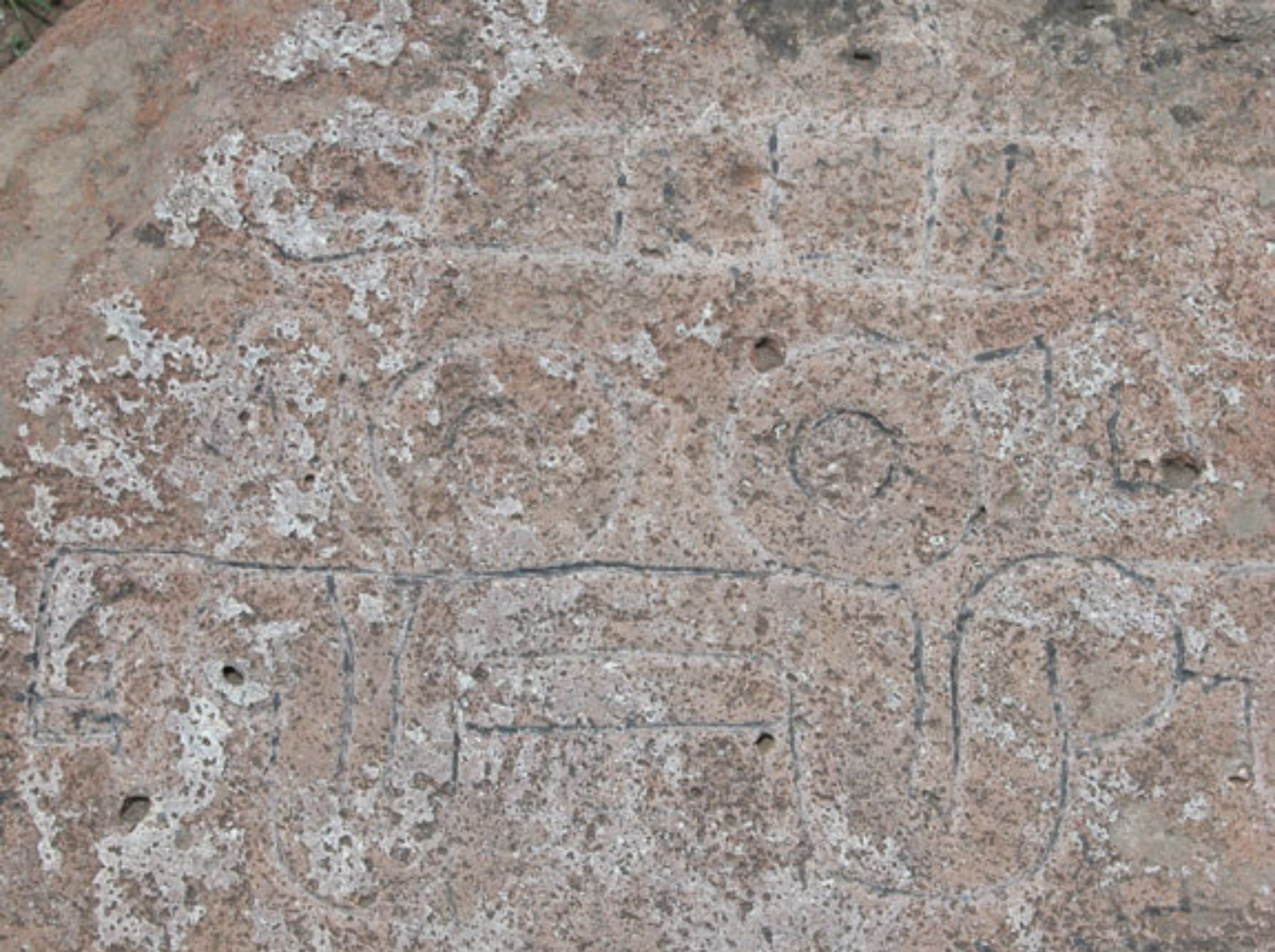
Figura 144. Mascarón de Tlaloc.