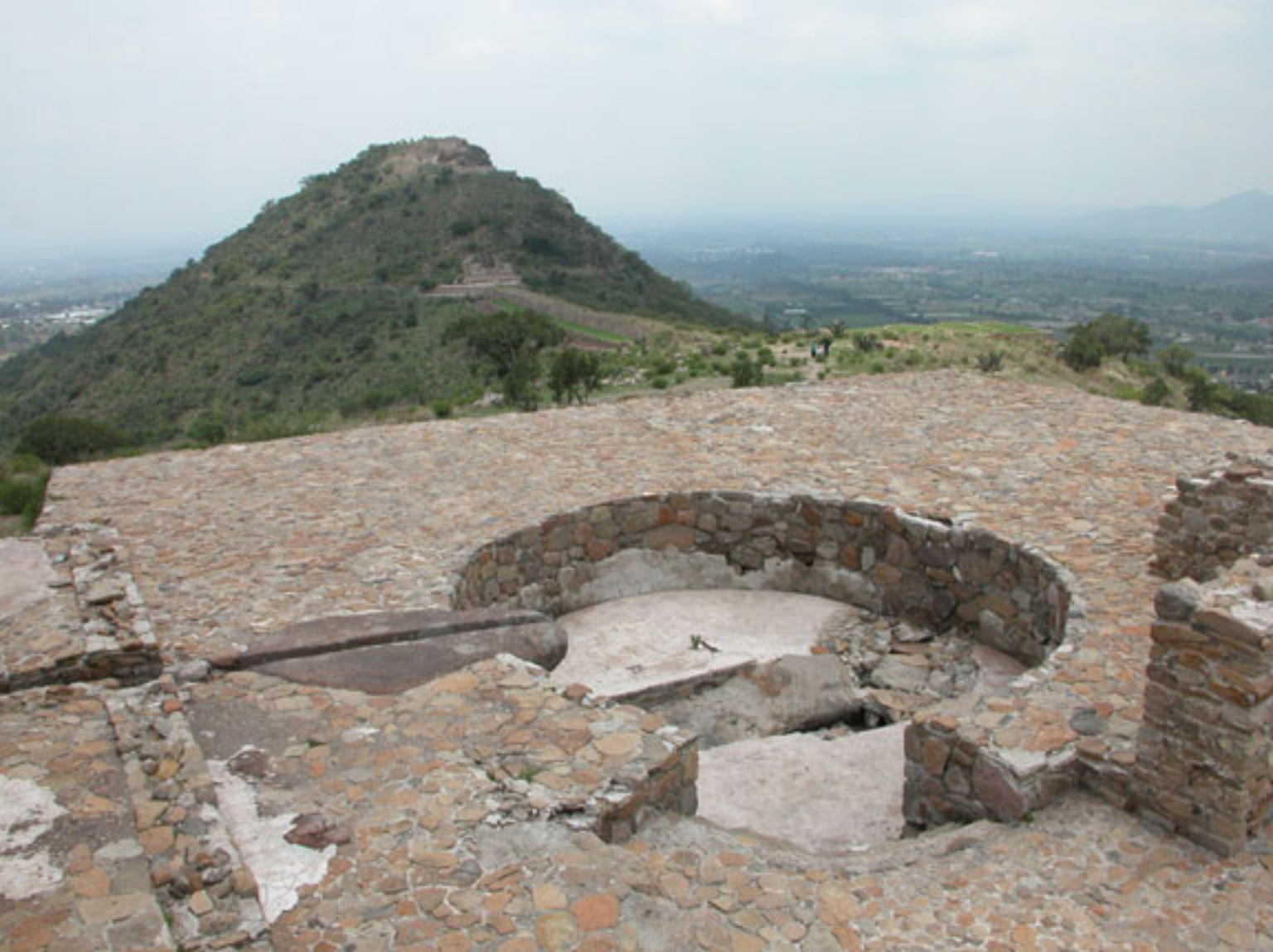
Figura 135. Sistema H de Reservoirio y Cerro del Tetzcotzinco.