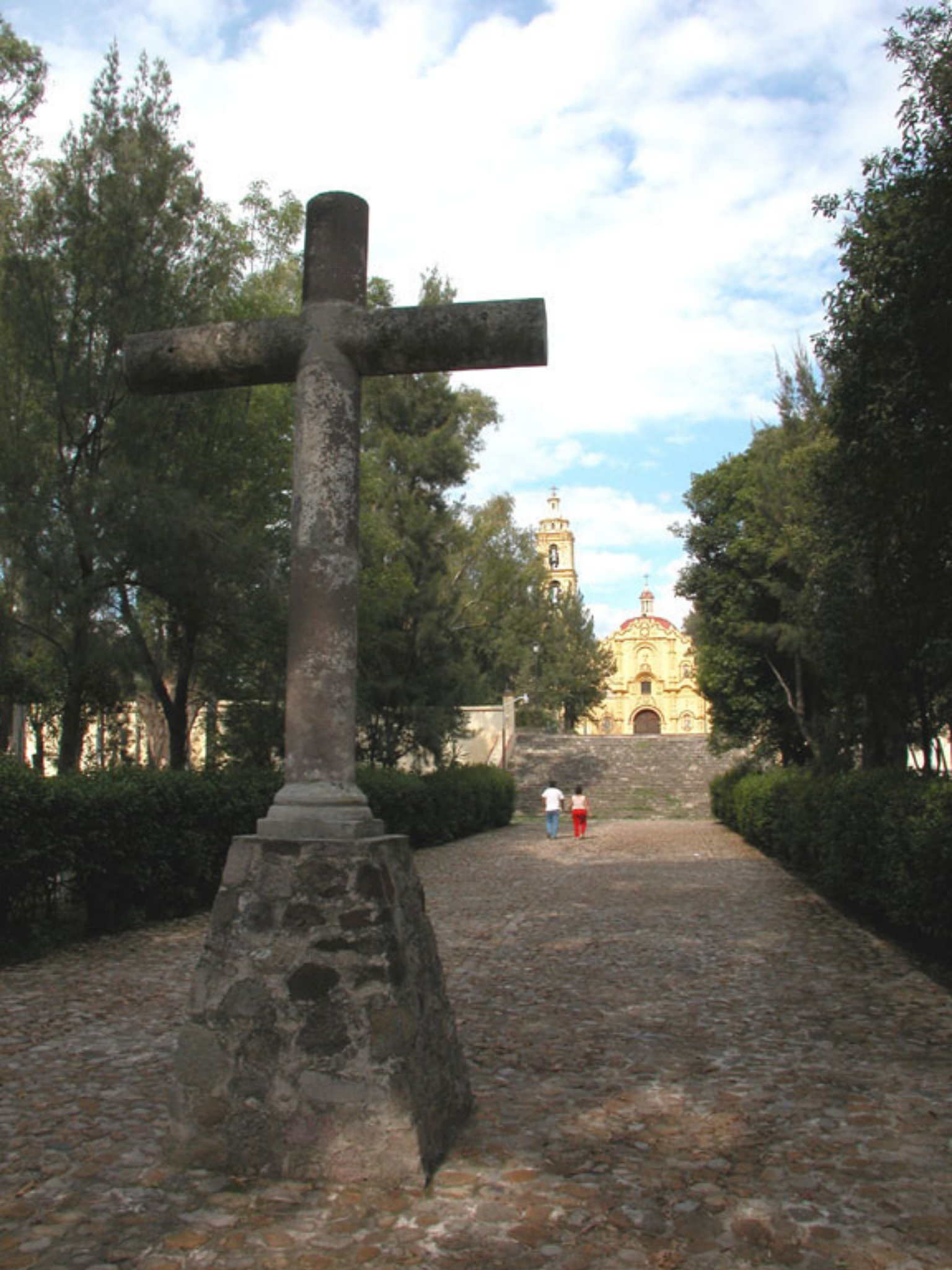
Figura 147. Atrio de Huexotla.