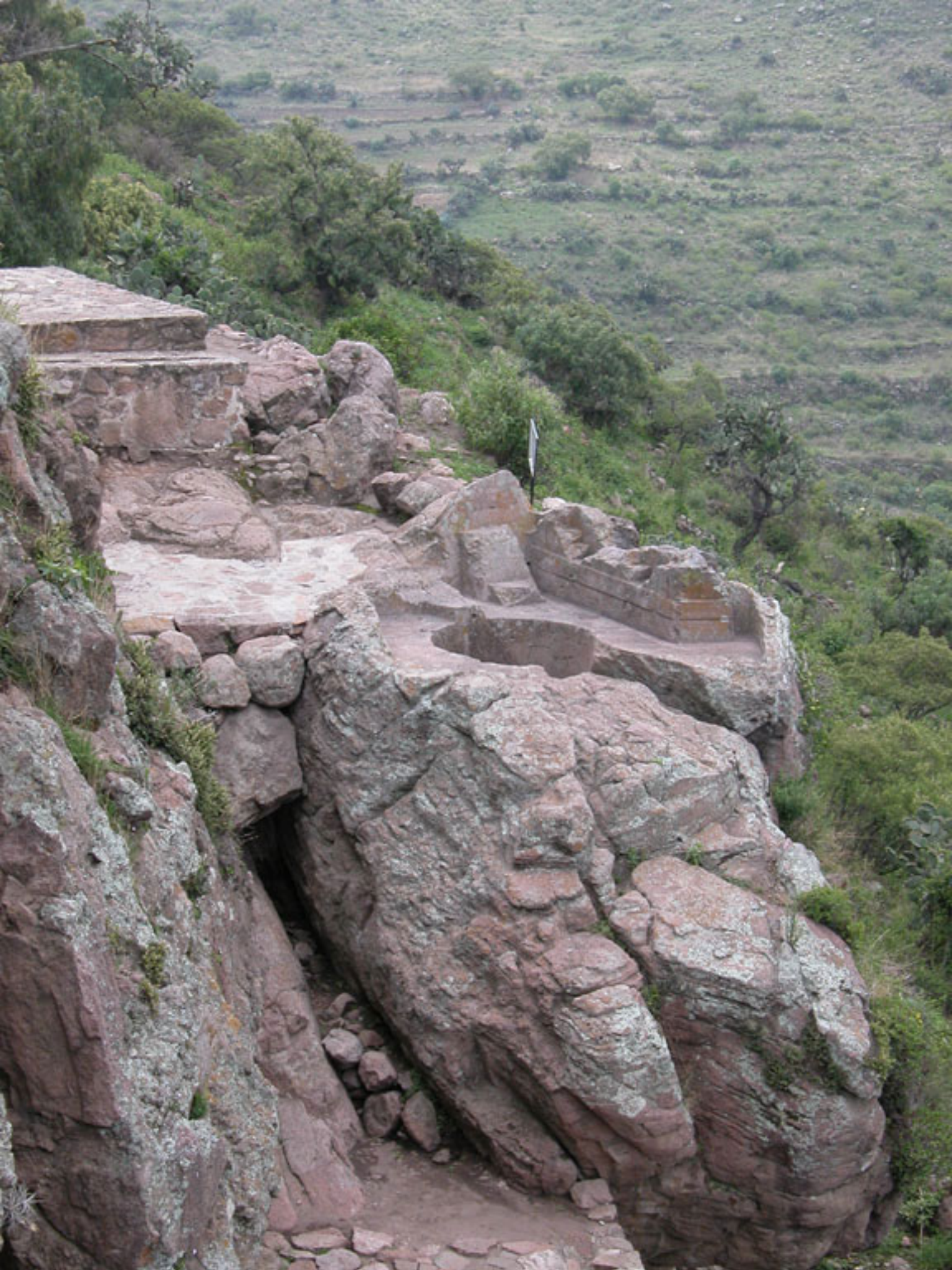
Figura 139. El Baño del Rey.