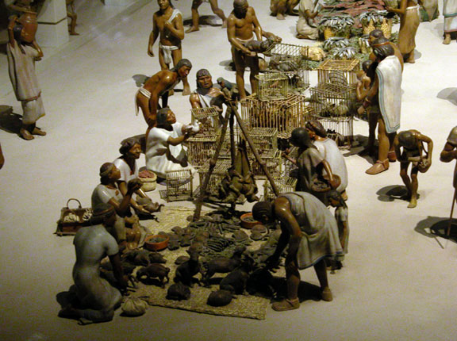
Figura 129. El mercado de Tlatelolco.