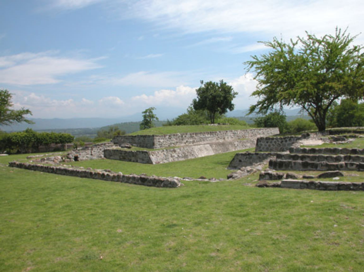
Figura 173. Cancha de juego de pelota de Coatetelco.