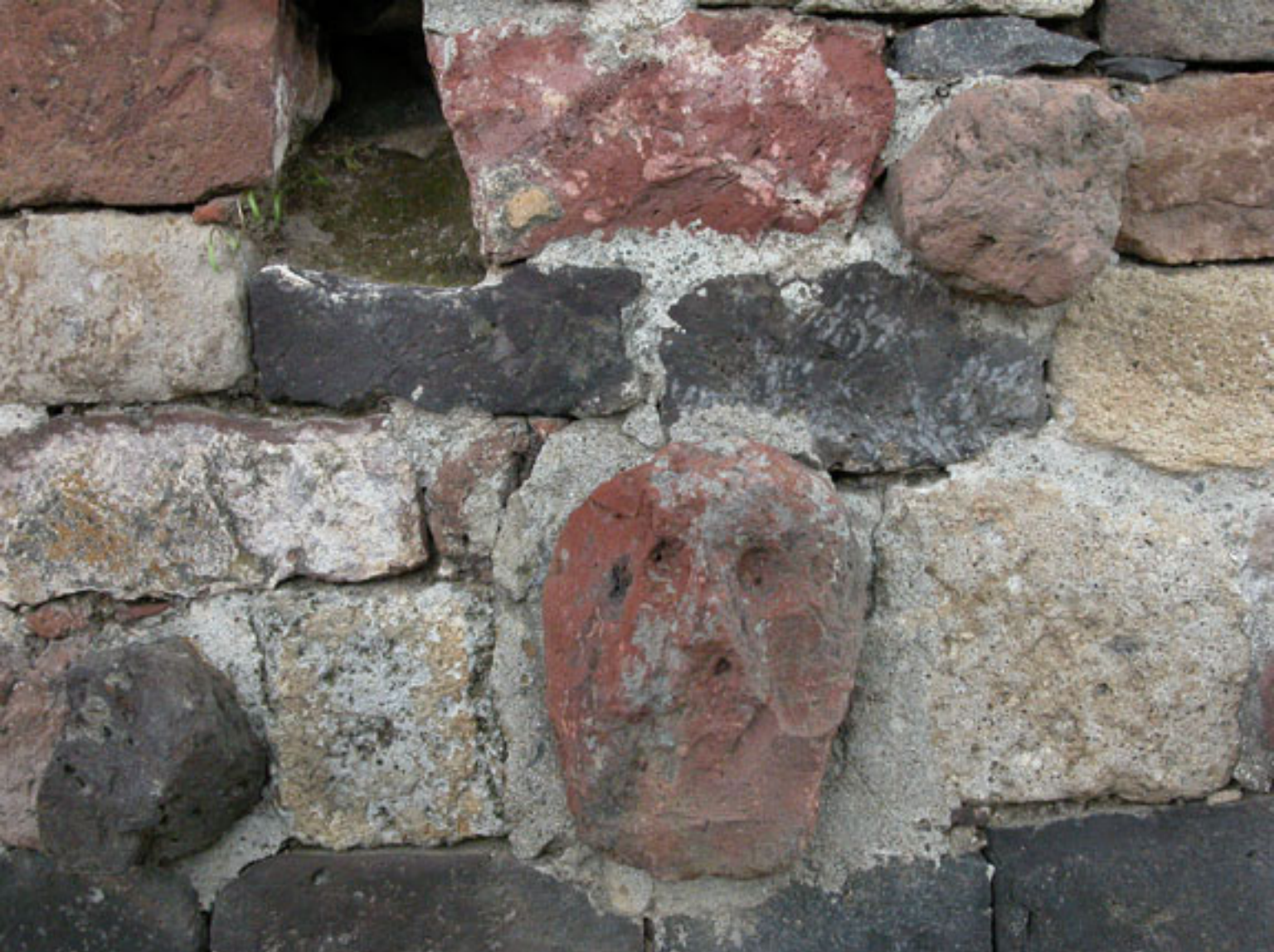
Figura 165. Detalle del Tzompantli en el Grupo de Tlaloc.