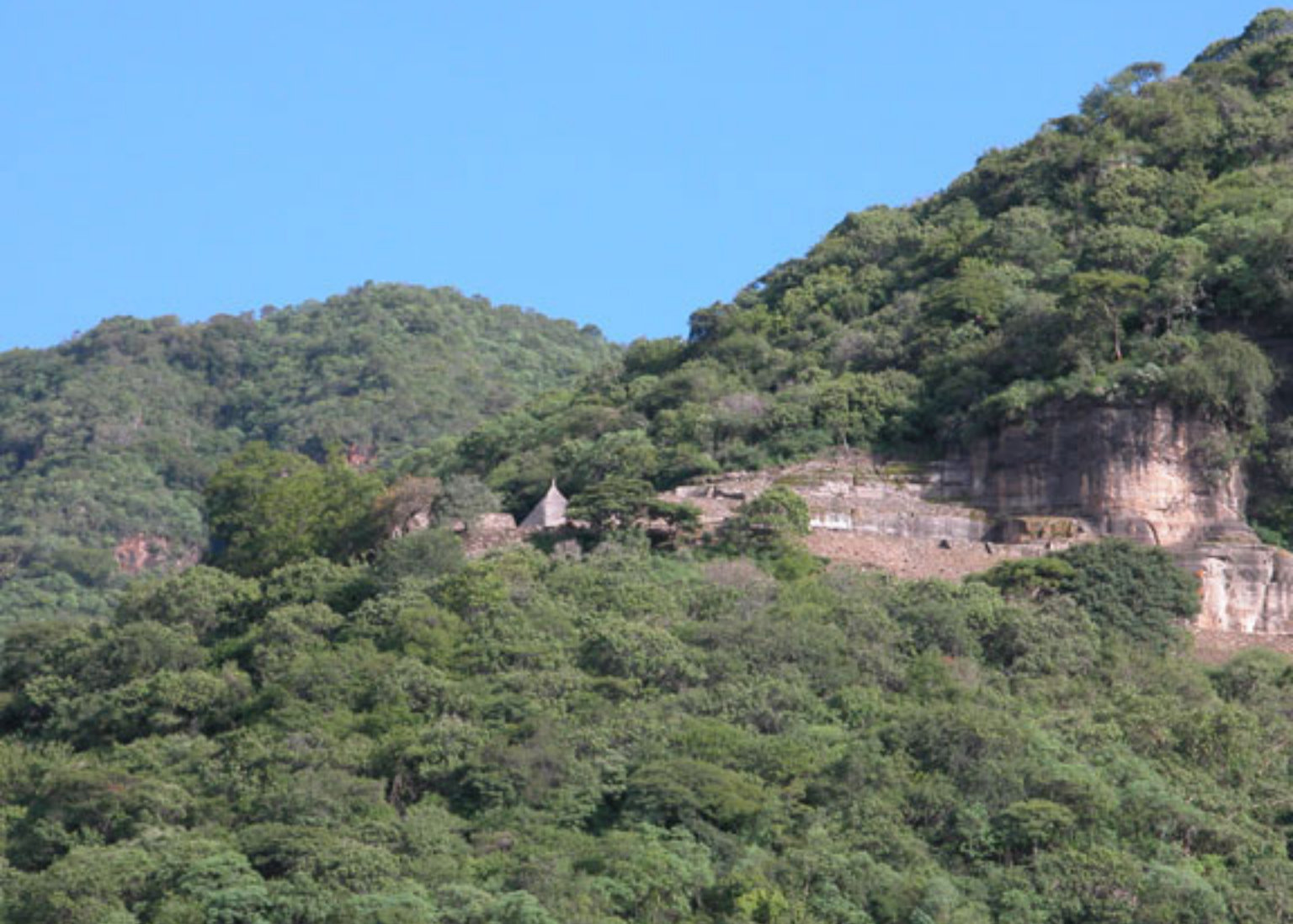
Figura 178a. Cerro de los Ídolos y el sitio de Malinalco.