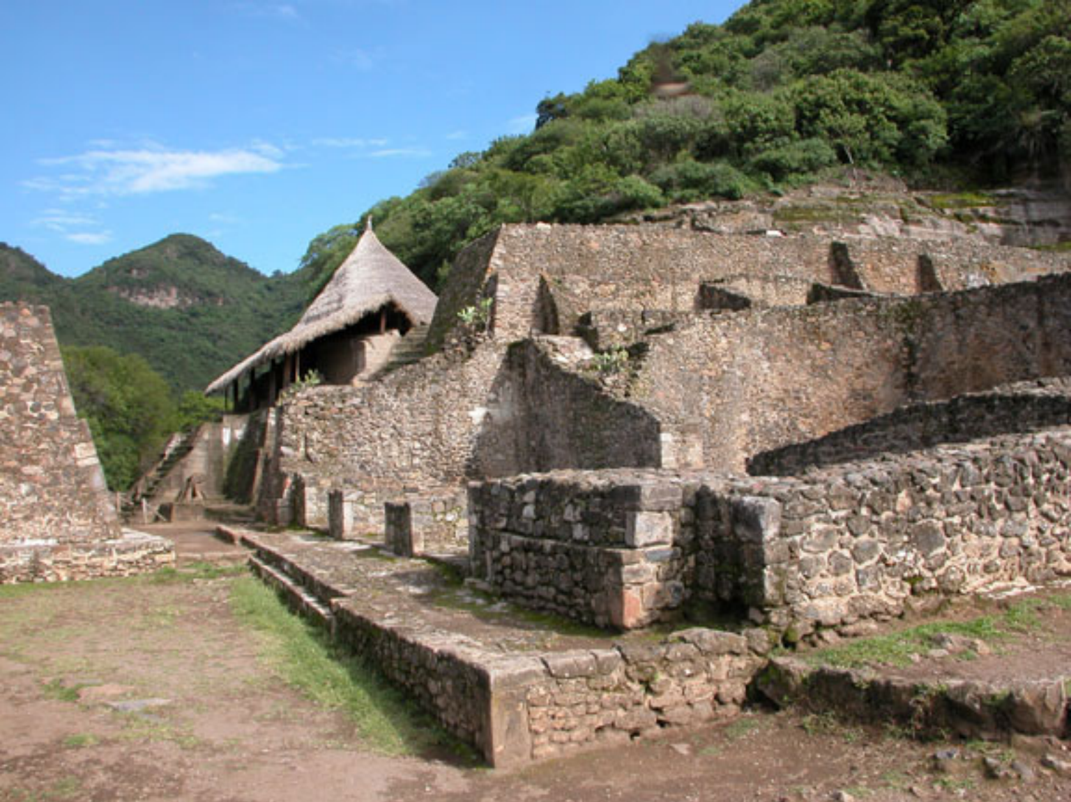
Figura 179a. Cuauhcalli (Templo I).