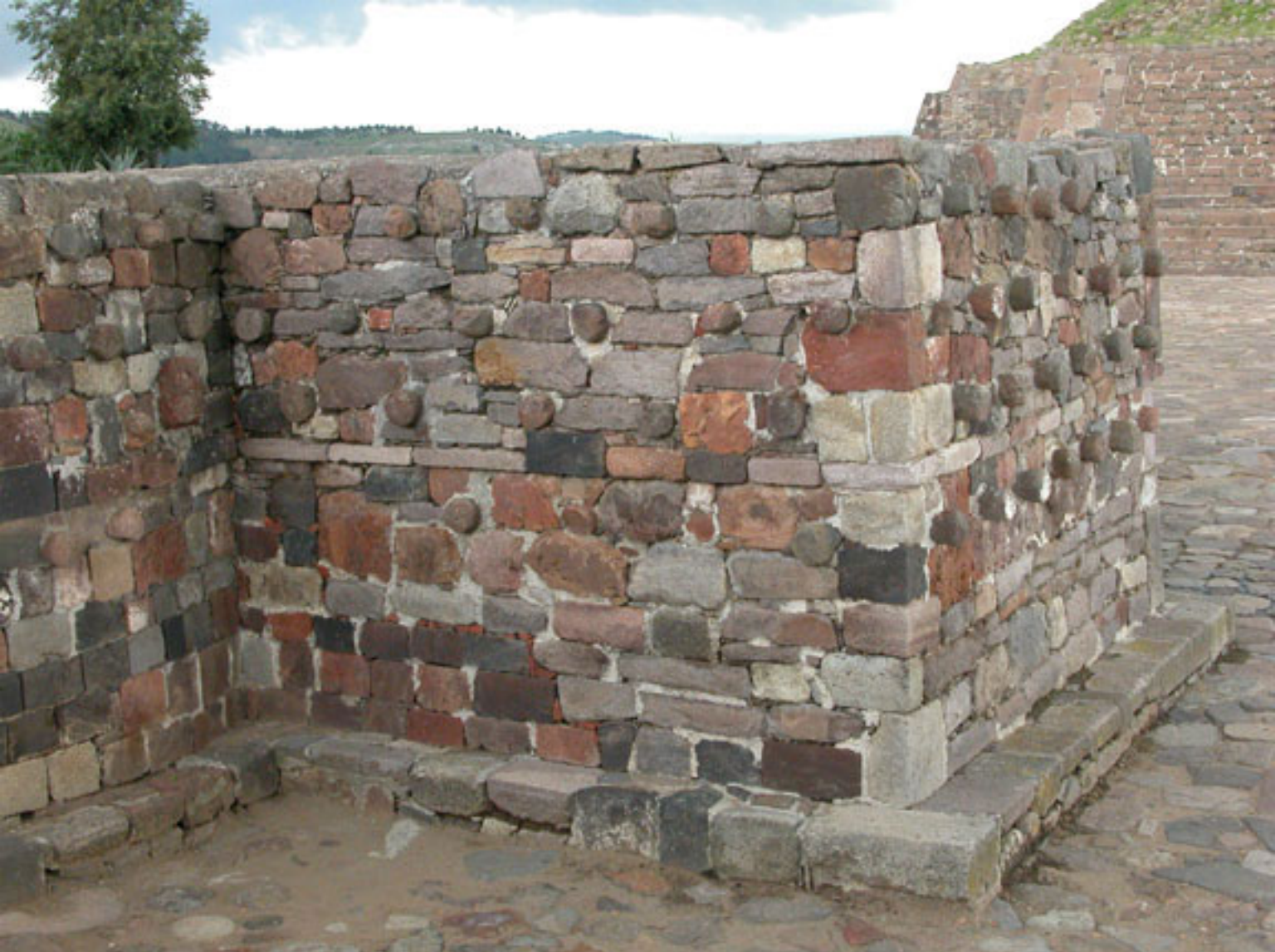
Figura 164. Tzompantli en el Grupo de Tlaloc.