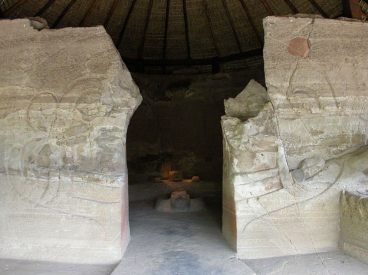
Figura 183. Mascarón de una serpiente a la entrada del Templo I.