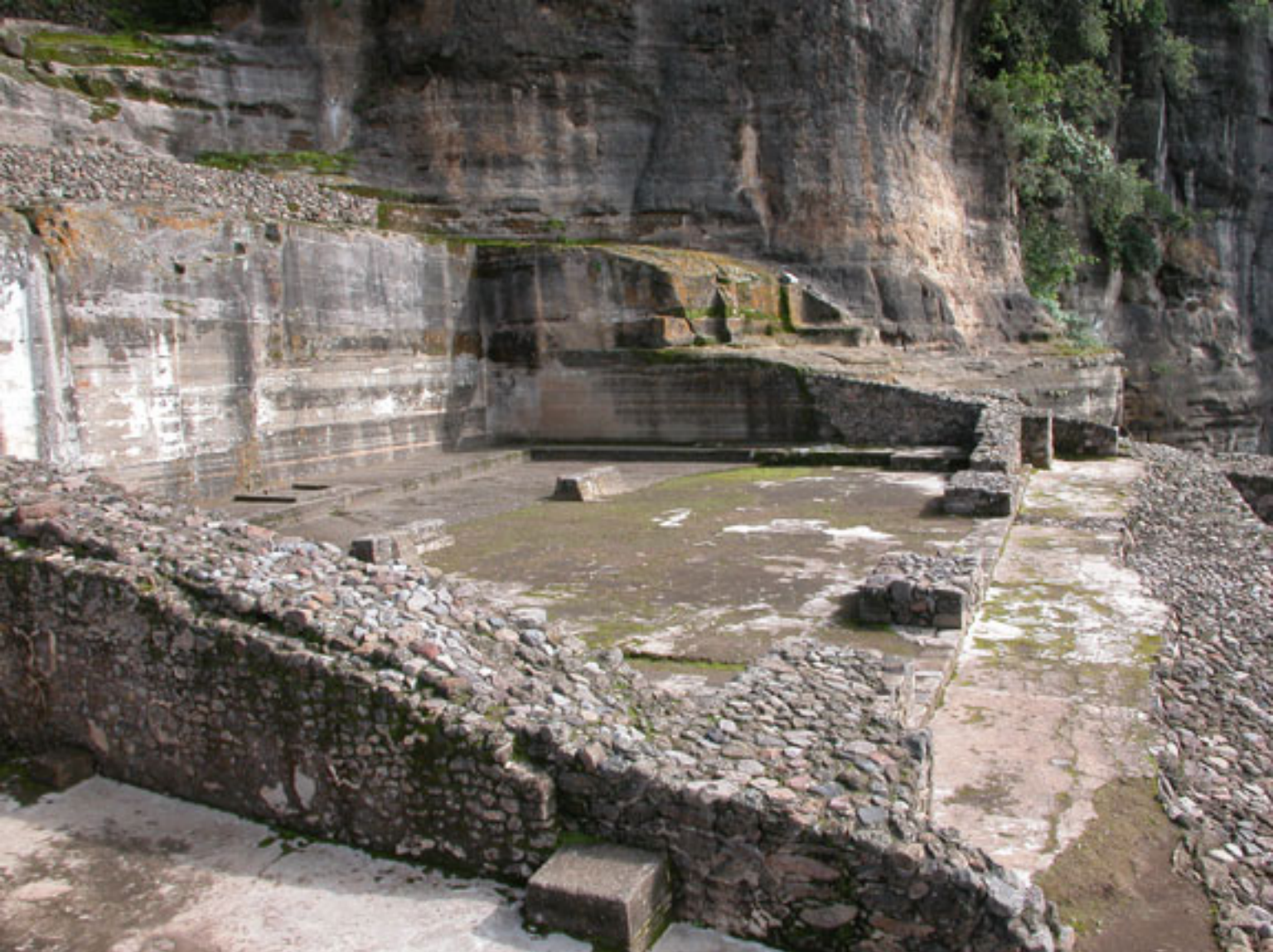
Figura 193. Templo IV.