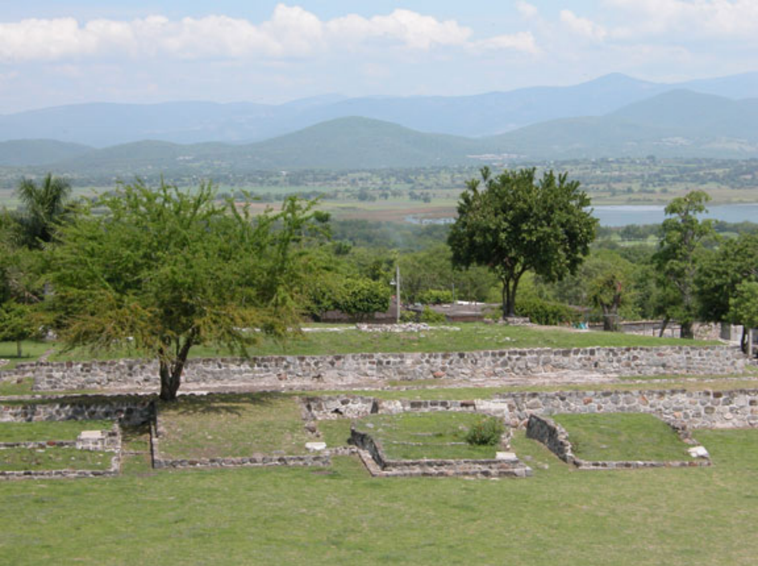
Figura 174. Cancha de juego de pelota y alineamiento de pequeñas plataformas en la Plaza Central de Coatetelco.