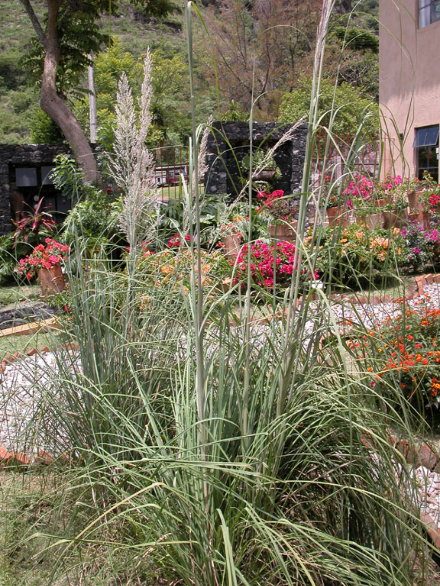
Figura 178b. Pasto de Malinalli.