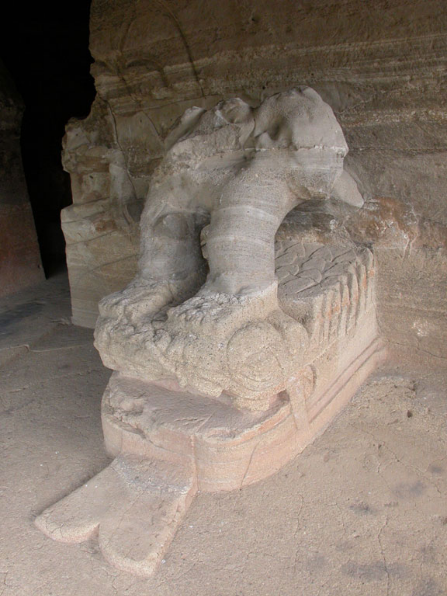
Figura 186. Xiuhtlicatl y Guerrero Águila (foto de Fernando González y González).