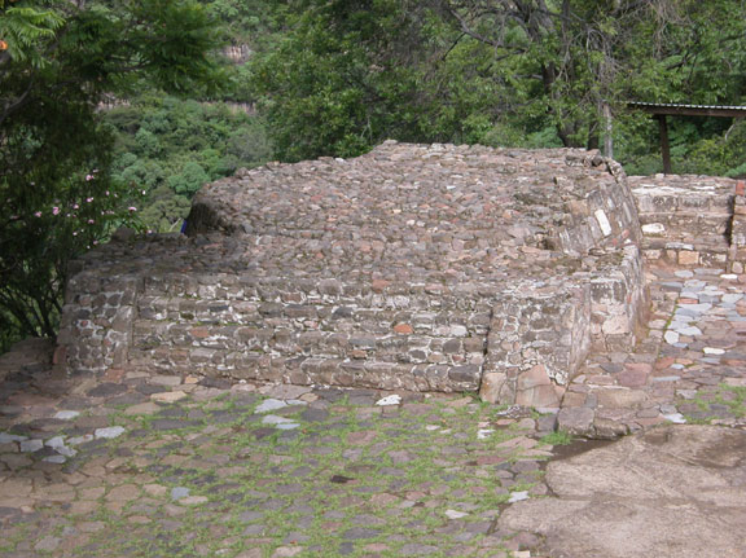
Figura 194. Templo V.