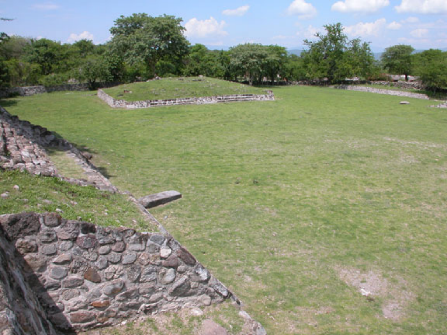
Figura 172. Plaza con la Plataforma Sur de Coatetelco.