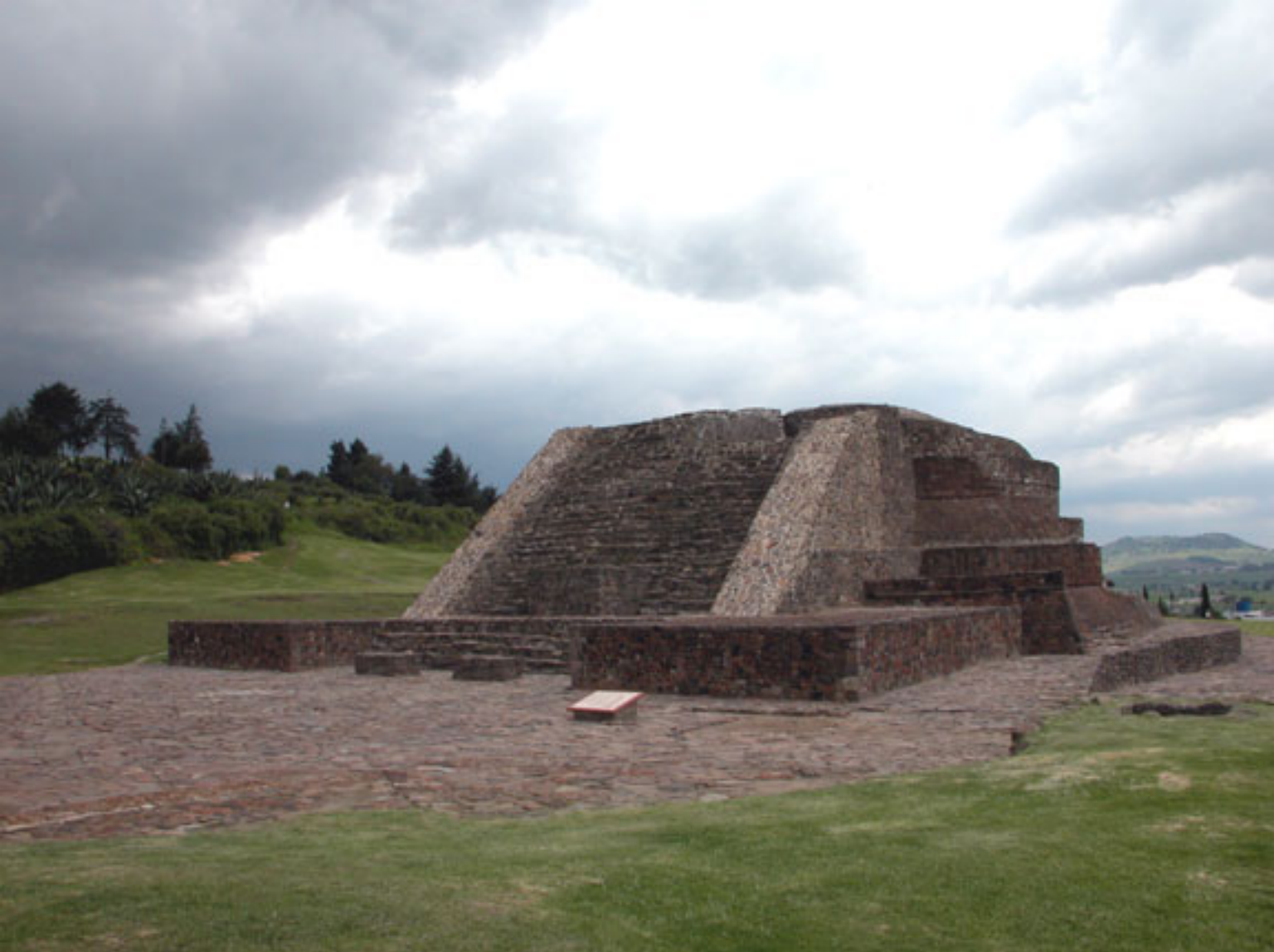
Figura 161. Templo de Ehecattl-Quetzalcoatl.