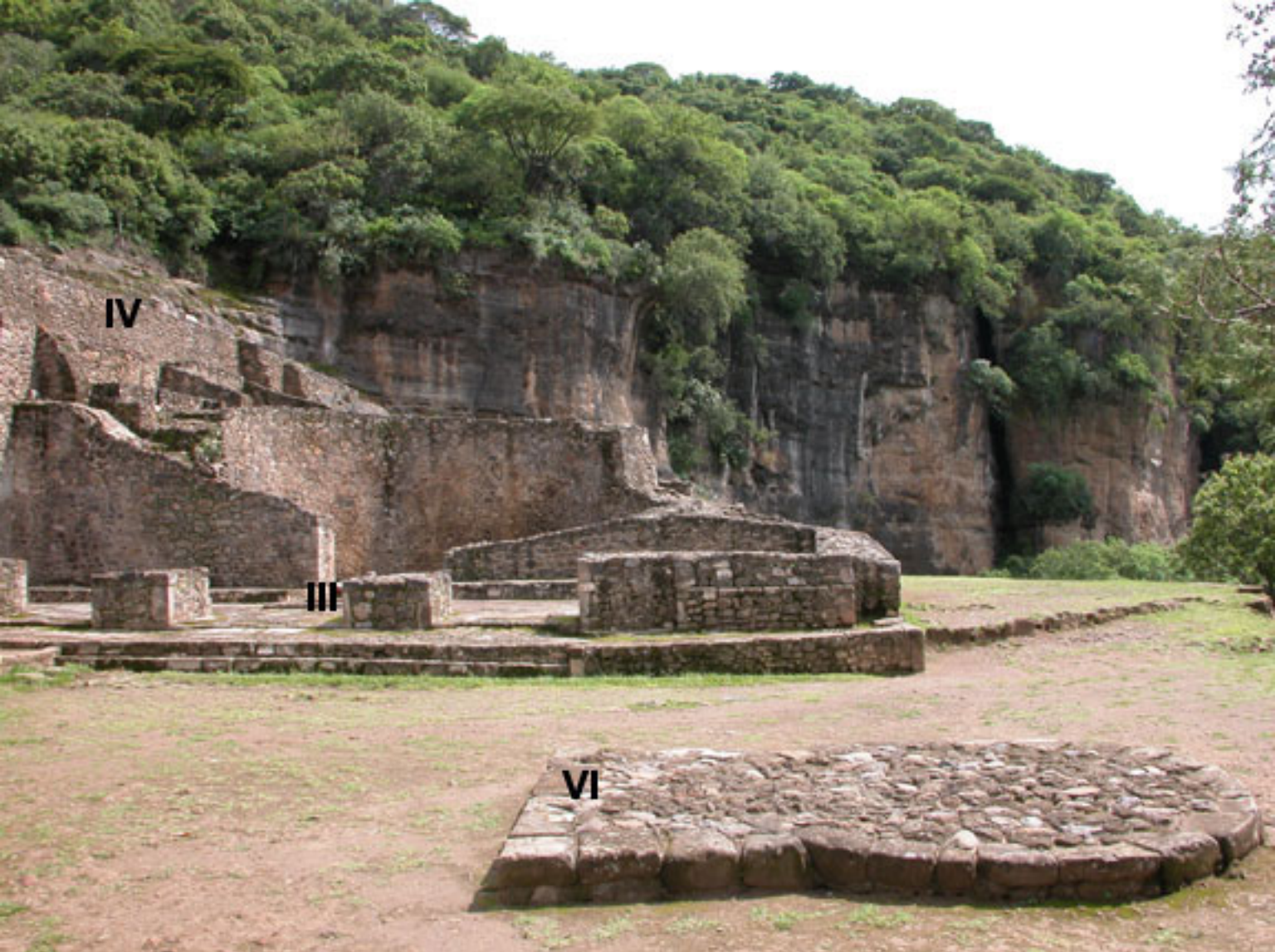
Figura 189. Templos III, IV y VI de Malinalco.