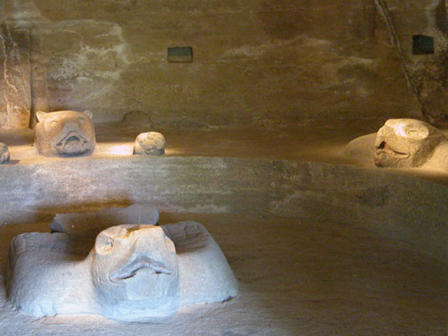
Figura 184. Tronos zoomorfos sobre la banqueta y Águila Solar a la entrada del Templo I.