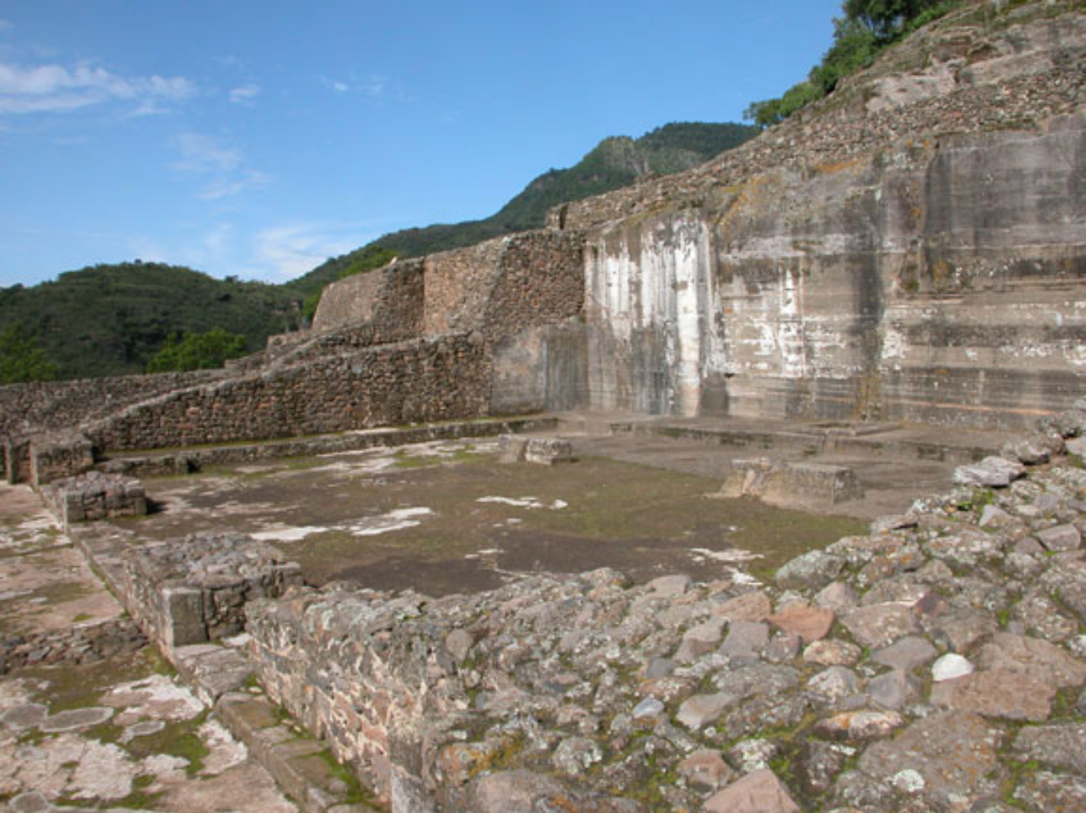
Figura 192. Templo IV.