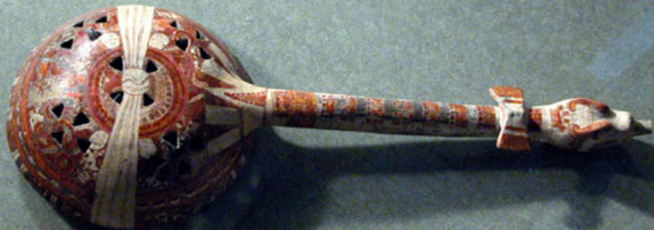
Figura 177. Sahumador de asa larga (foto de Fernando González y González).