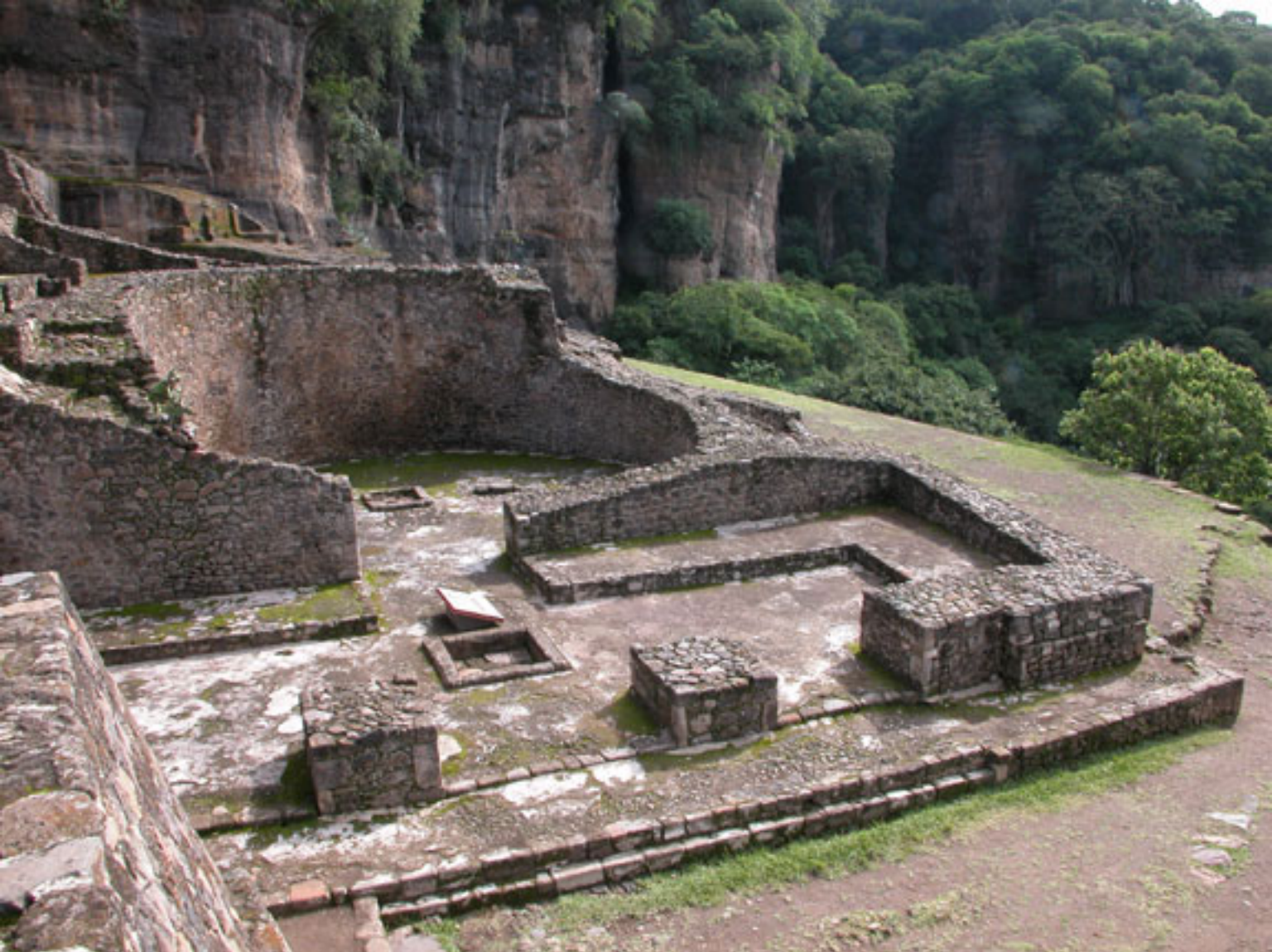
Figura 190. Templo III.