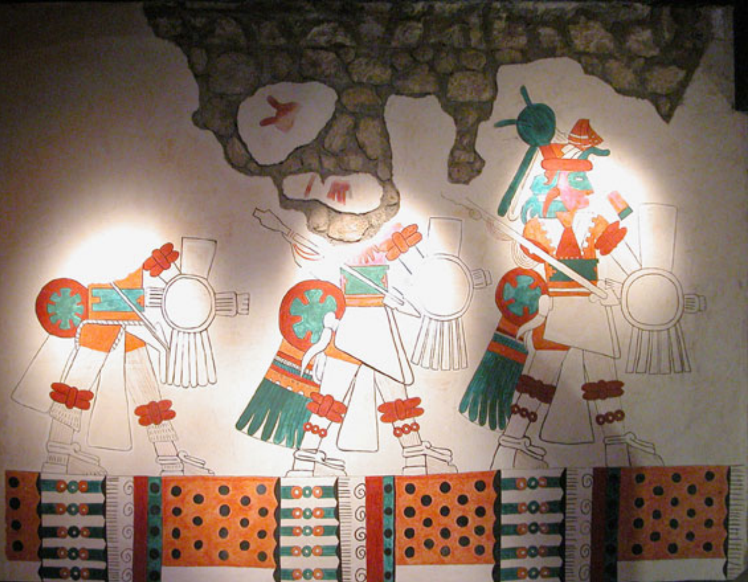
Figura 191. Pintura mural de los Mimixcoua.