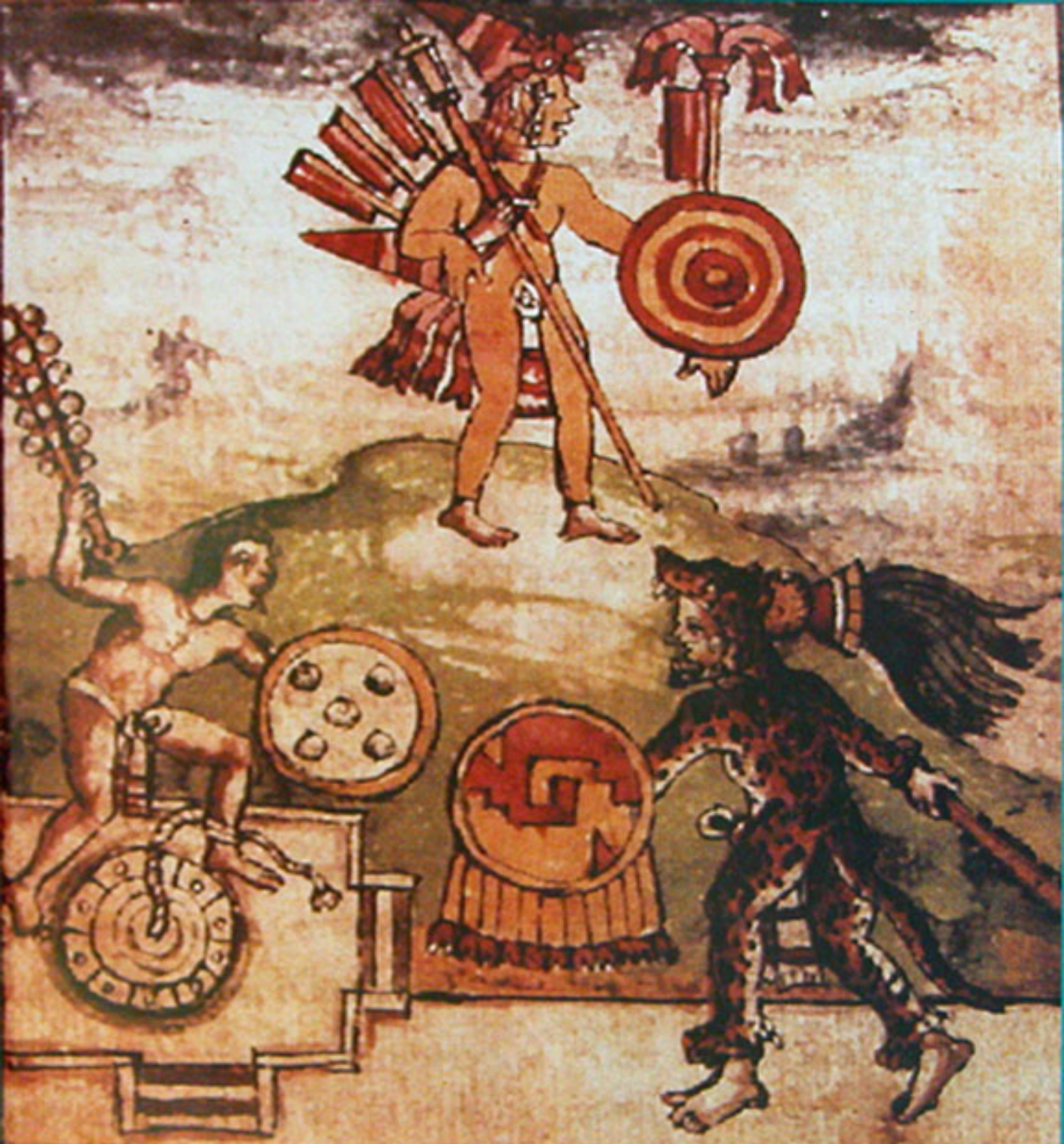
Figura 175. Imagen de sacrificio gladiatorio del Atlas de Durán.