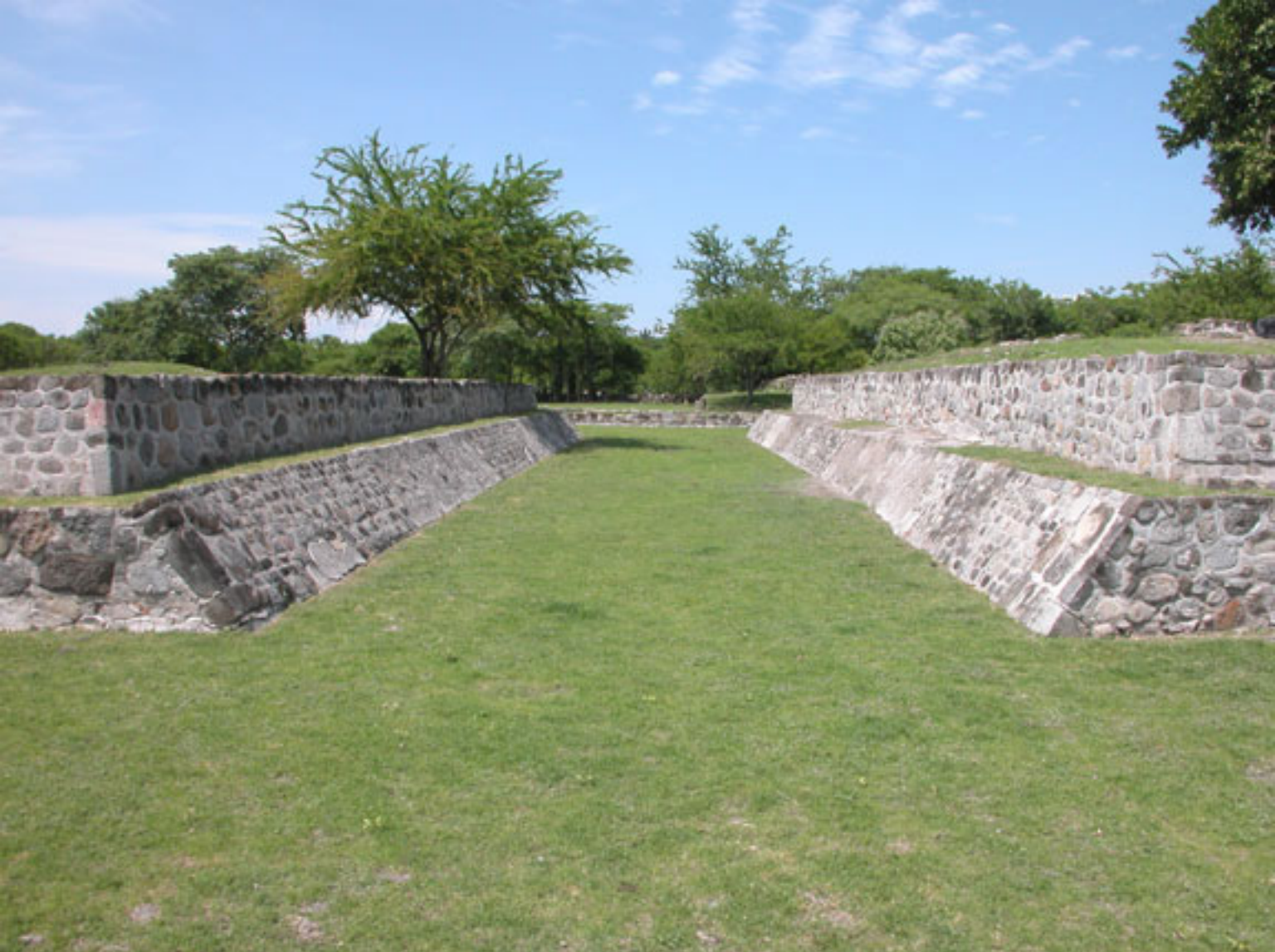
Figura 169. Cancha de juego de pelota de Coatetelco.