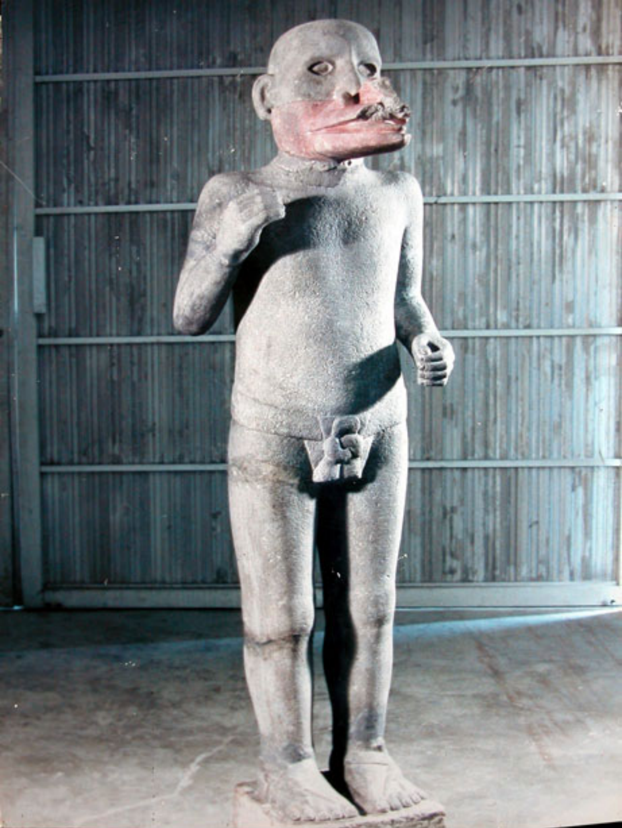
Figura 162. Estatua de Ehecátl.