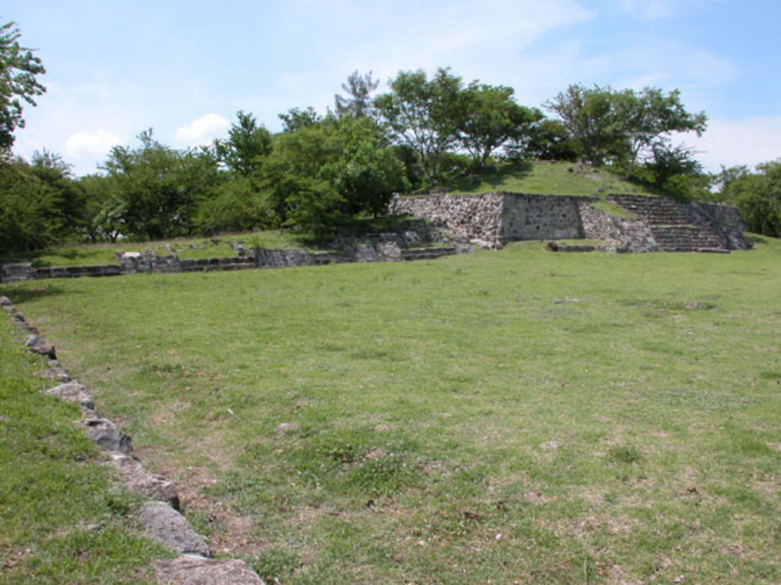
Figura 170. Templo-Pirámide principal de Coatetelco.