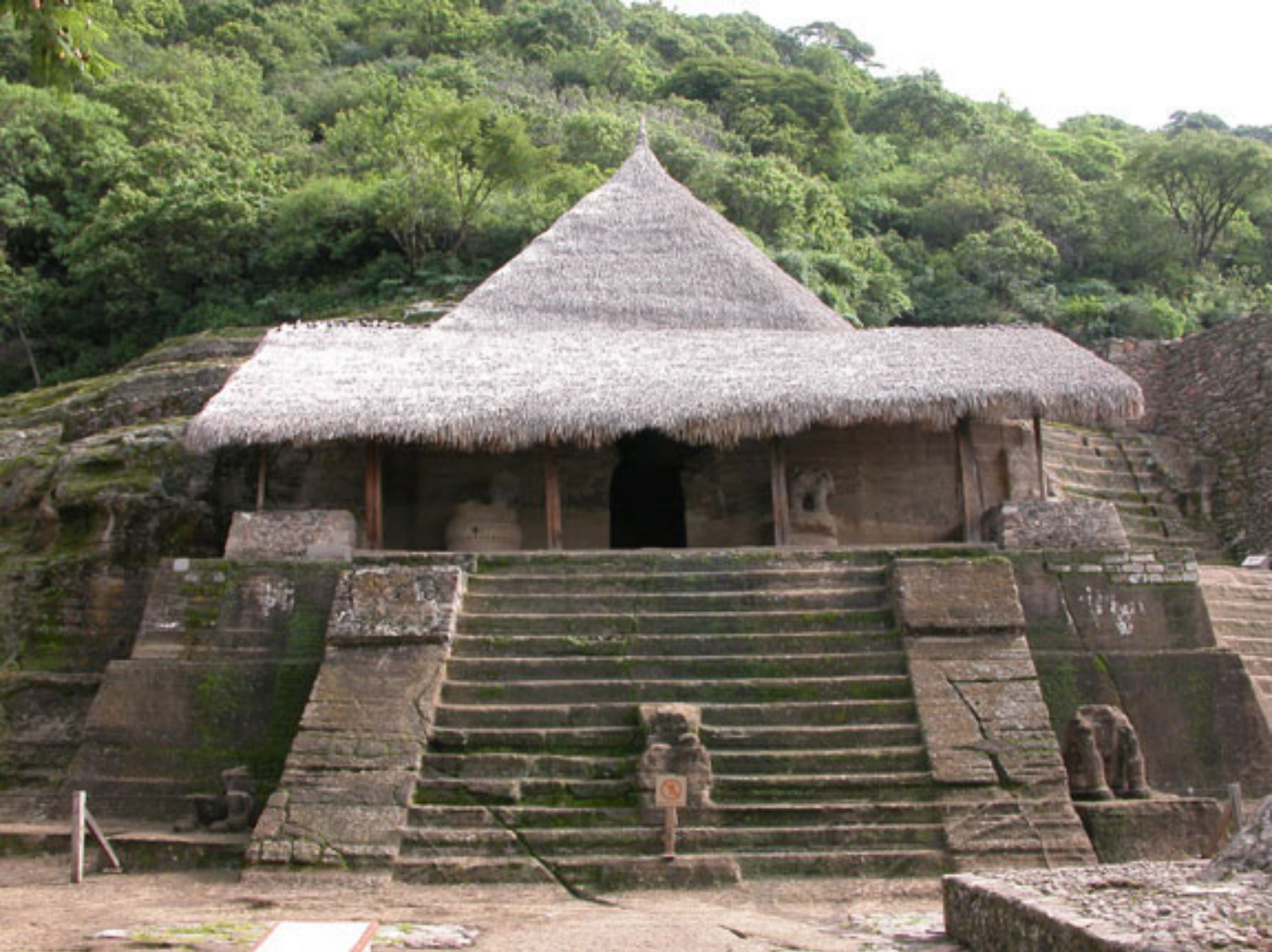
Figura 181. Templo I (Cuauhcalli).