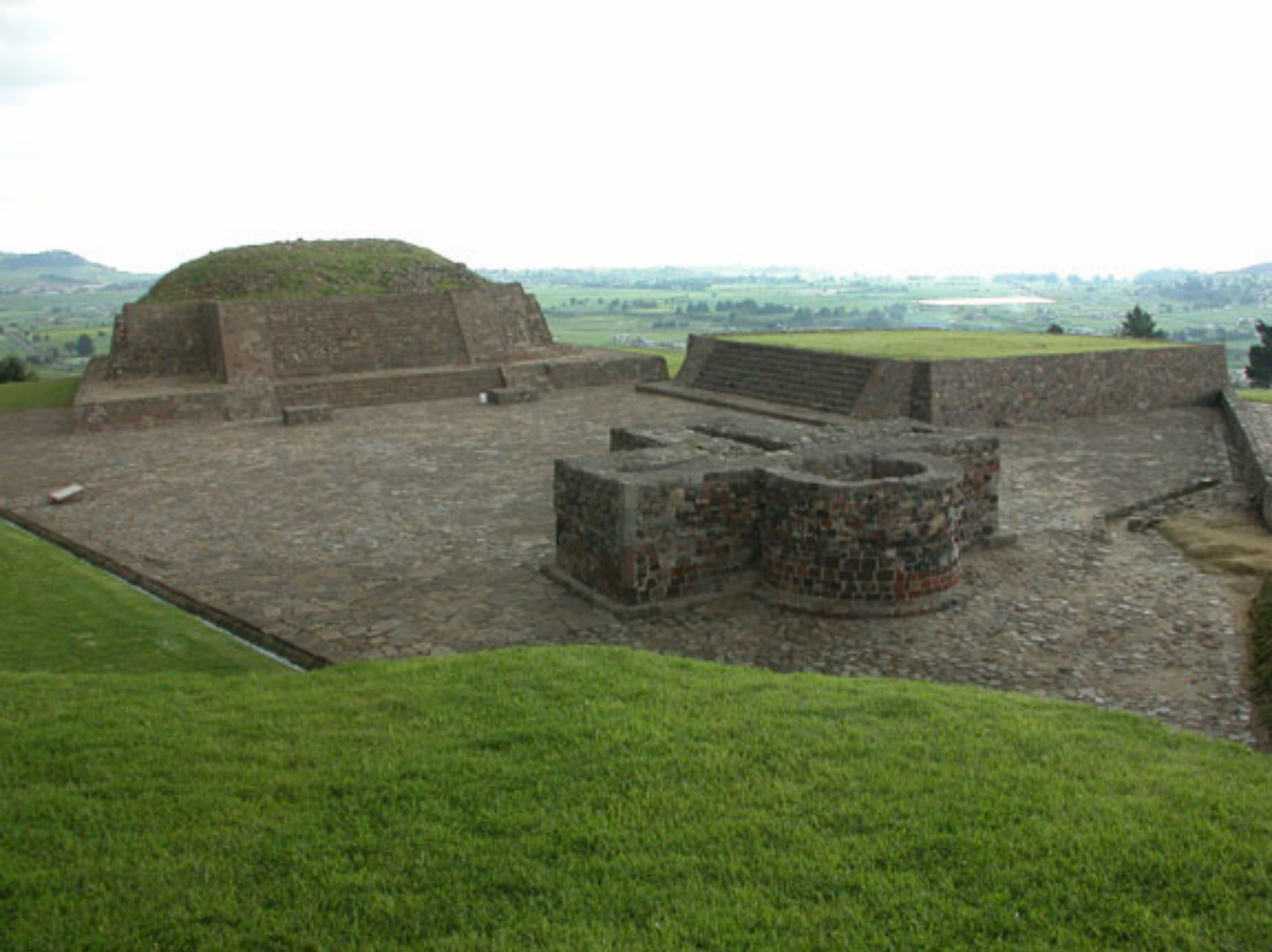
Figura 163. Grupo de Tlaloc en Calixtlahuaca.