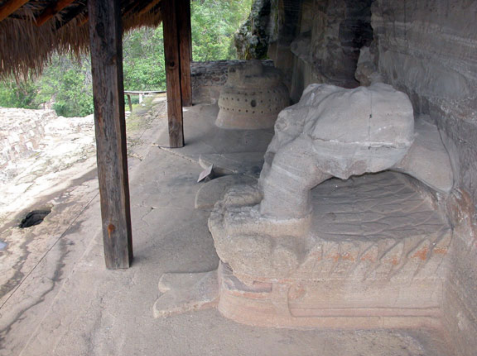
Figura 182. Xiuhcoatl, huehuetl, y cavidad de la piedra de sacrificios.