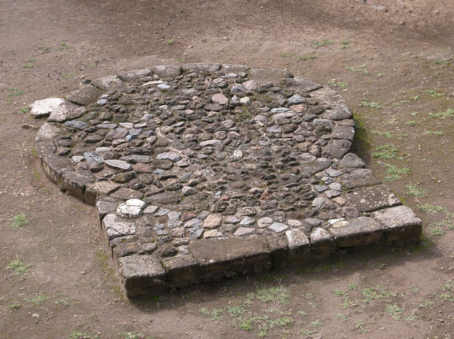
Figura 195. Templo VI (Temalacatl).