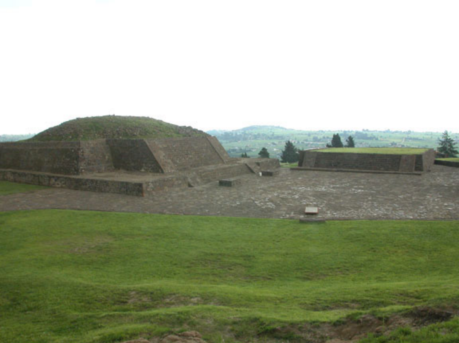
Figura 166. Edificio rectangular del Grupo de Tlaloc.