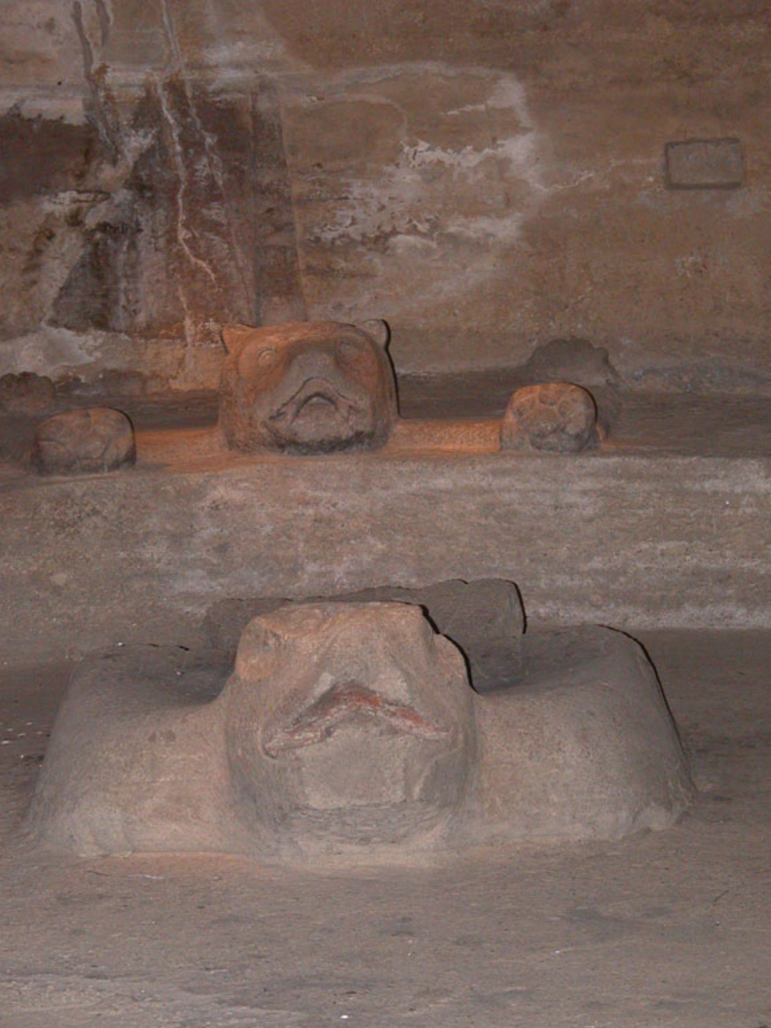
Figura 185. Trono de Jaguar y Águila Solar.