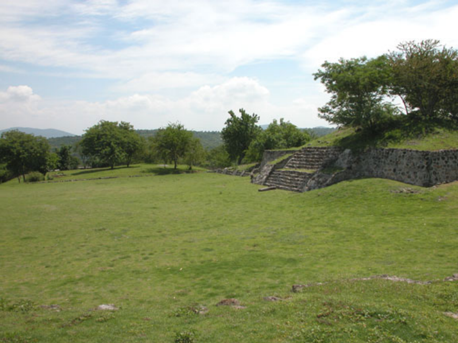
Figura 171. Plaza de Coatetelco, con su Plaza y Templo-Pirámide principal.