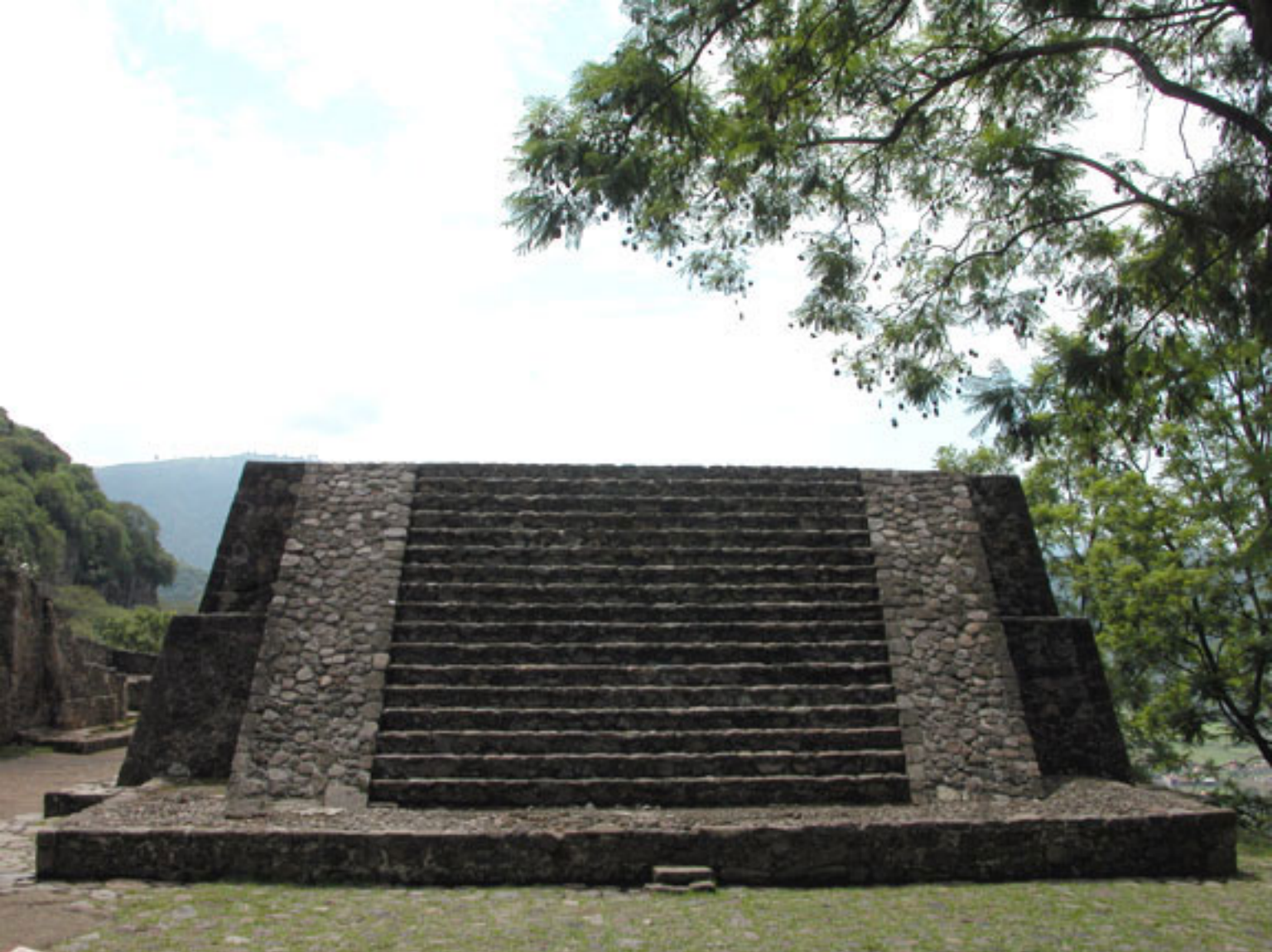
Figura 188. Templo II.