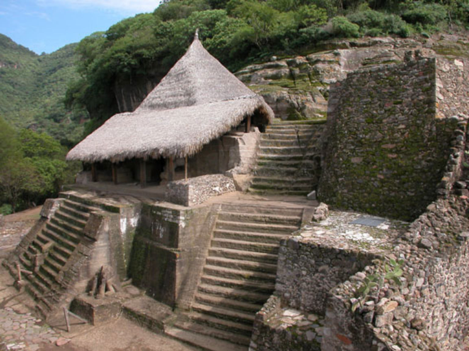
Figura 180. Templo I (Cuauhcalli).