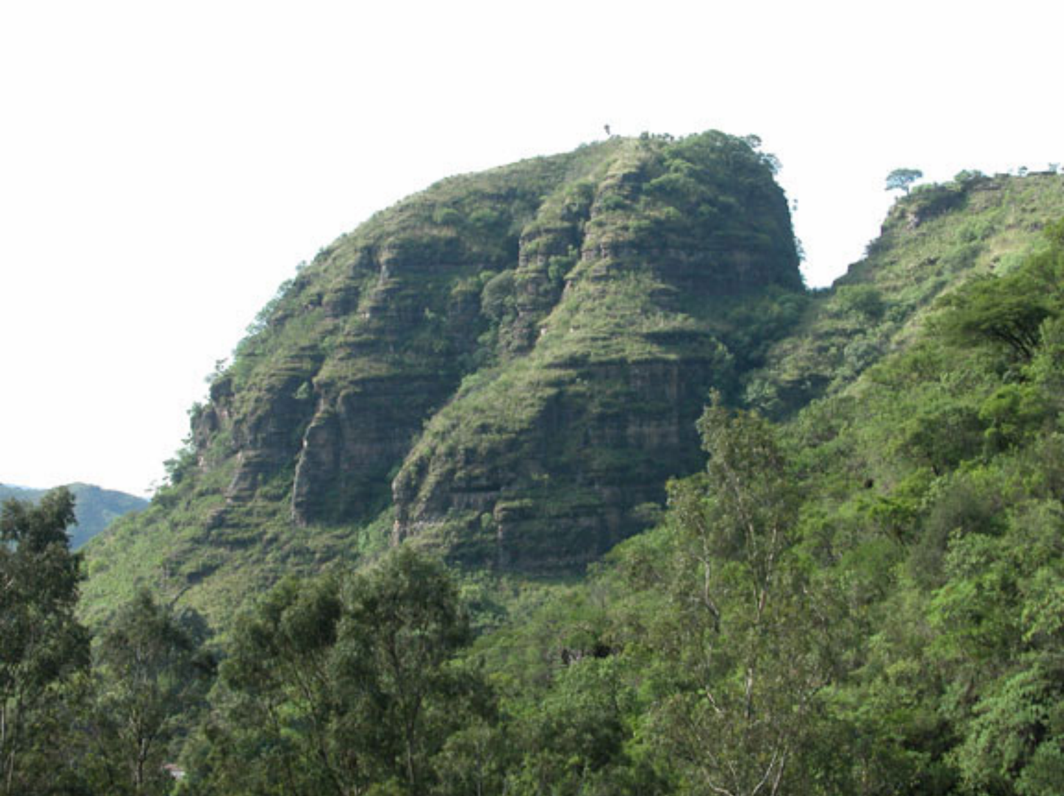
Figura 187. Hendidura en la montaña frente a los templos de Malinalco.