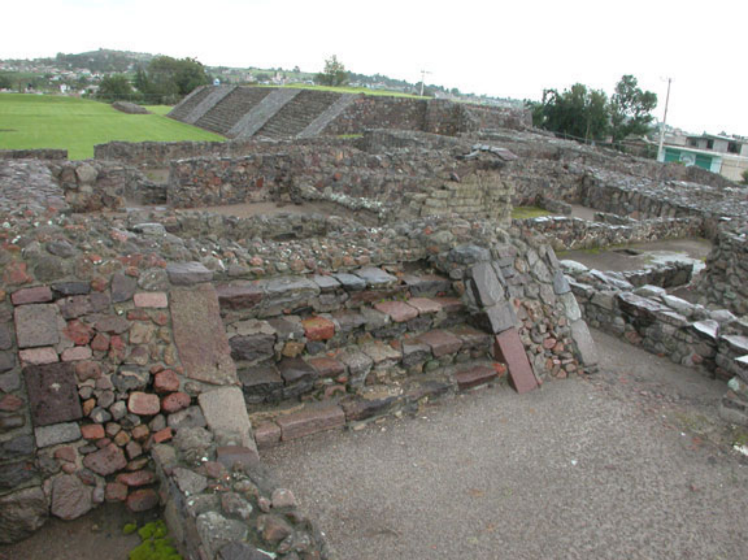
Figura 167. Grupo del Calmecac de Calixtlahuaca.