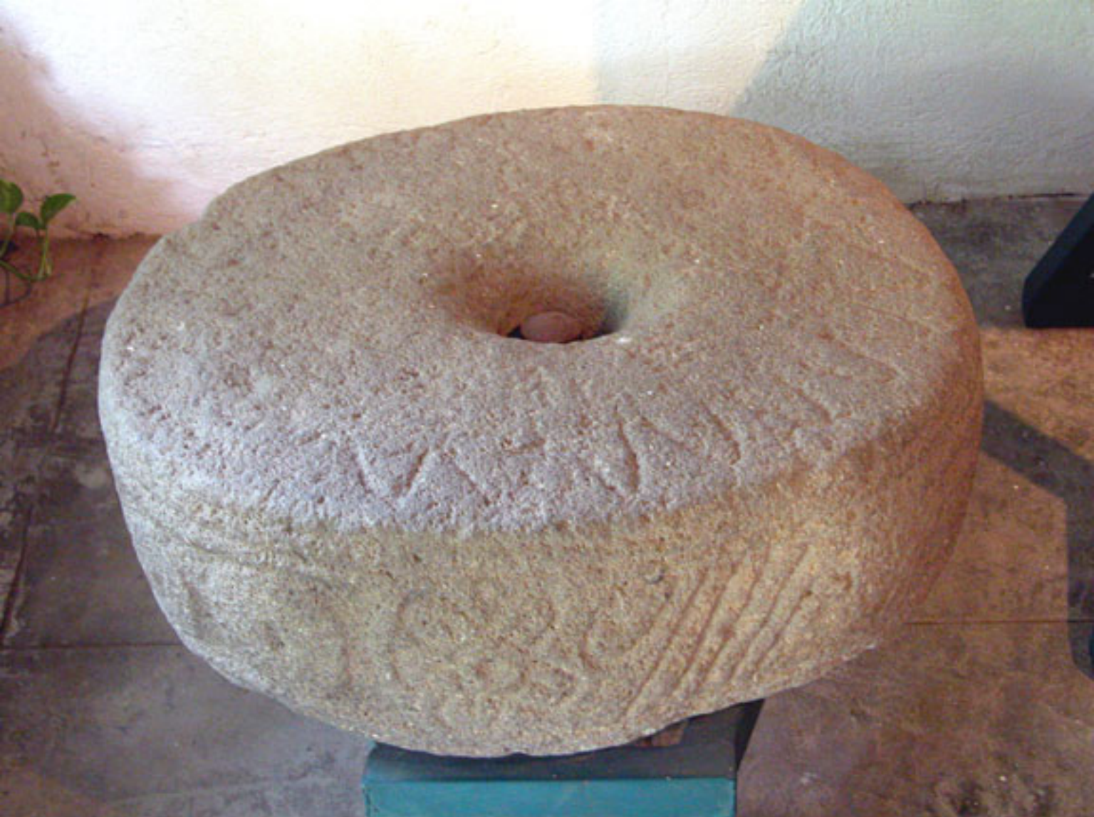
Figura 176. Temalacatl para sacrificio gladiatorio.