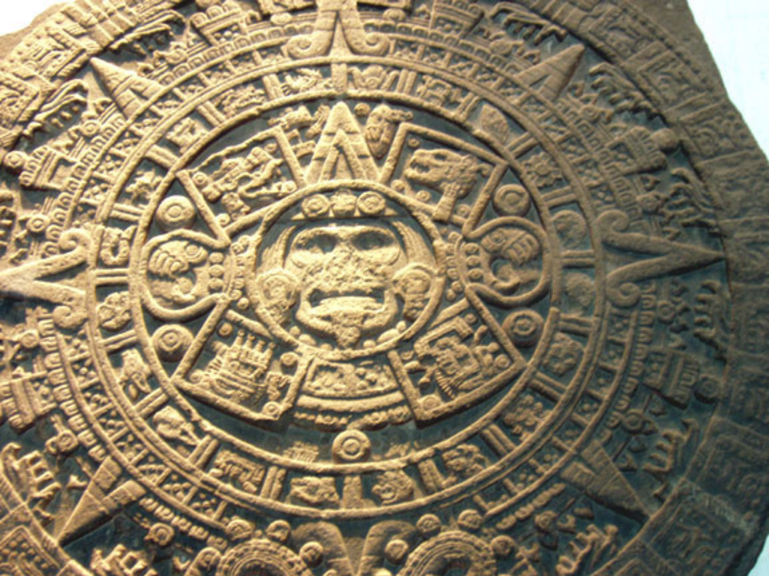
Figura 12. Detalle de la Piedra del Sol.