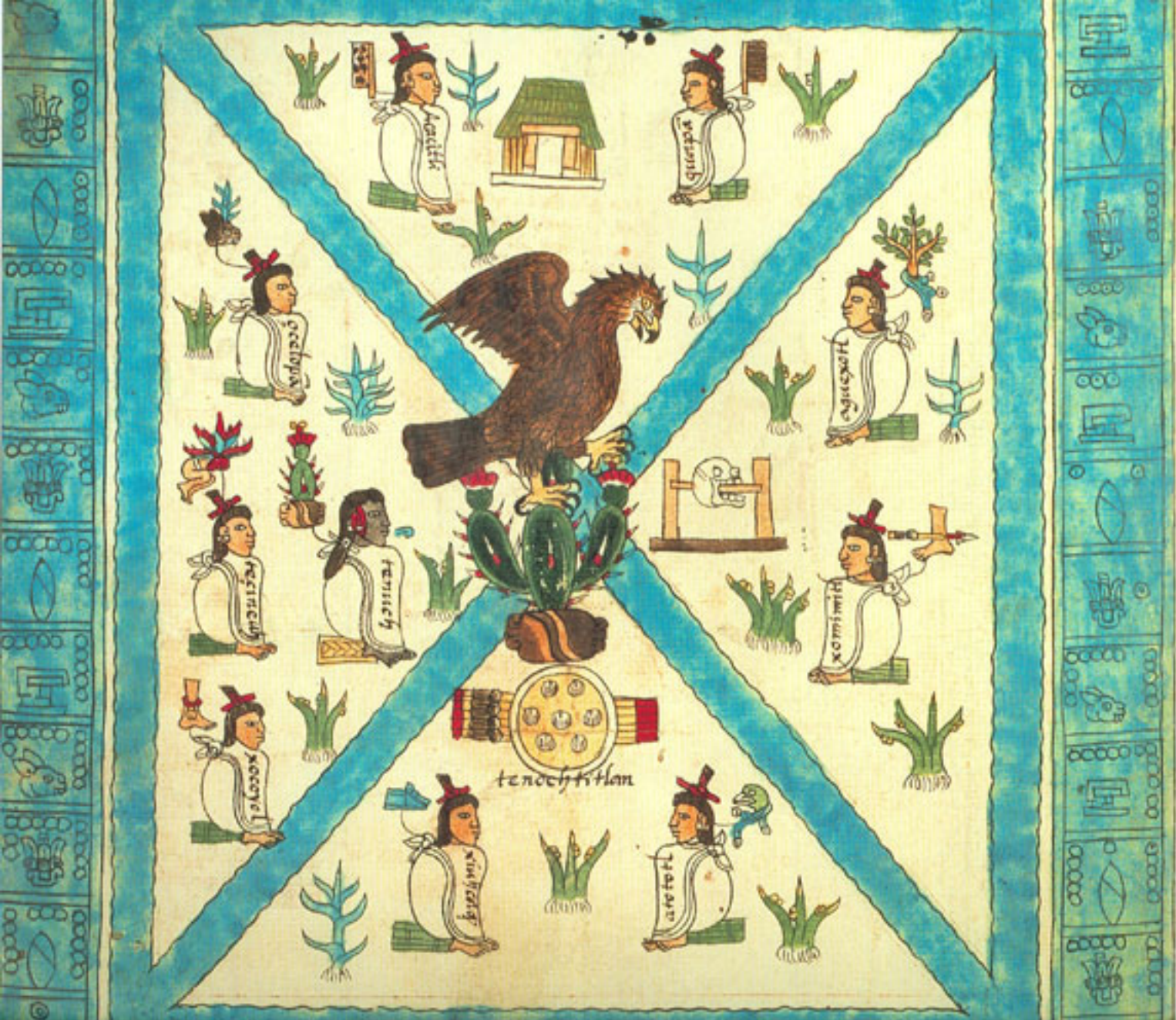
Figura 9. La Fundación de Tenochtitlan tomada del Códice Mendoza.