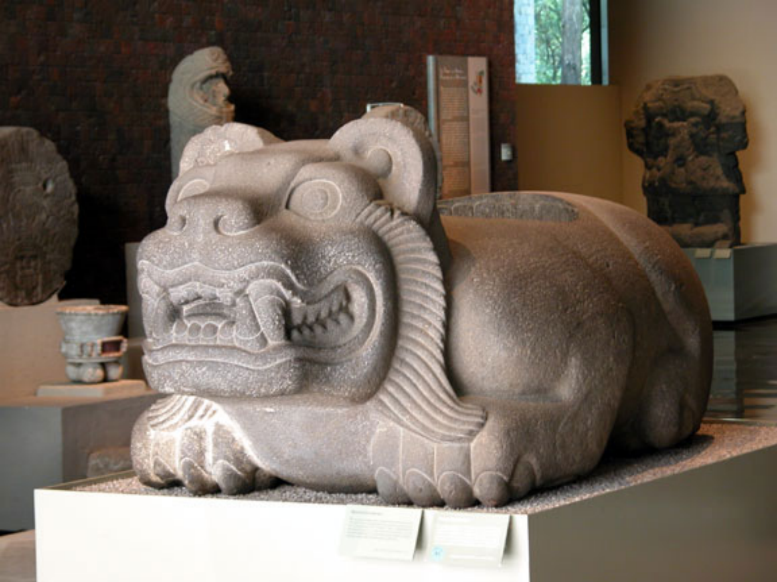
Figura 2. Ocelotl-Cuauhxicalli.