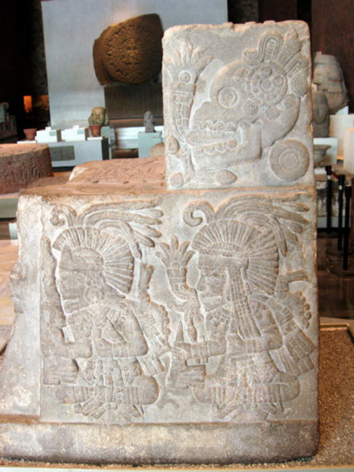
Figura 10. Parte lateral de la Piedra del Templo.