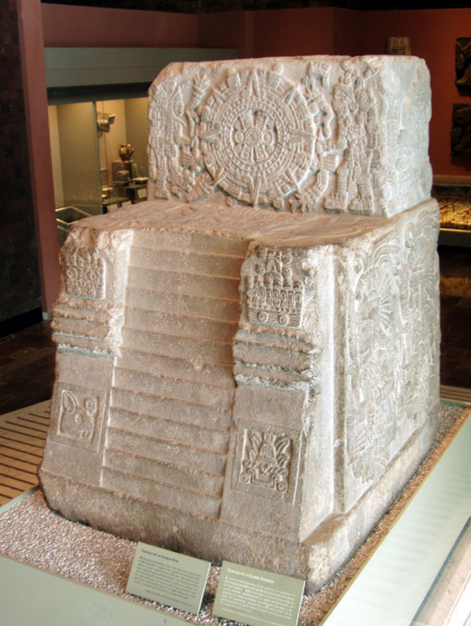
Figura 7. Piedra del Templo.