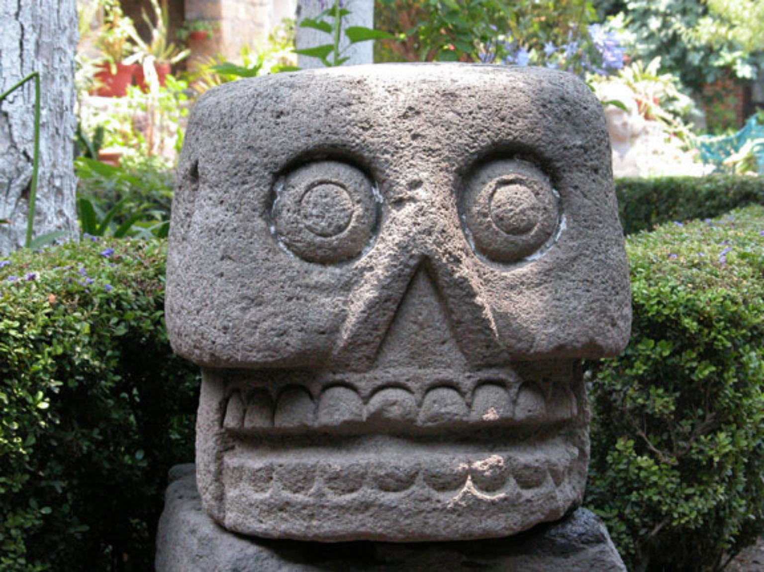
Figura 1. Calavera de piedra de Santa Cecilia Acatitlán.