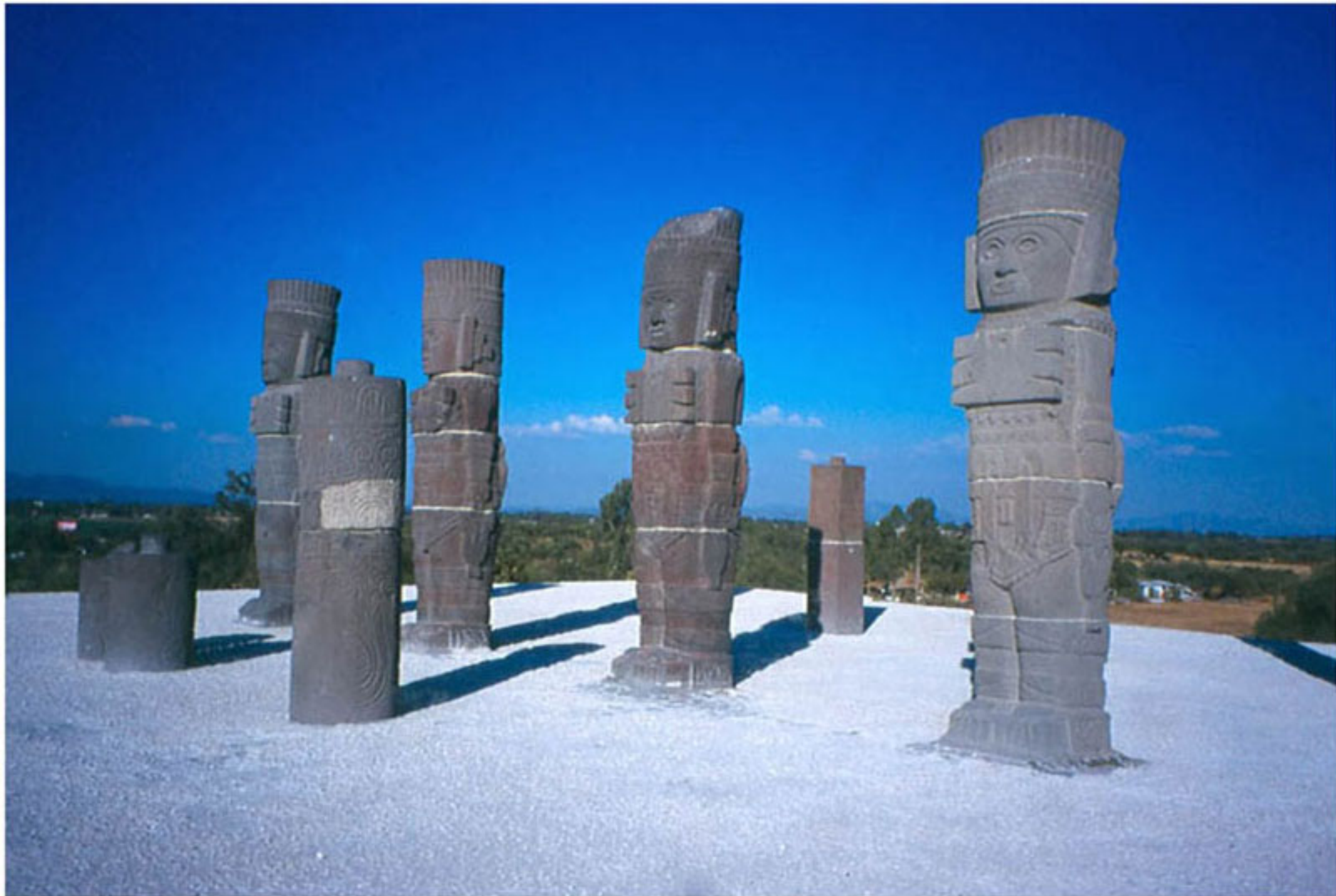
Figura 16. Los Atlantes de Tula (foto de Manuel Aguilar-Moreno).