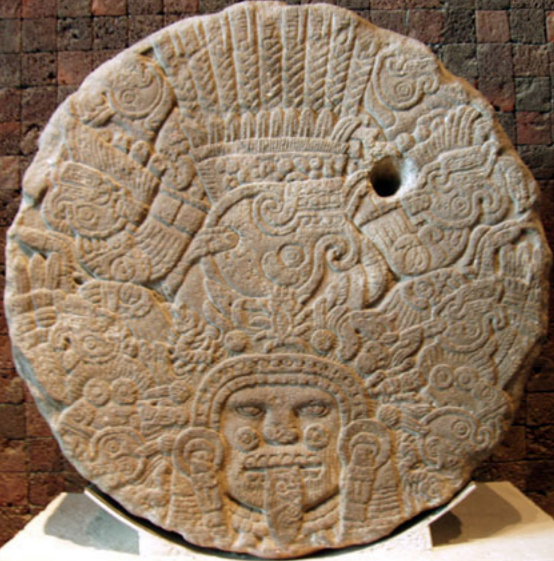
Figura 19. Tlaltecuhтли.