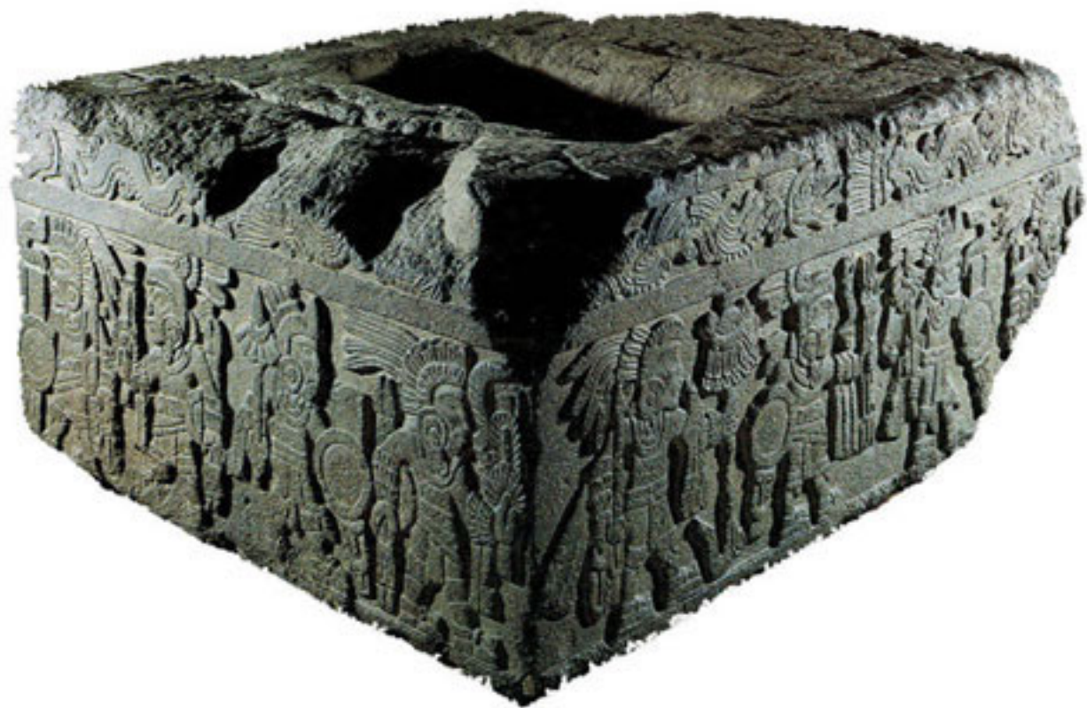
Figura 5. Piedra de los Guerreros.