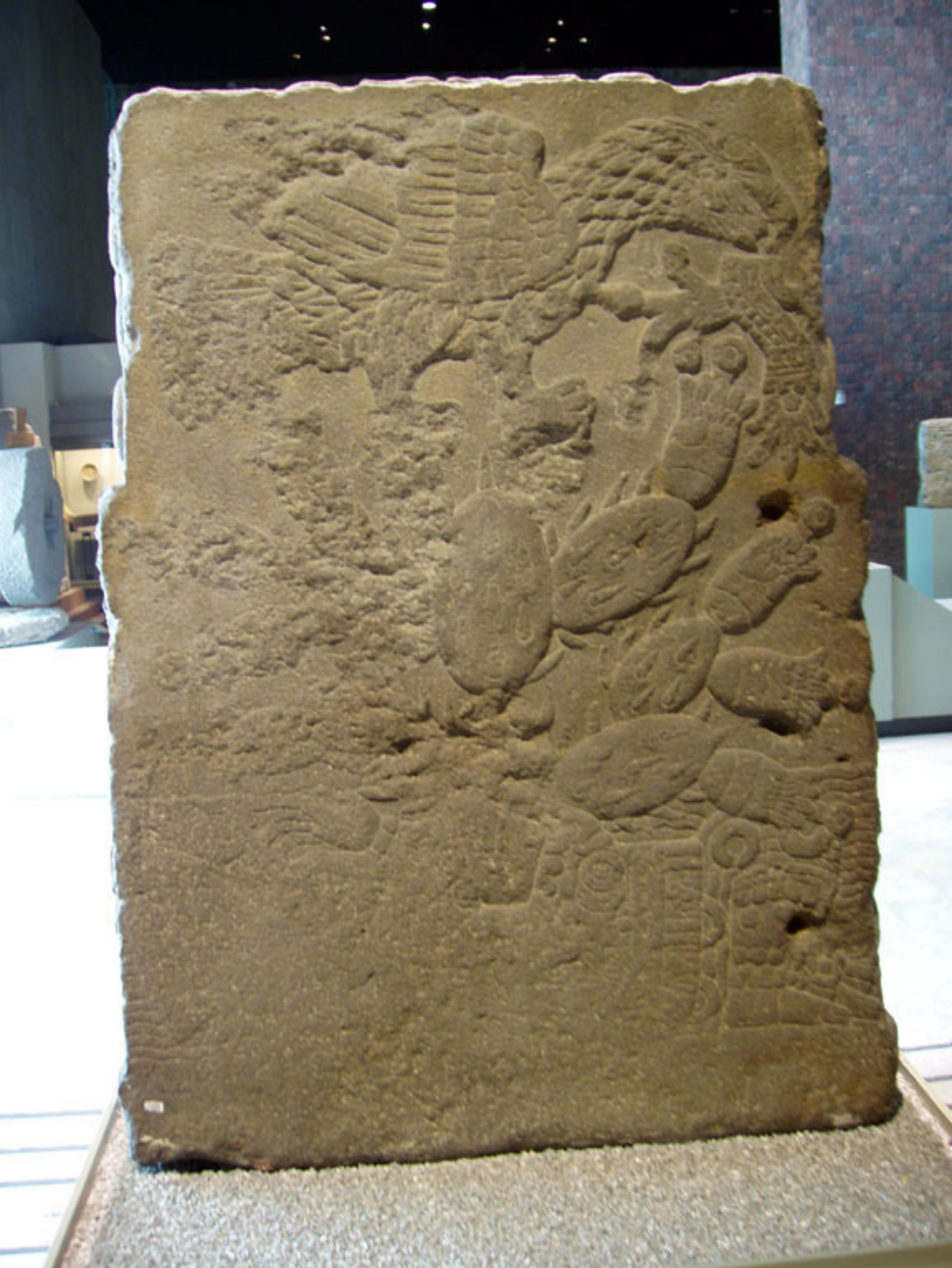
Figura 8. Parte posterior de la Piedra del Templo.