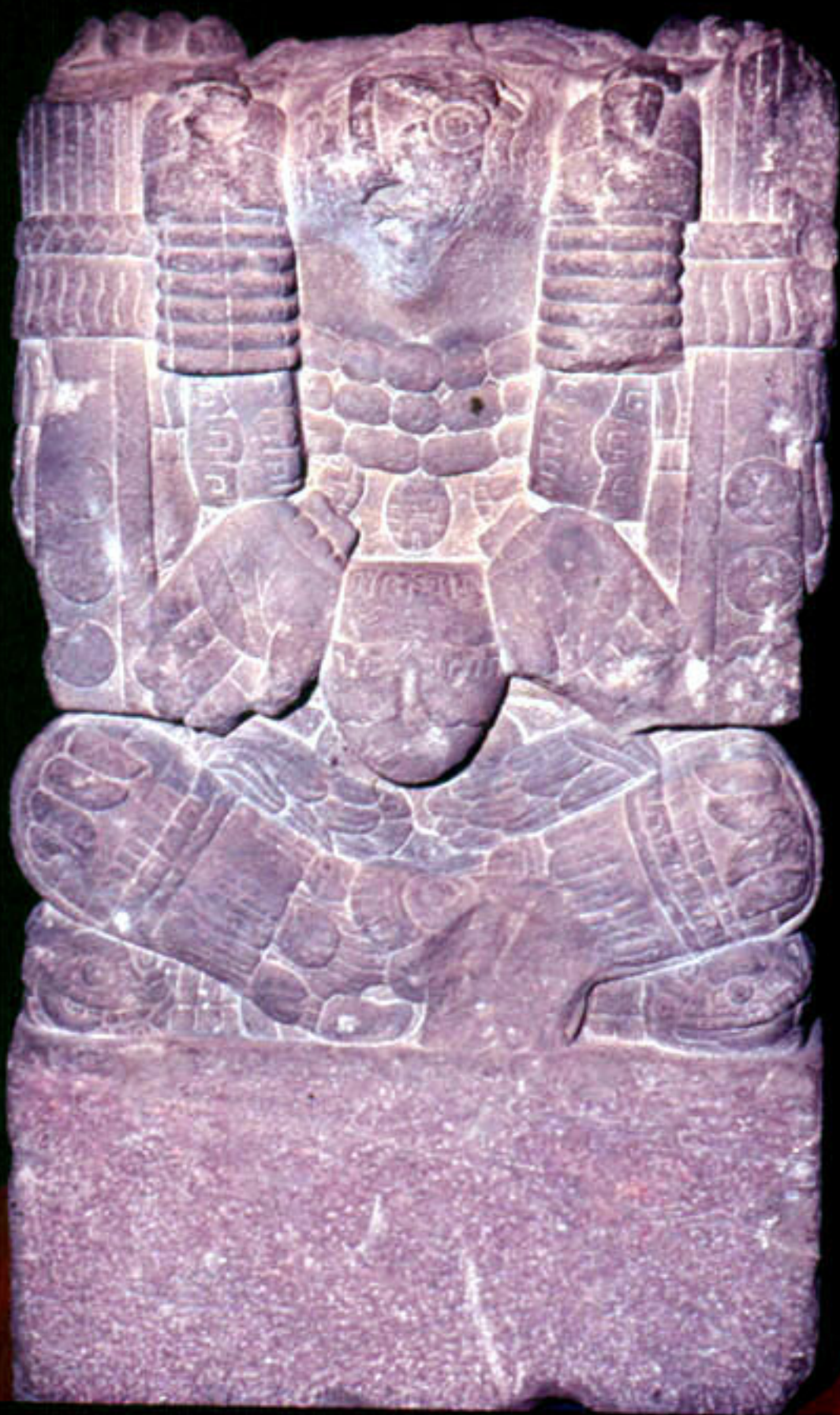
Figura 20. El Tlaltecuhтли del Metro.