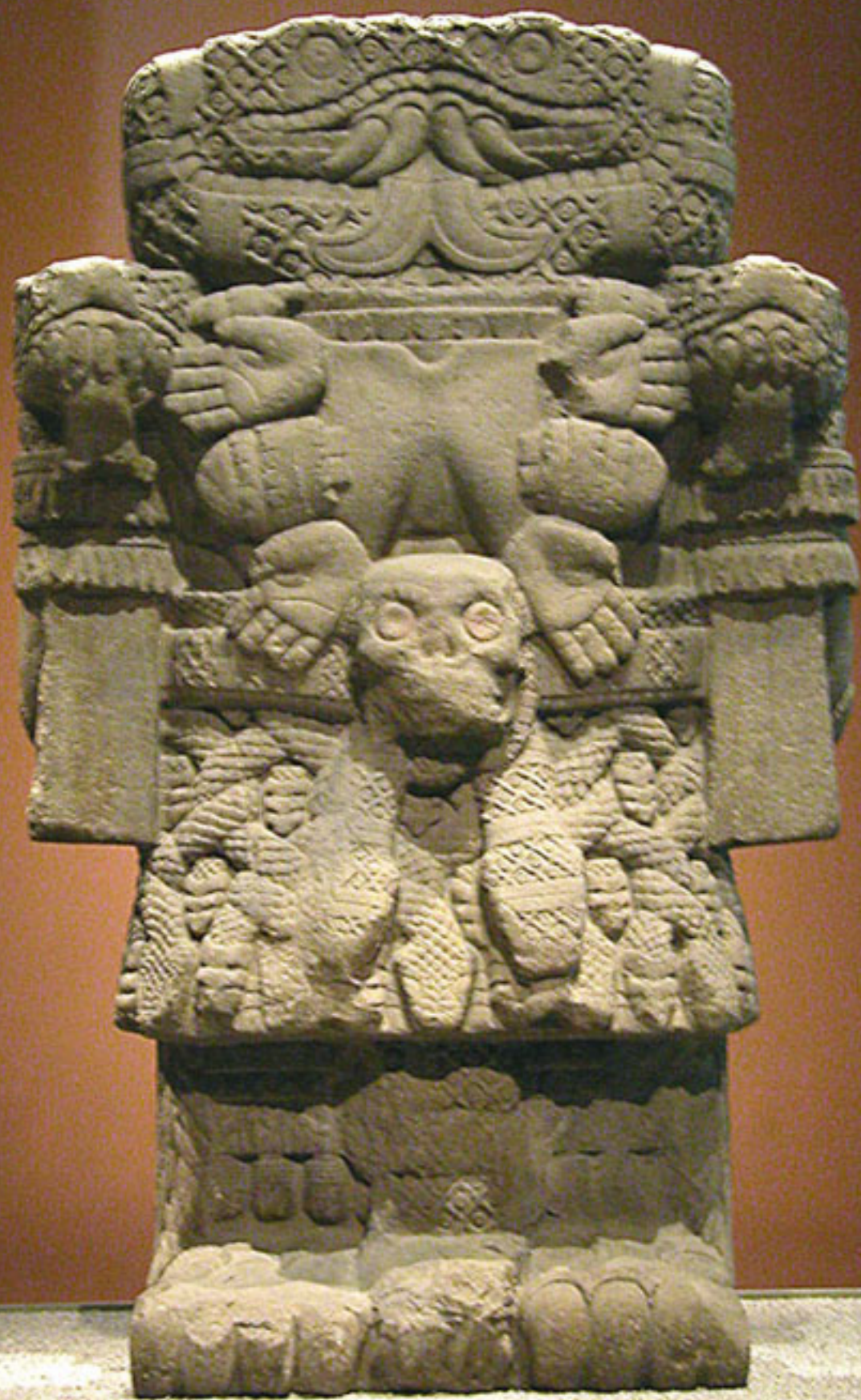
Figura 21. Coatlicue.