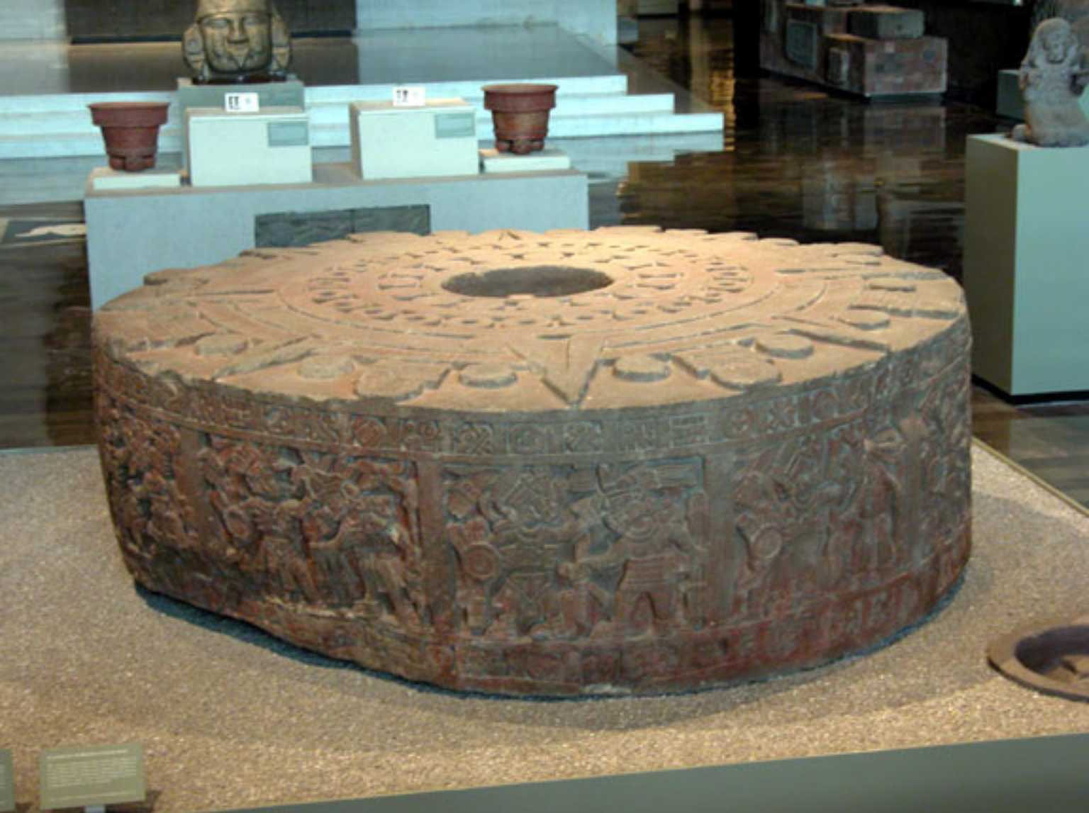
Figura 14. La Piedra de Motecuhzoma I (foto de Fernando González y González).