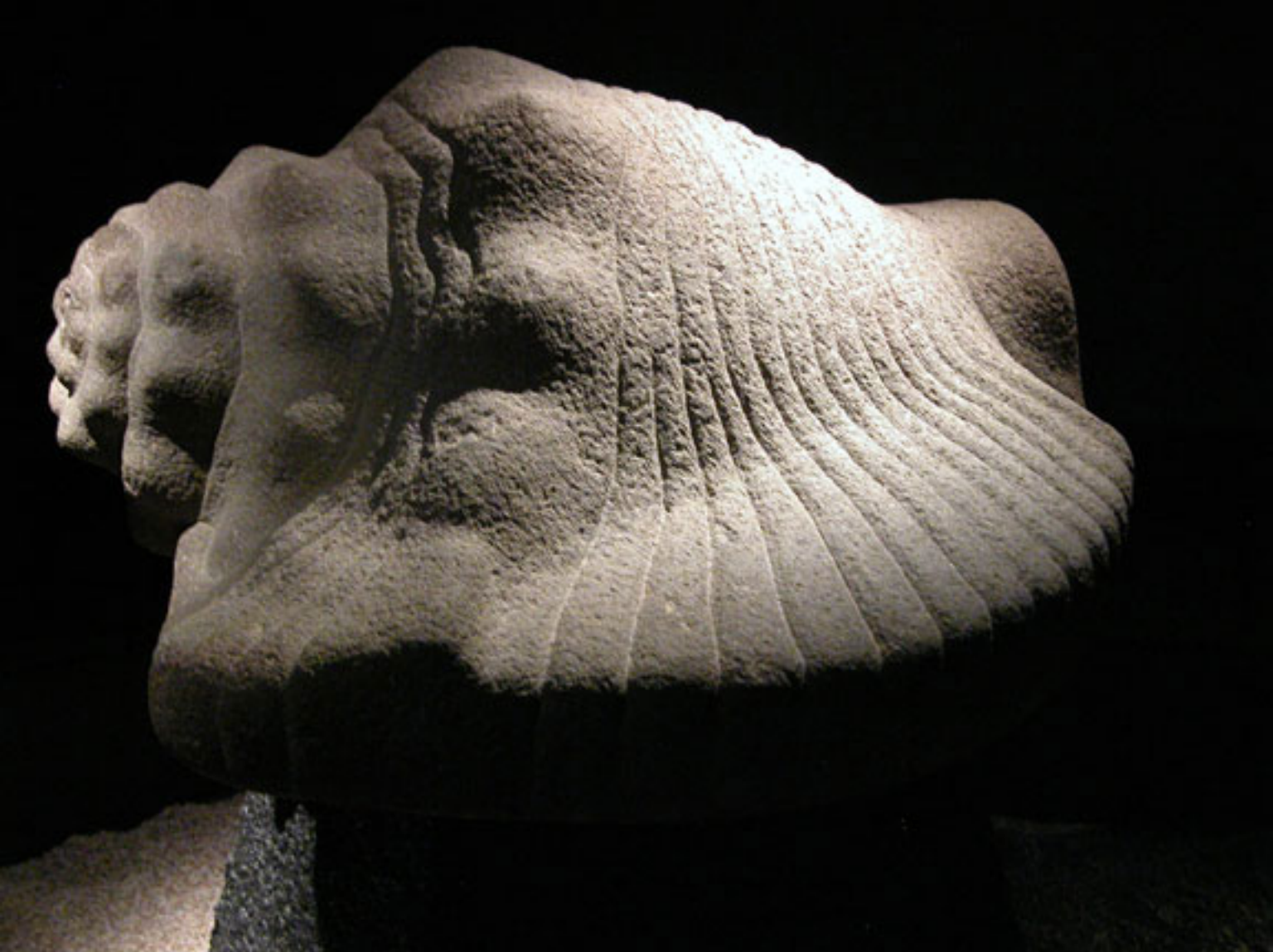
Figura 18. El Caracol.