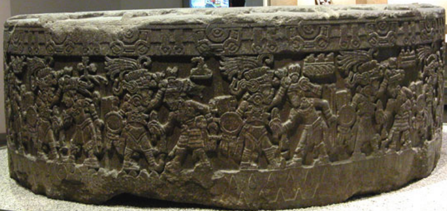
Figura 13. La Piedra de Tizoc.