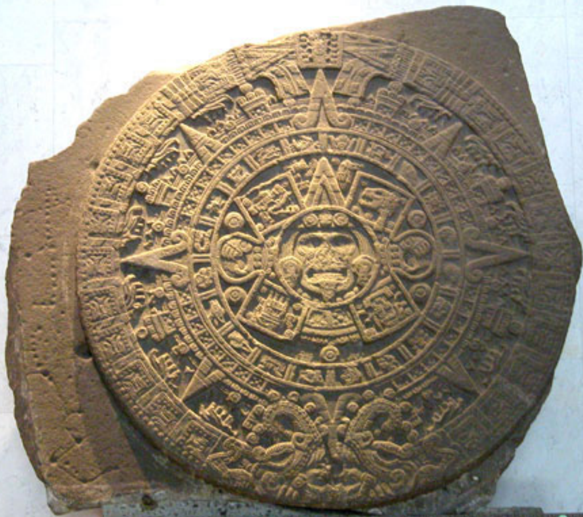
Figura 11. La Piedra del Sol.