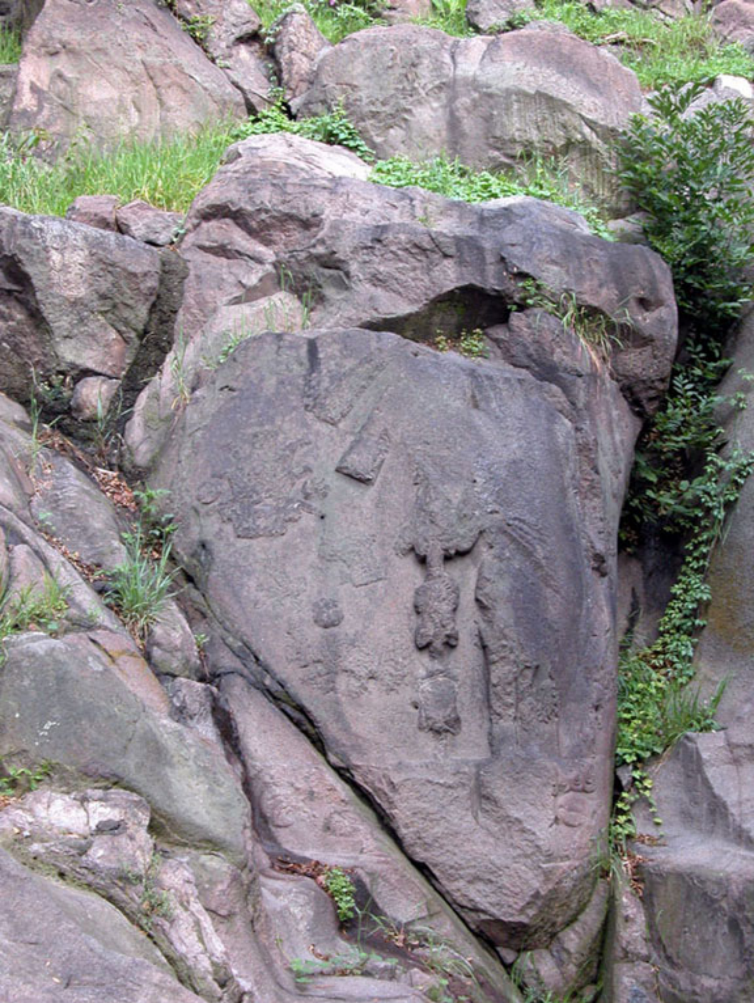
Figura 17. Retrato de Motecuhzoma II en el Parque Chapultepec (foto de Fernando González y González).