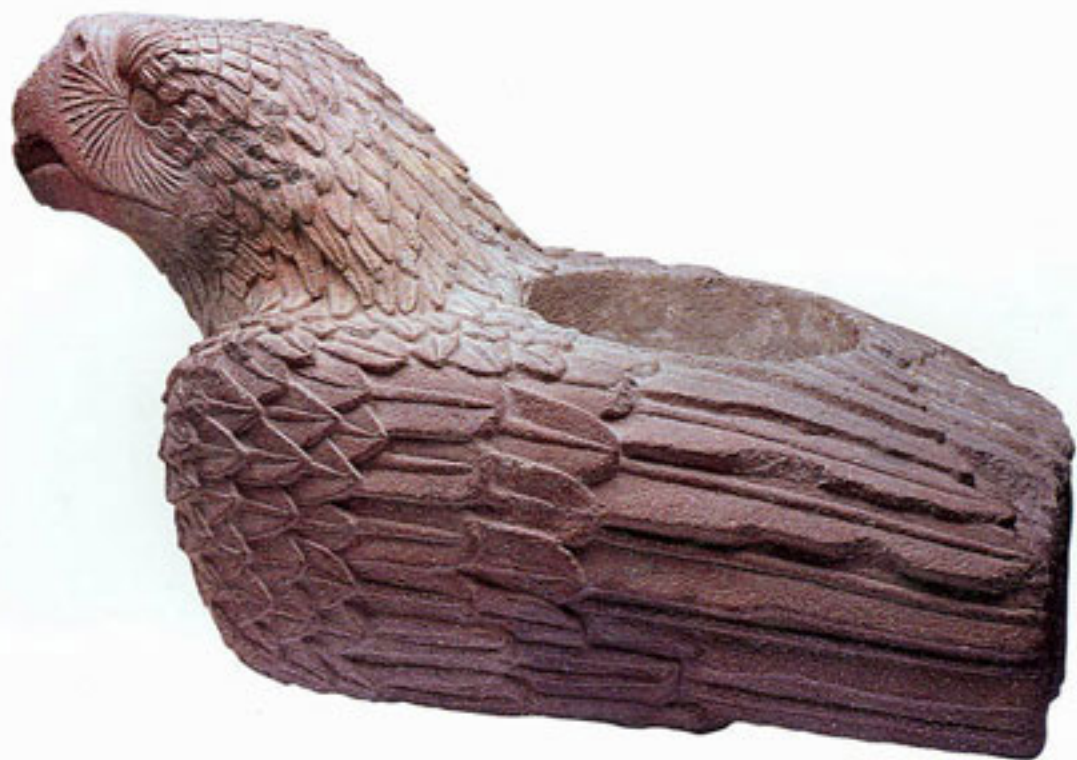
Figura 3. Cuauhtli-Cuahxicalli.