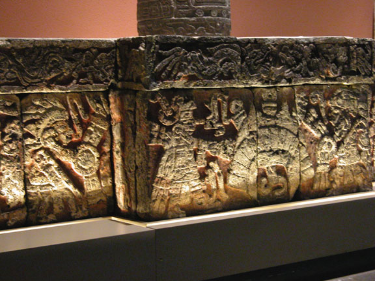
Figura 6. Relieve de la Banqueta.