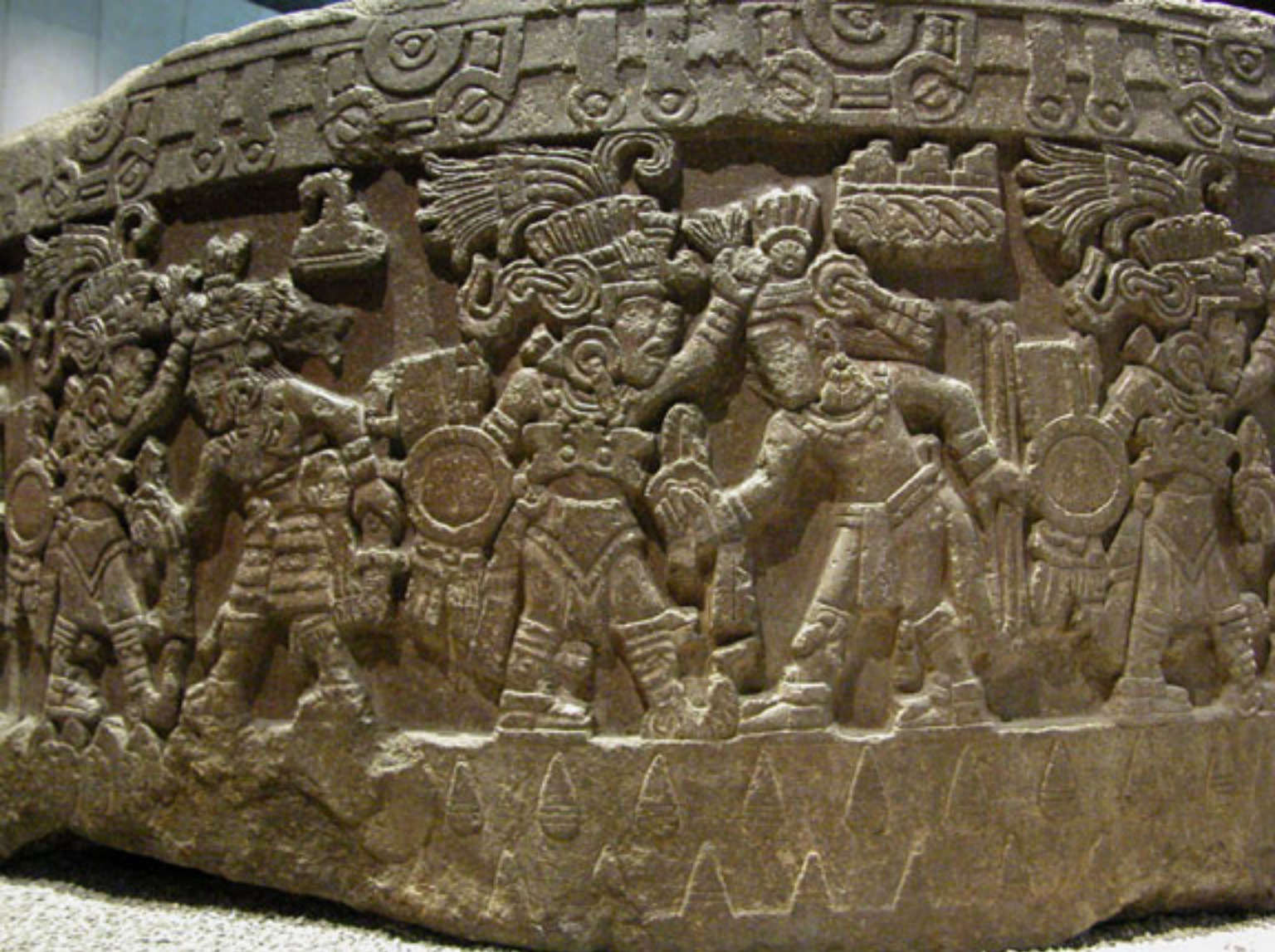
Figura 15. Detalle de la Piedra de Tizoc.