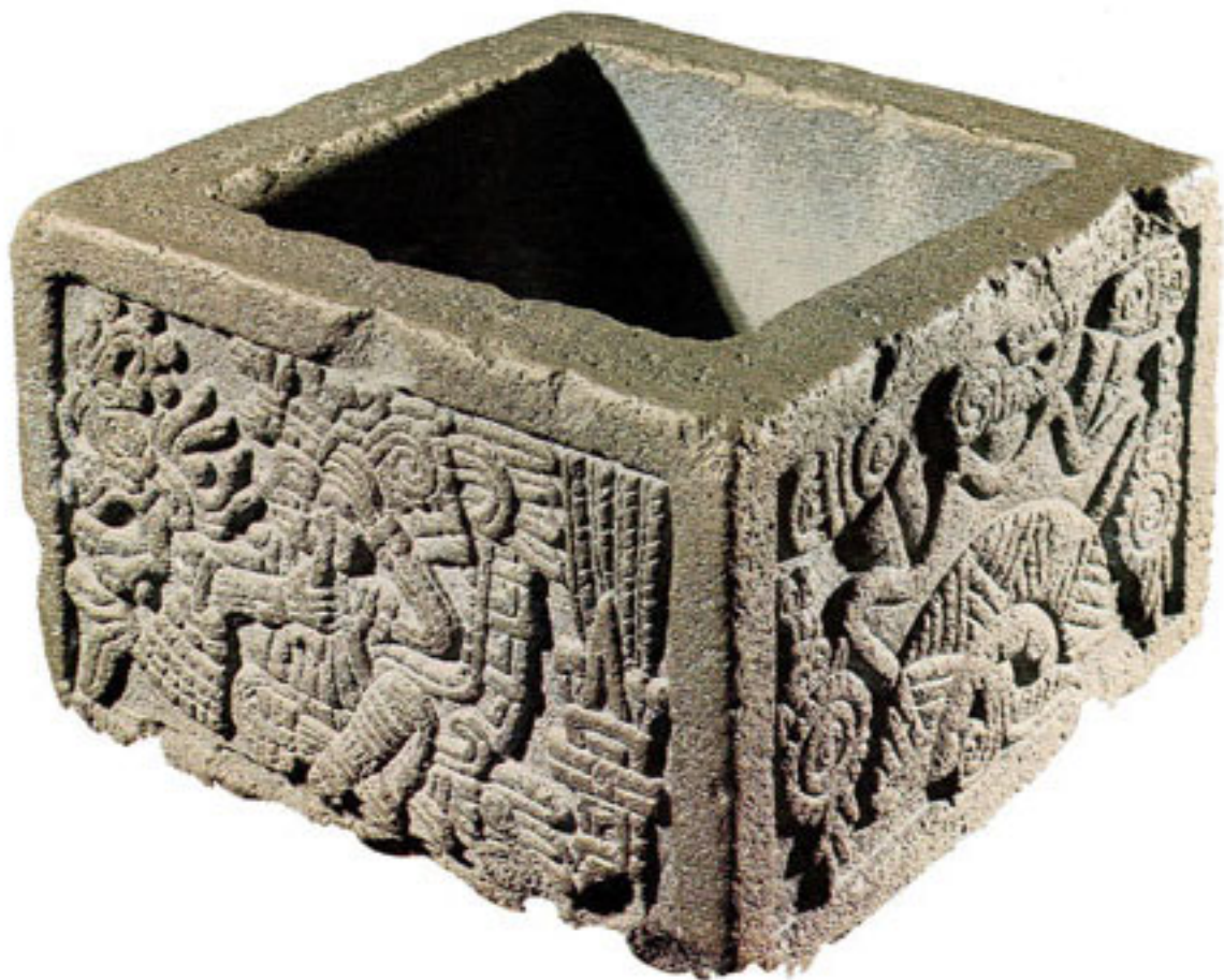
Figura 41. Tepetlacalli con figura que se extrae sangre y Zacatapayolli.