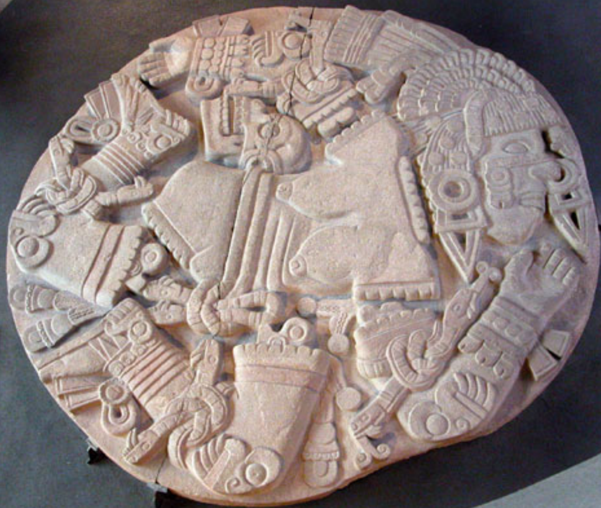
Figura 27a. Coyolxauhqui.