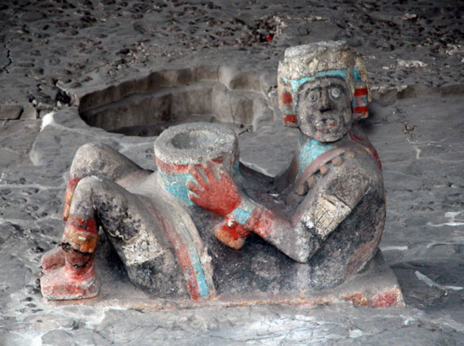
Figura 32. El Chacmool del adoratorio de Tlaloc (foto de Fernando González y González).