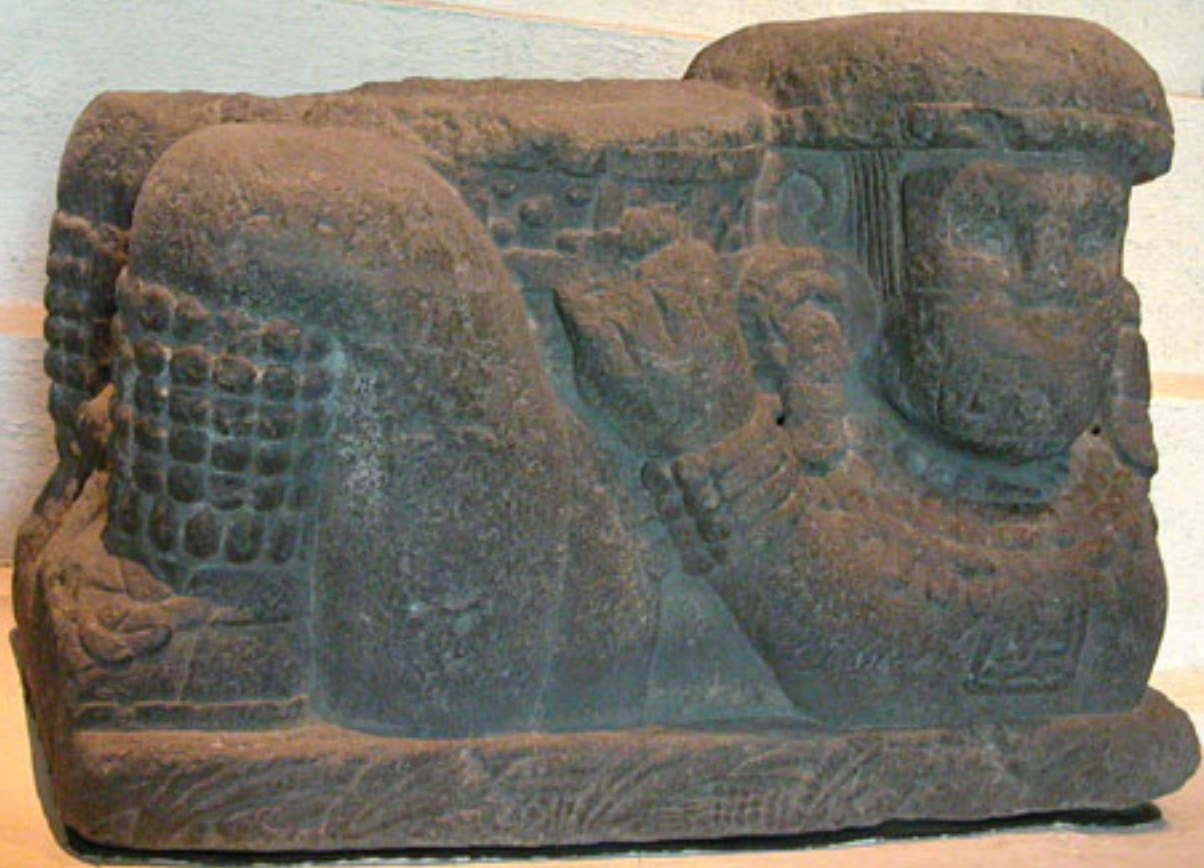
Figura 33. Tlaloc-Chacmool.