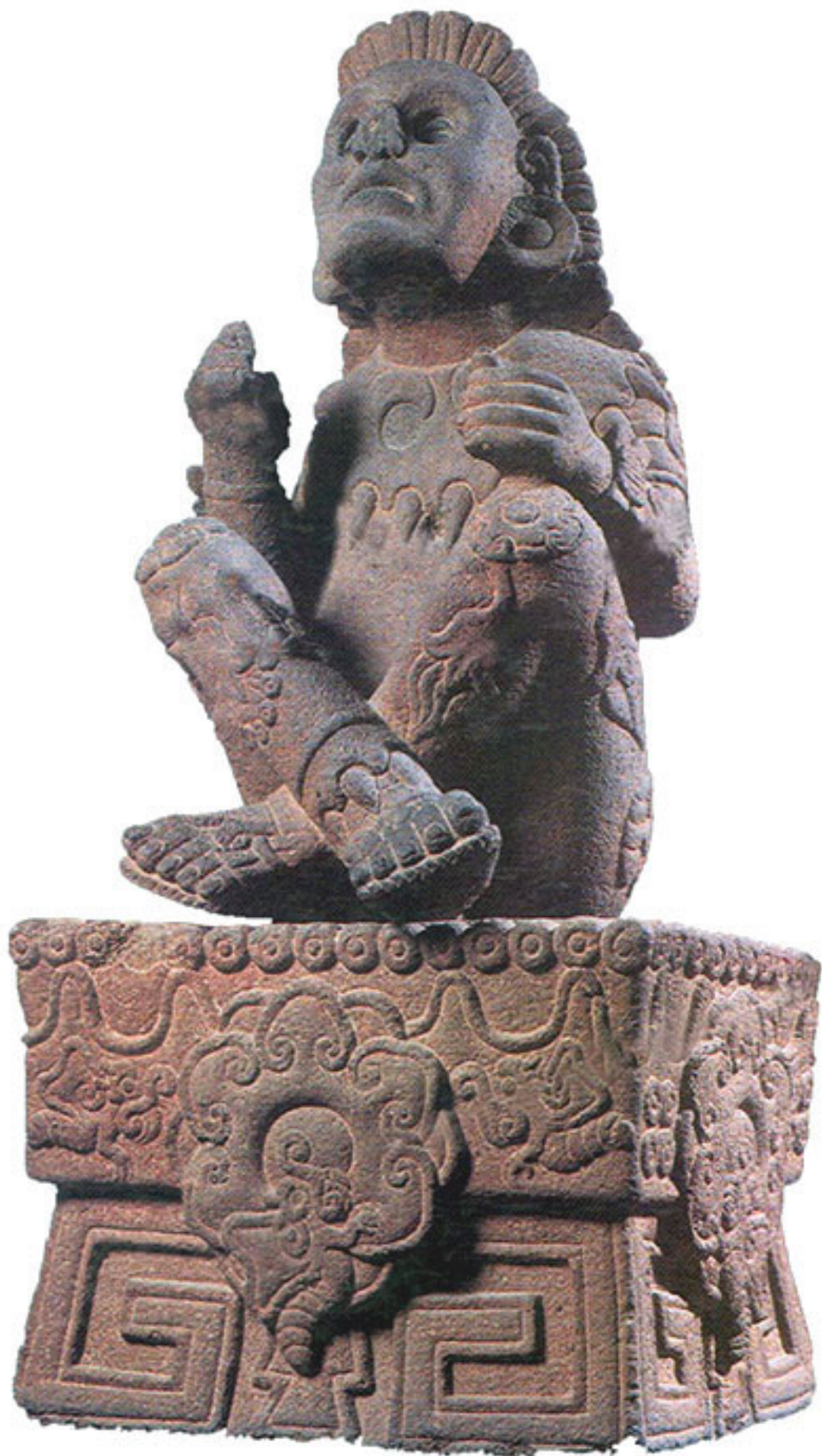
Figura 29. Xochipilli.