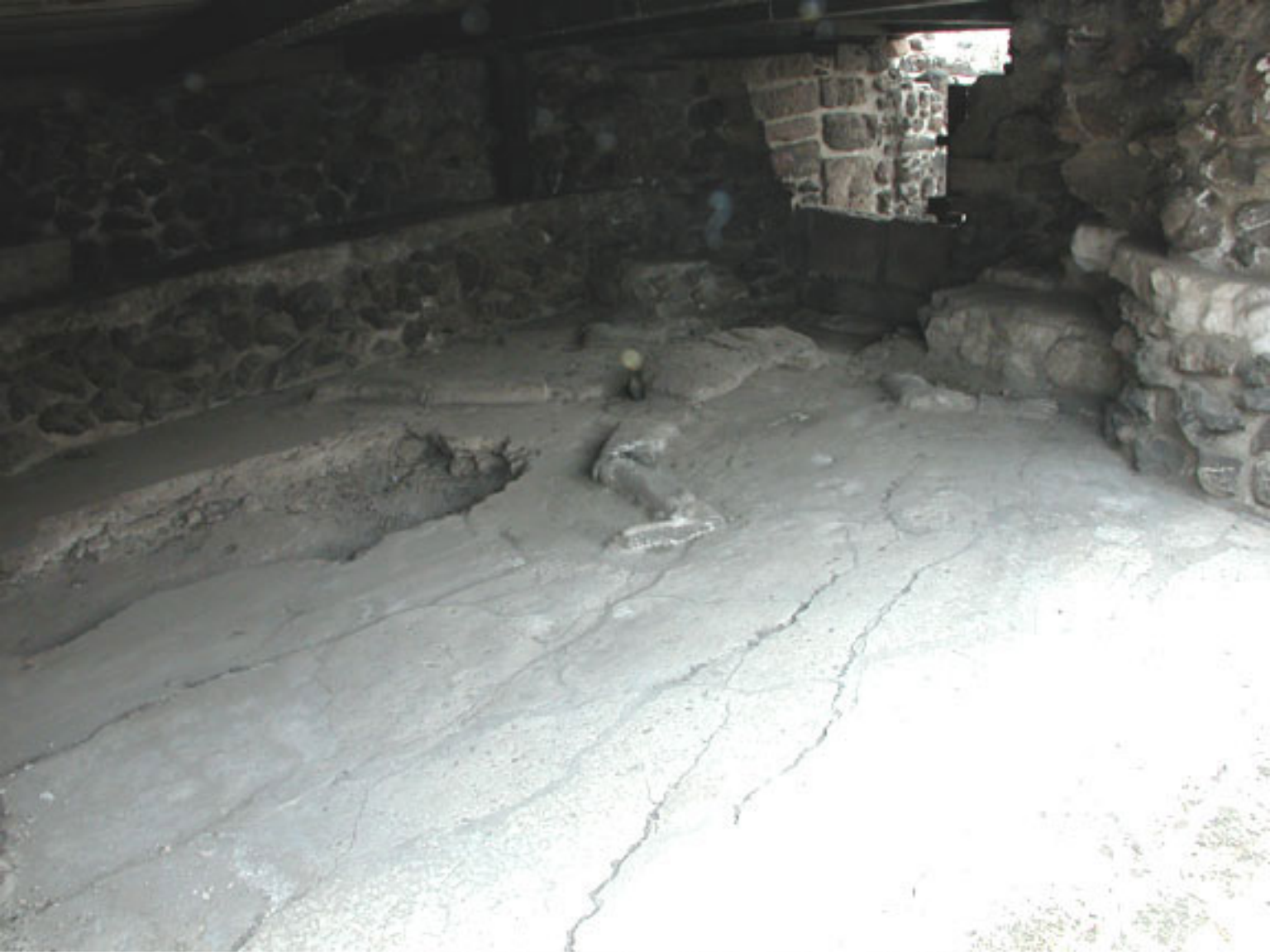
Figura 27b. Relieve más antiguo de la Coyolxauhqui.