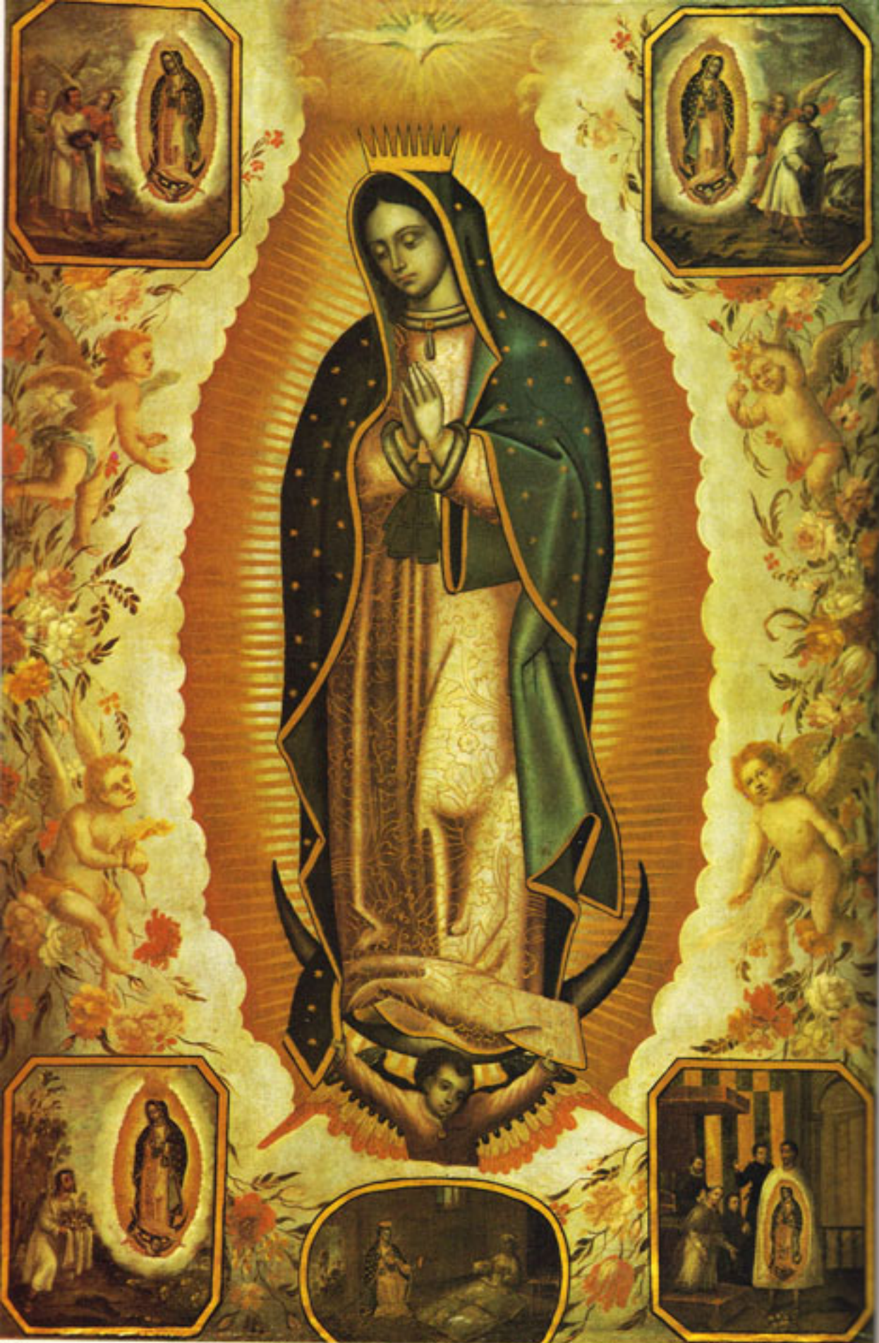
Figura 23. Retrato de la Virgen de Guadalupe.