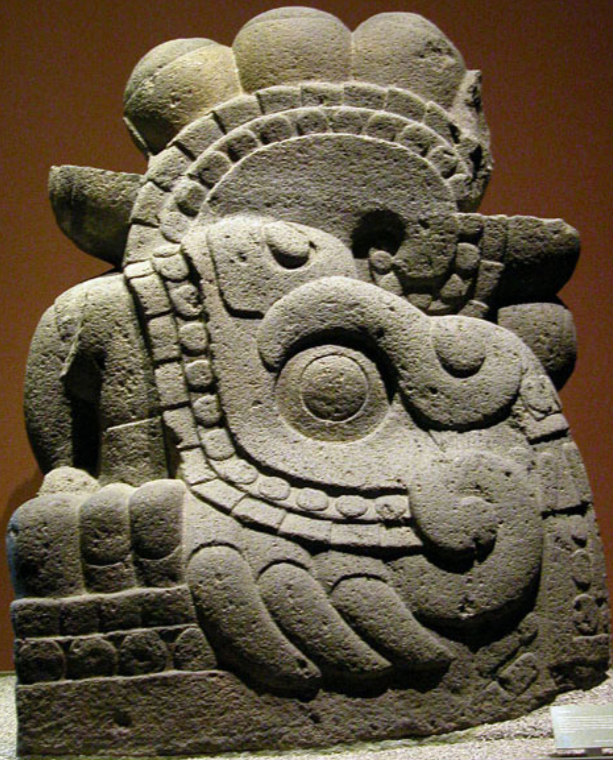
Figura 31. Xiuhtecuhtli.