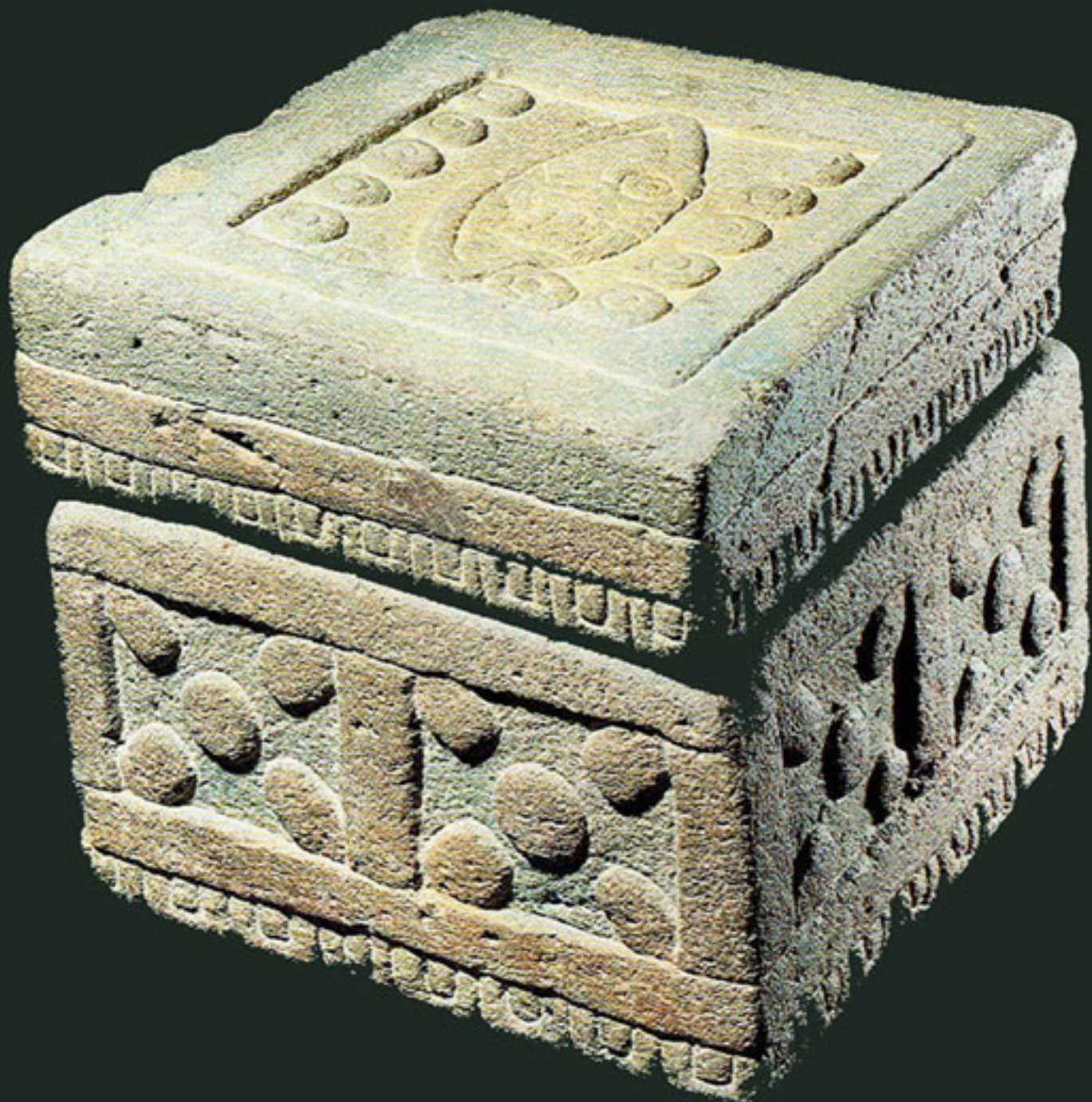
Figura 42. La Caja de Piedra de Motecuhzoma II.