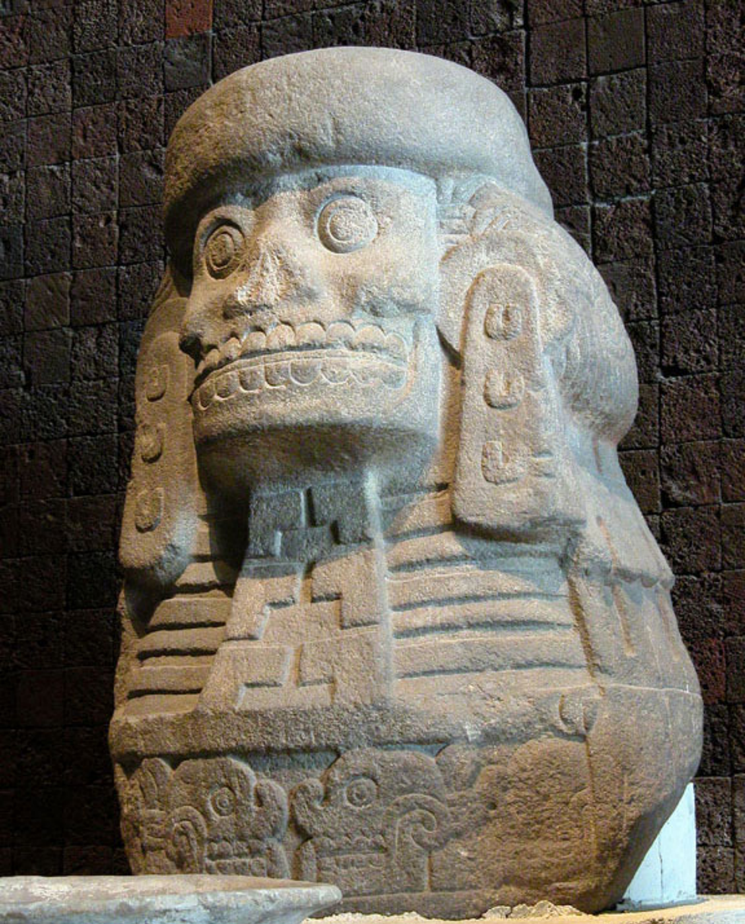
Figura 38. Cihuateotl.