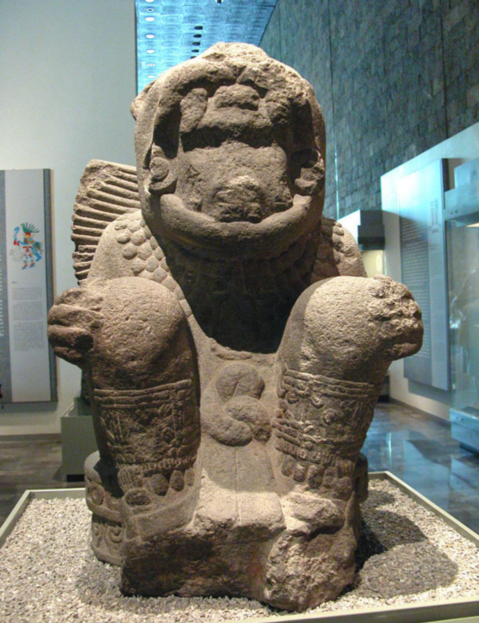
Figura 44. Guerrero Jaguar.