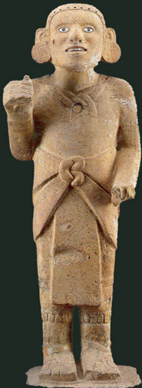
Figura 26. Estatua compuesta de Xiuhtecuhtli-Huitzilopochtli.