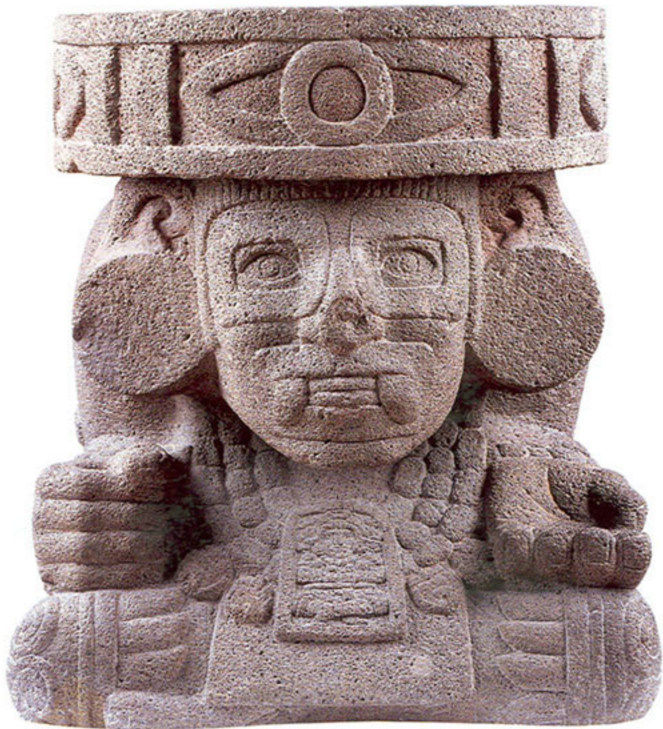
Figura 36. Huehuetēotl.