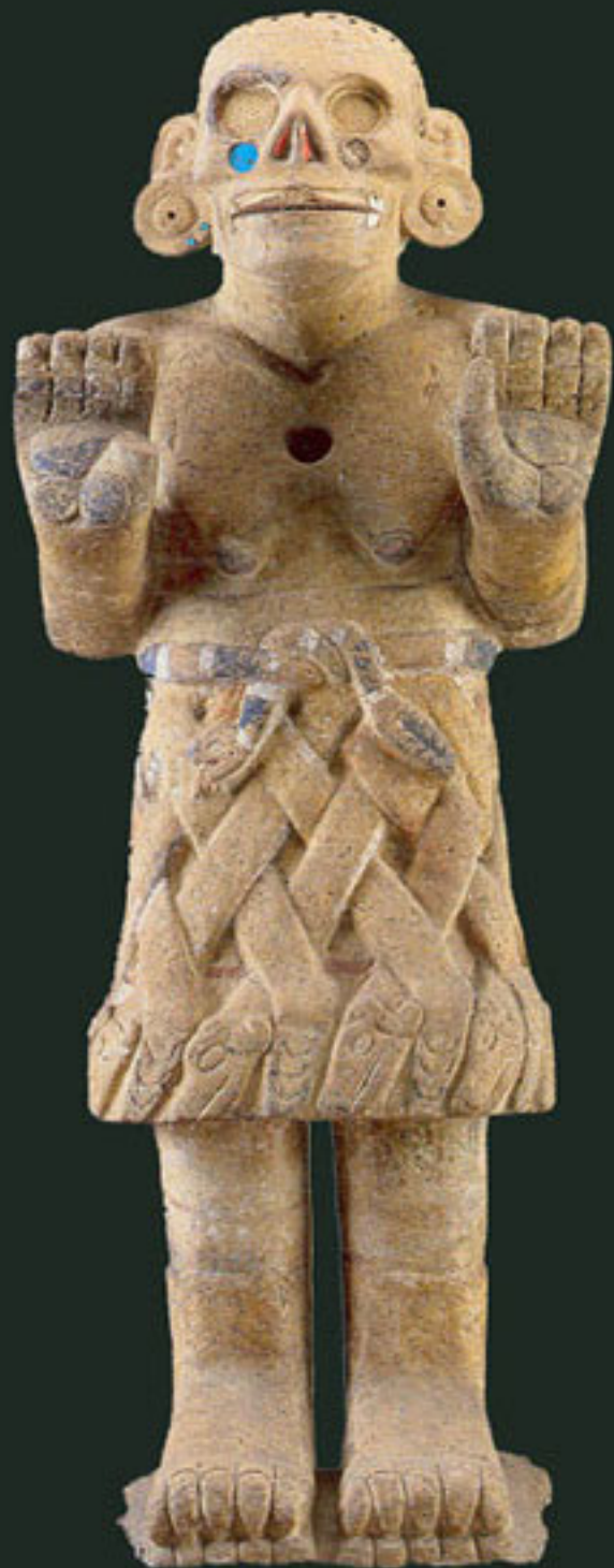
Figura 24. La Coatlicue de Coxcatlan.