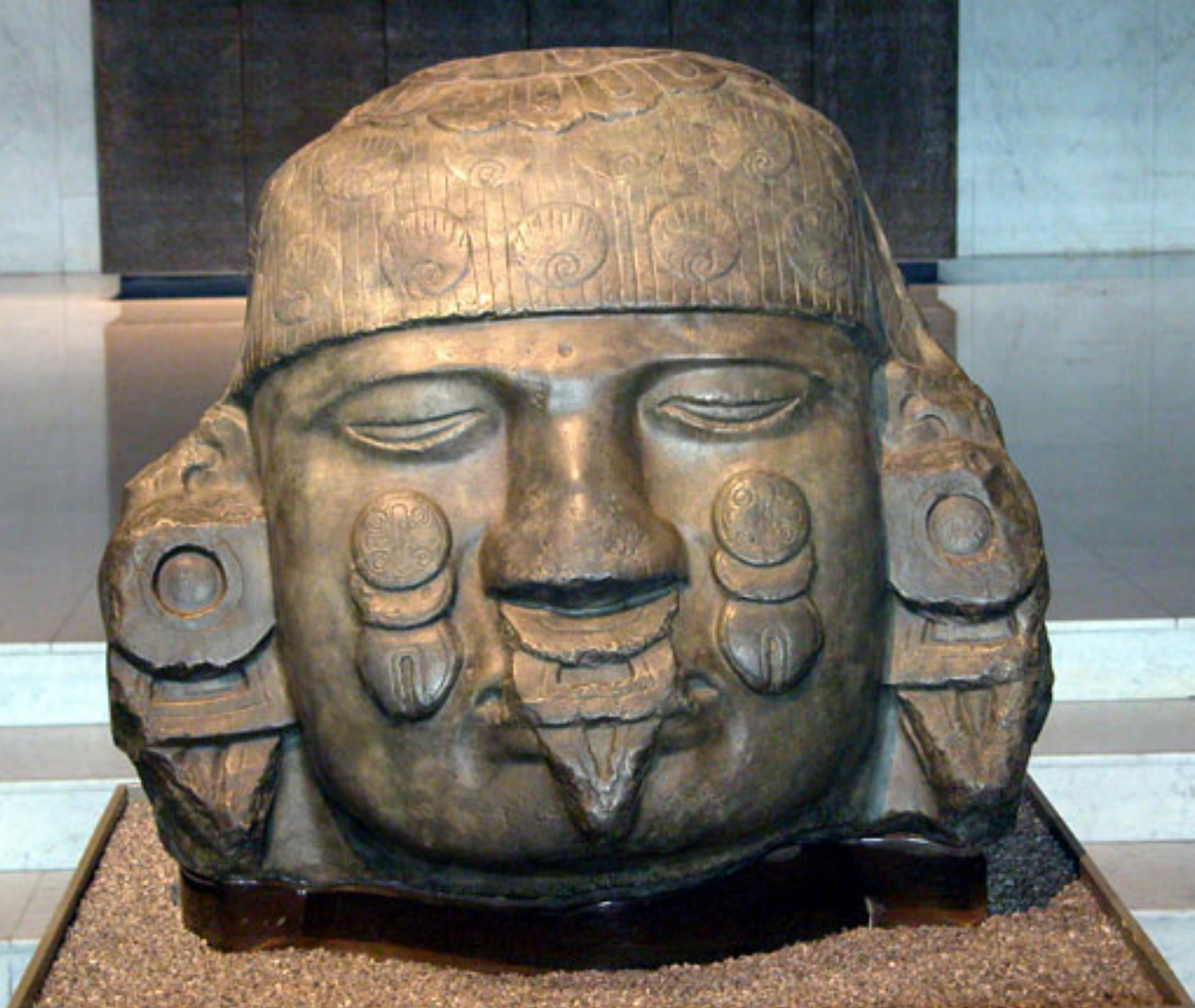
Figura 28. Cabeza de la Coyolxauhqui.