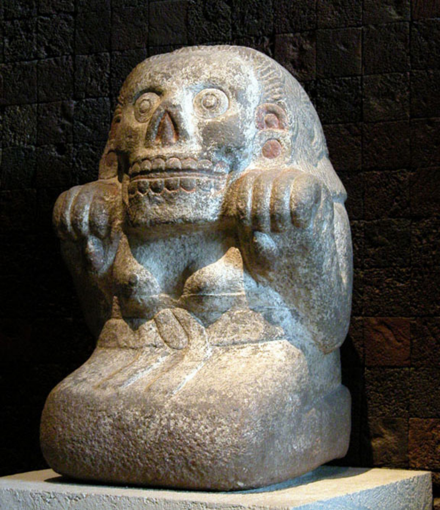
Figura 37. Cihuateotl.