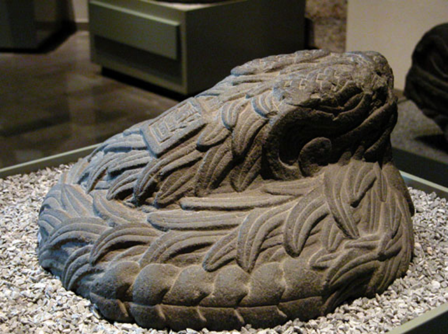
Figura 30. Serpiente Emplumada.