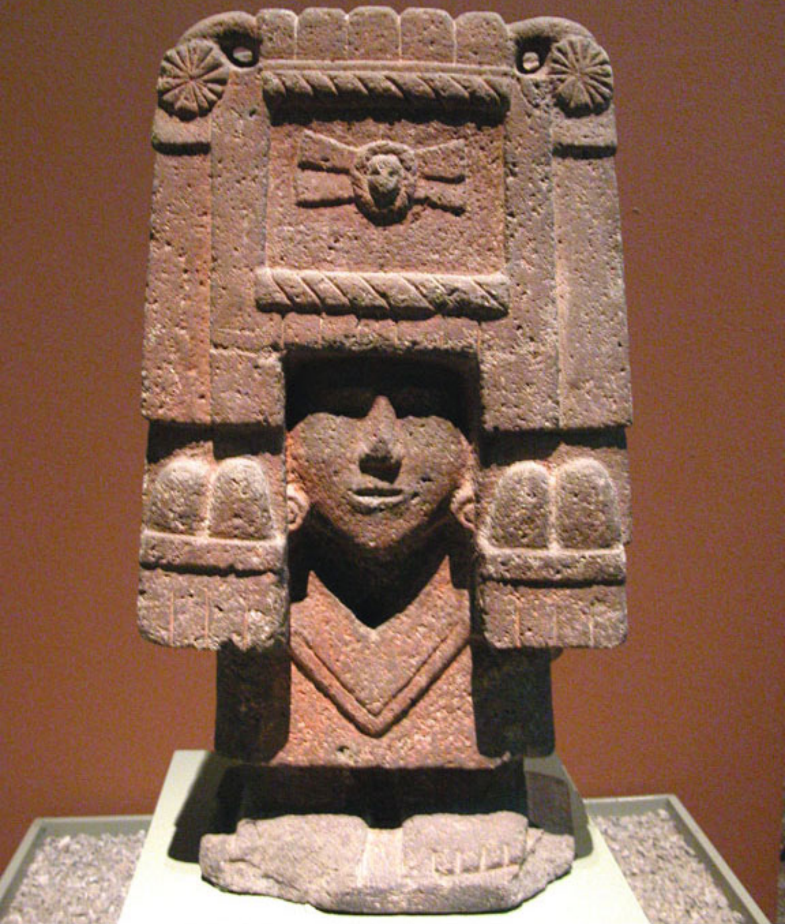
Figura 34. Chicomecoatl.