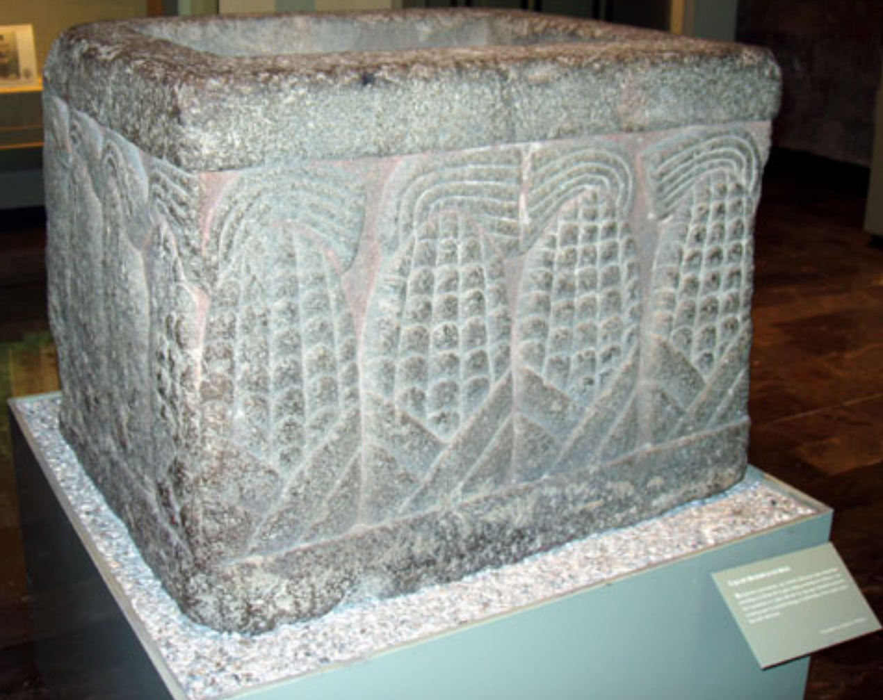
Figura 35. Altar con mazorcas de maíz.