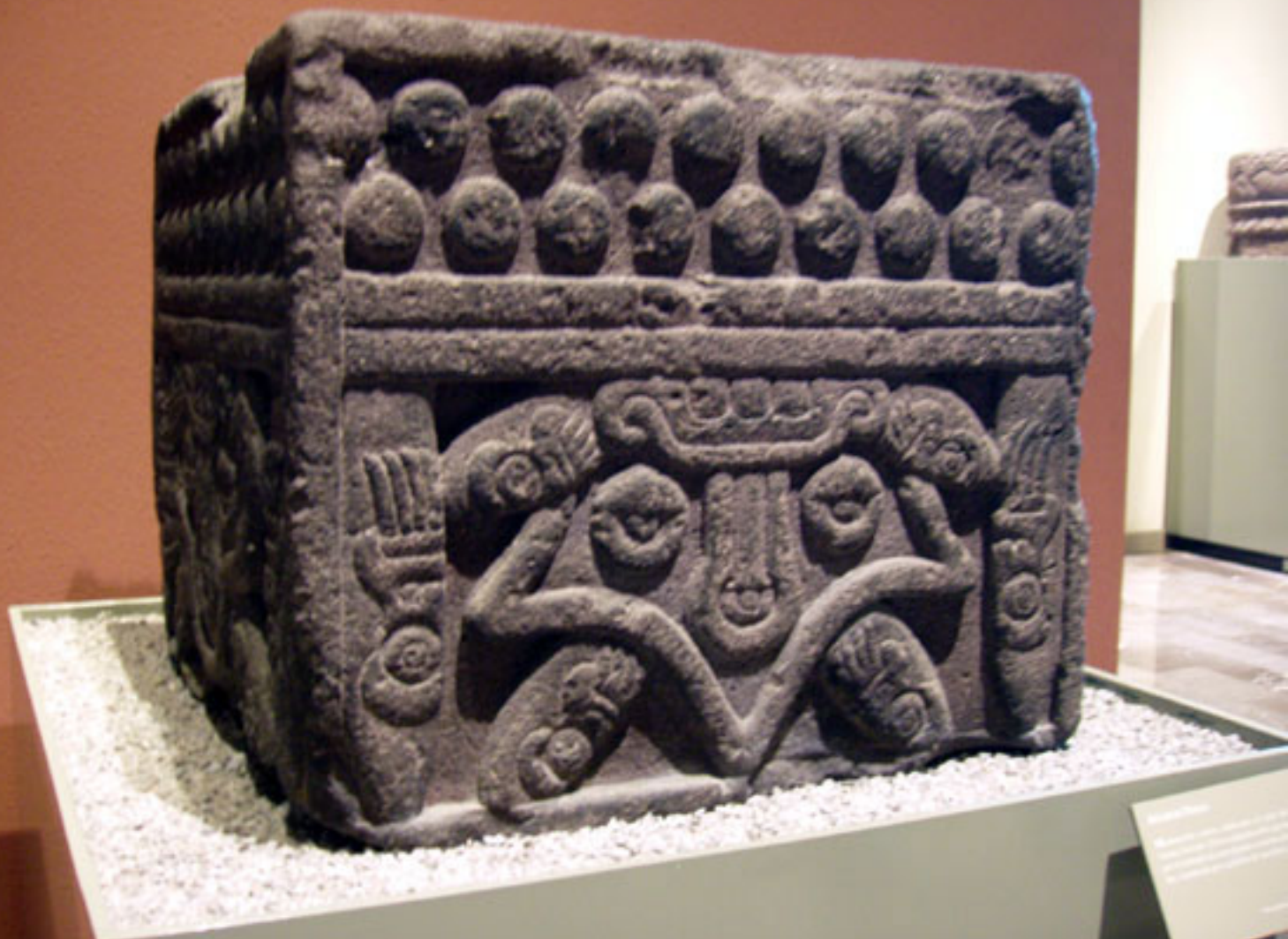
Figura 39. Altar del planeta Venus.