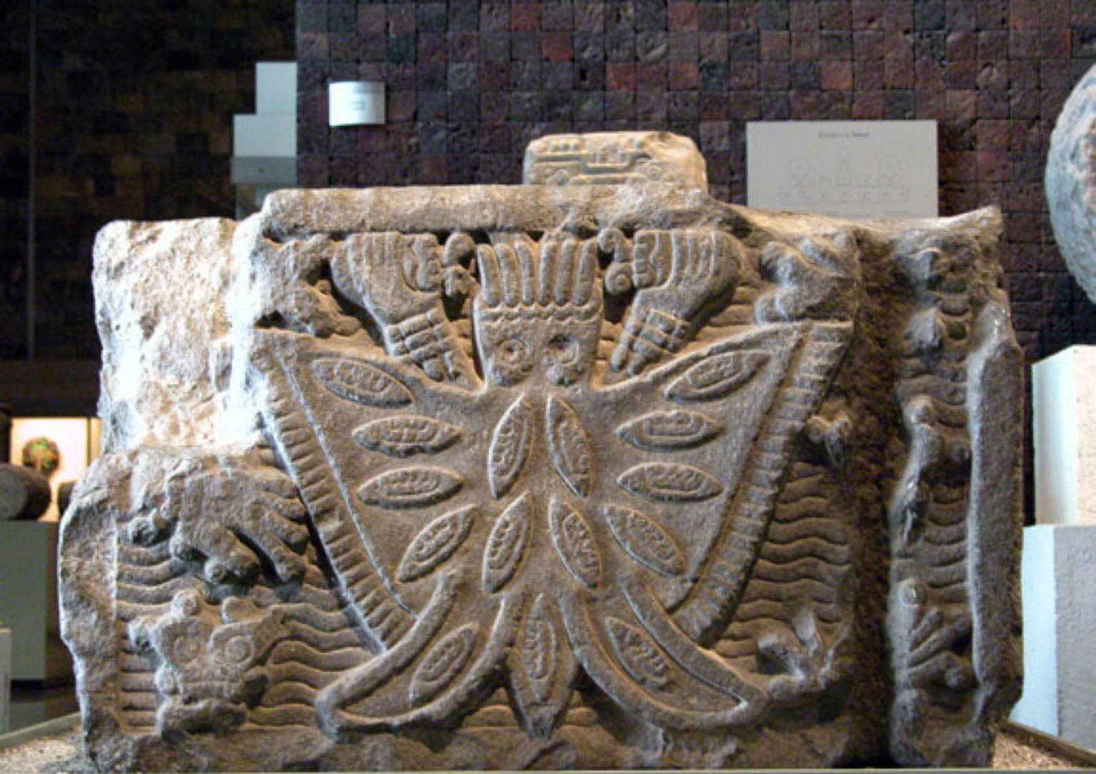
Figura 40. Altar de Itzpapalotl.