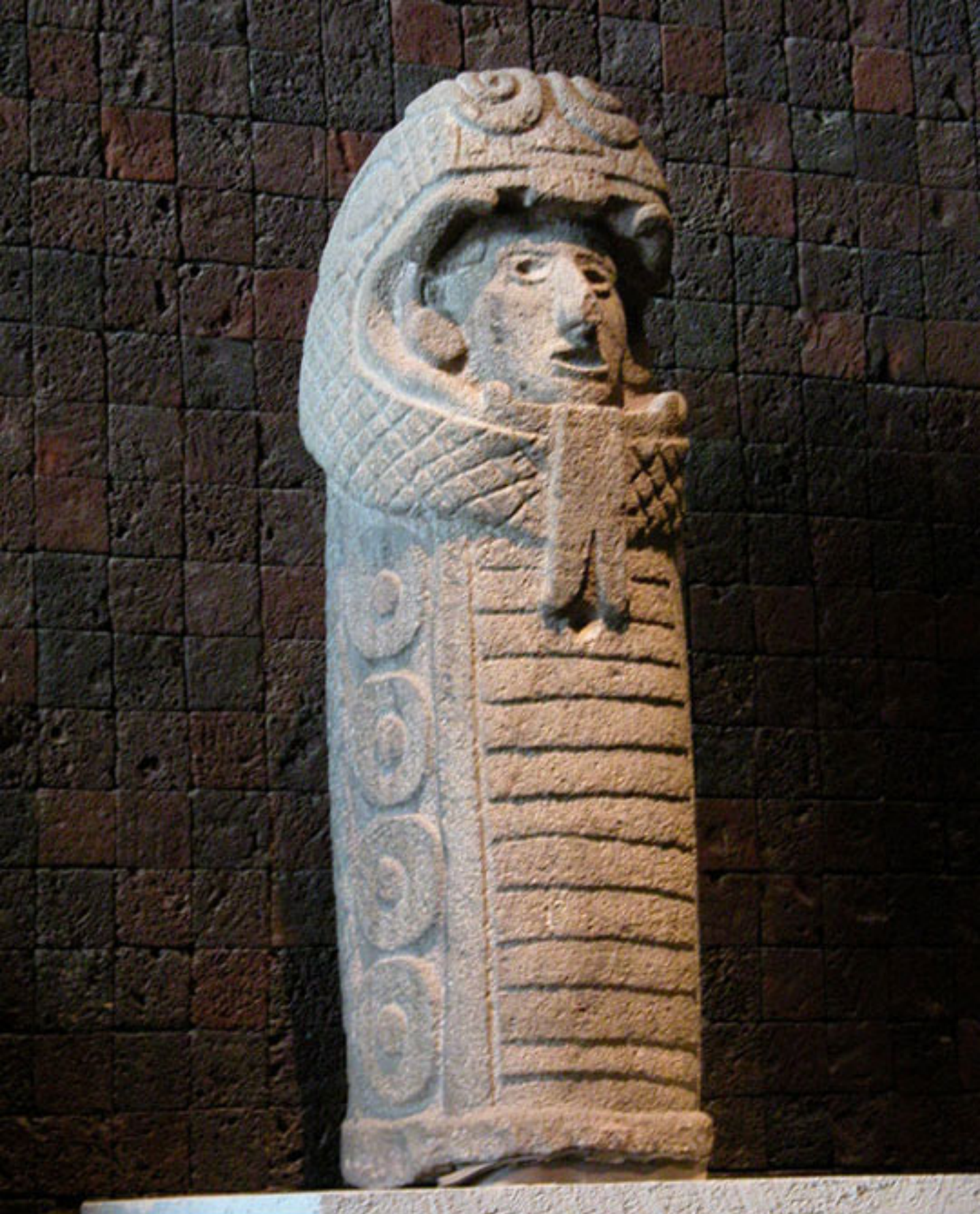
Figura 25. Ciuhuacoatl.